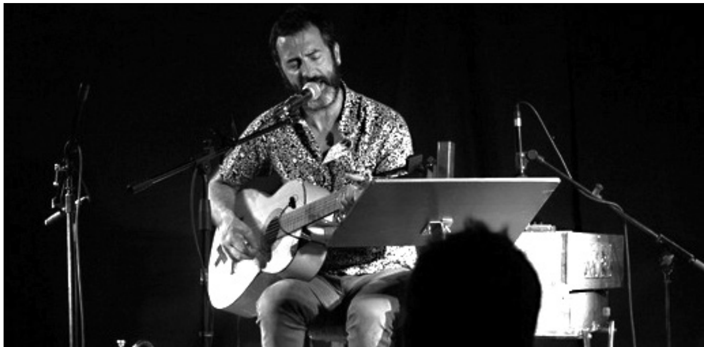
Amorantek 2017ko maiatzean Orioko kultur etxeko areto nagusian eskainitako kontzertuan.

Herri guztietako Udaleko kultur sailek hainbat ardura eta eginkizun izaten dituzte. Sail horren gain egoten da, esaterako, urteko kultur programazioa prestatzea eta koordinatzea, edota herriko eskaintza kulturala programatzea eta zabaltzea, udalerrri bakoitzeko kultur taldeekin elkarlanean.