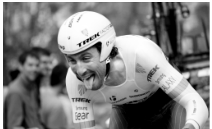
Aiako horma igotzen asko sufritu zuten txirrindulariek. KARKARA