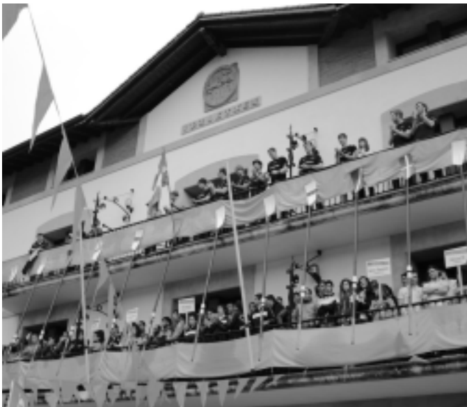
Nazioarteko Estropadetako partaideen aurkezpena . KARKARA