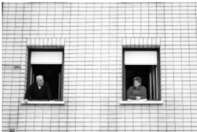
Aiar askok etxeko balkoi eta leihoetatik ikusi zuten Itzulia. KARKARA

Aiako horma. Aldapa motz bezain gogorra, luze egiten dena. Helmugara bidean azkena. Jende gehien biltzen duena. Txirrindulari batzuek maite eta besteek gorroto dutena. Igotzaileentzat ederrena. Zaleentzat ikusgarriena. Espektakulu handia eman dute txirrindulariek Aiako horman.