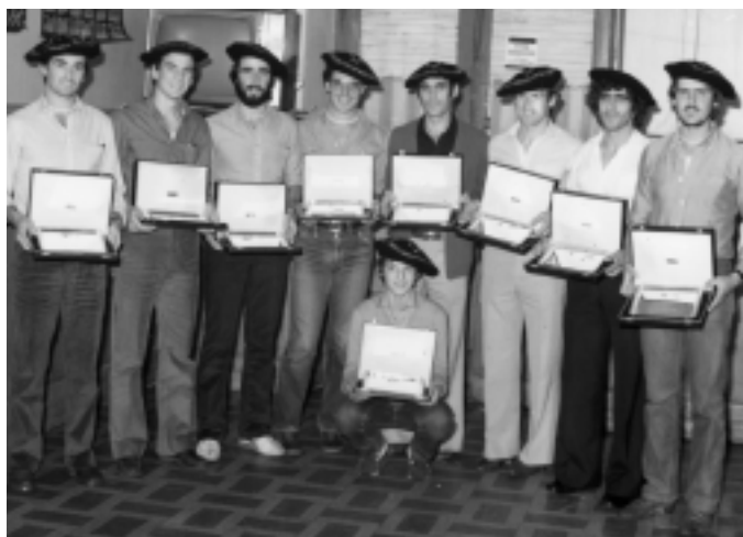
79ko Munduko txapelketetan, oriotarrak urrezko domina irabazi zuten.