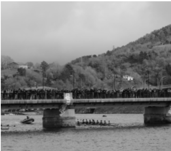
Jende asko etorri zen Oriora. Moila eta zubia zalez bete zen . KARKARA