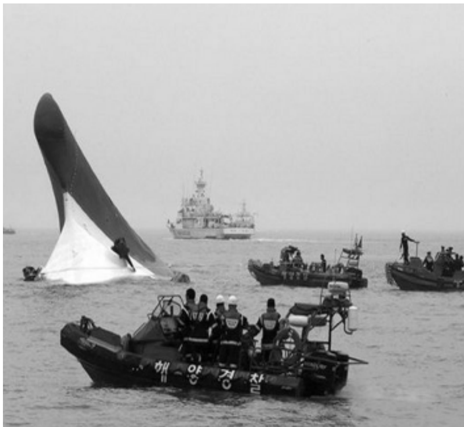
Apirilaren 19an etorkinez betetako ontzi bat hondoratu zen Mediterraneoan. RNV