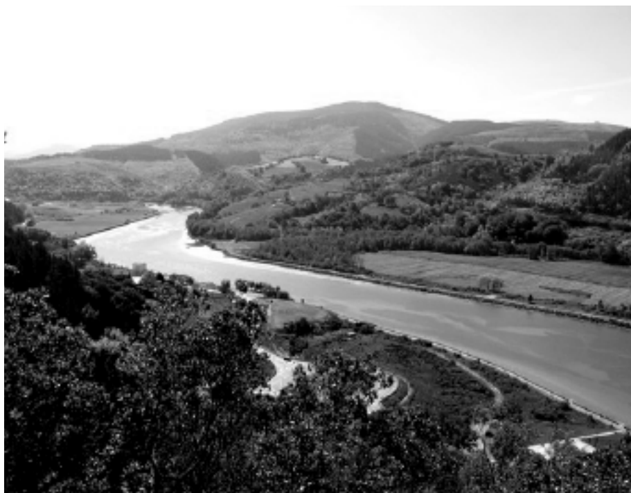
Motondoko irudia altueratik, goitik, hartuta . KARKARA

Oria erriorearen meandroen albo batean kokatzen da Orio herria.