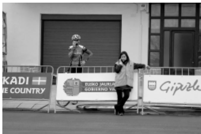
Boluntario asko aritu ziren lanean. KARKARA