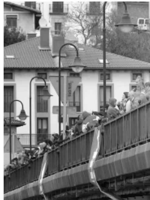
Ikusleak zubian. JOXEMARI OLASAGASTI