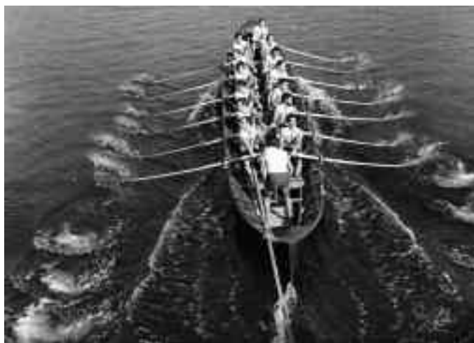
1970ko Oriok iraultza ekarri zuen euskal arraunketara.