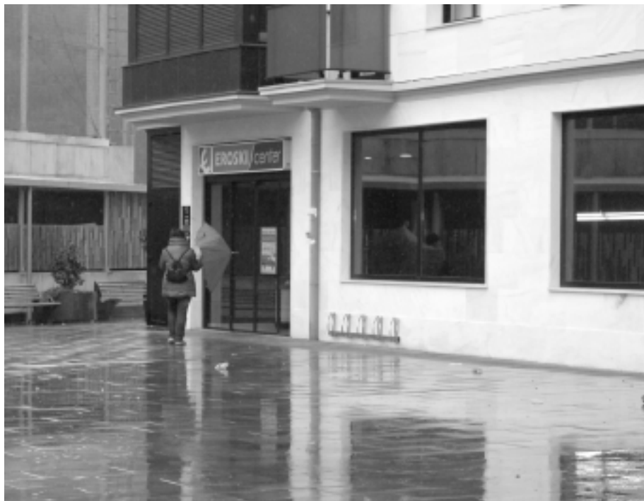
Orioko Eroski Berriaren kanpoaldea . KARKARA

Ingurune guztiek derrigorrezko ekipamendua dute, gutxieneko kopurua zehazten du legeak. Eta, bai ala bai, legeakeskatzen duen minimoa bete behar da.