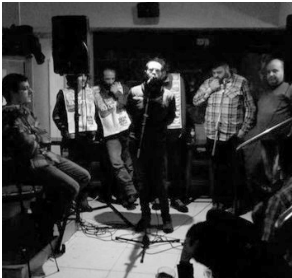
Orioko herritarren arteko bertso txapelketako finaleko irudia.