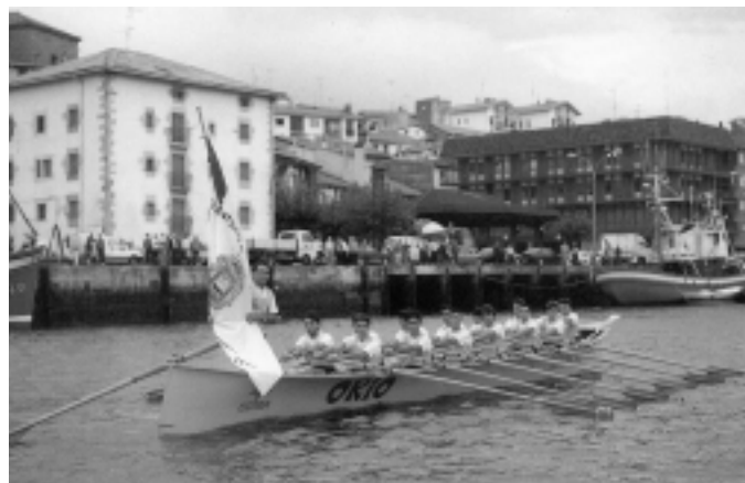
Hamar urte itxaron ondoren Kontxako bandera berri zuten.

Nabarmena zen Orio traineruen lehen mailara itzuli zela. Kortaren bueltarekin, eta babesle indartsuei esker, taldean gaur arte irauten duen oinarri sendoak jarri ahal izan ziren.