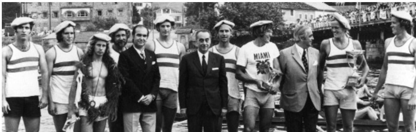
Amerikako Estatu Batuetako arraunlariak ere izan ziren urte haietan Oriaren uretan.