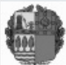
Eusko Jaurlaritza Kultura Sailak diruz lagundutako hedabidea