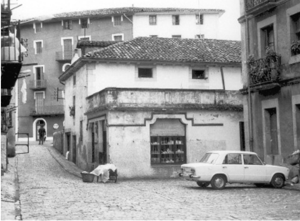
Ederki aldatu da herria 1960ko hamarkadatik hona.