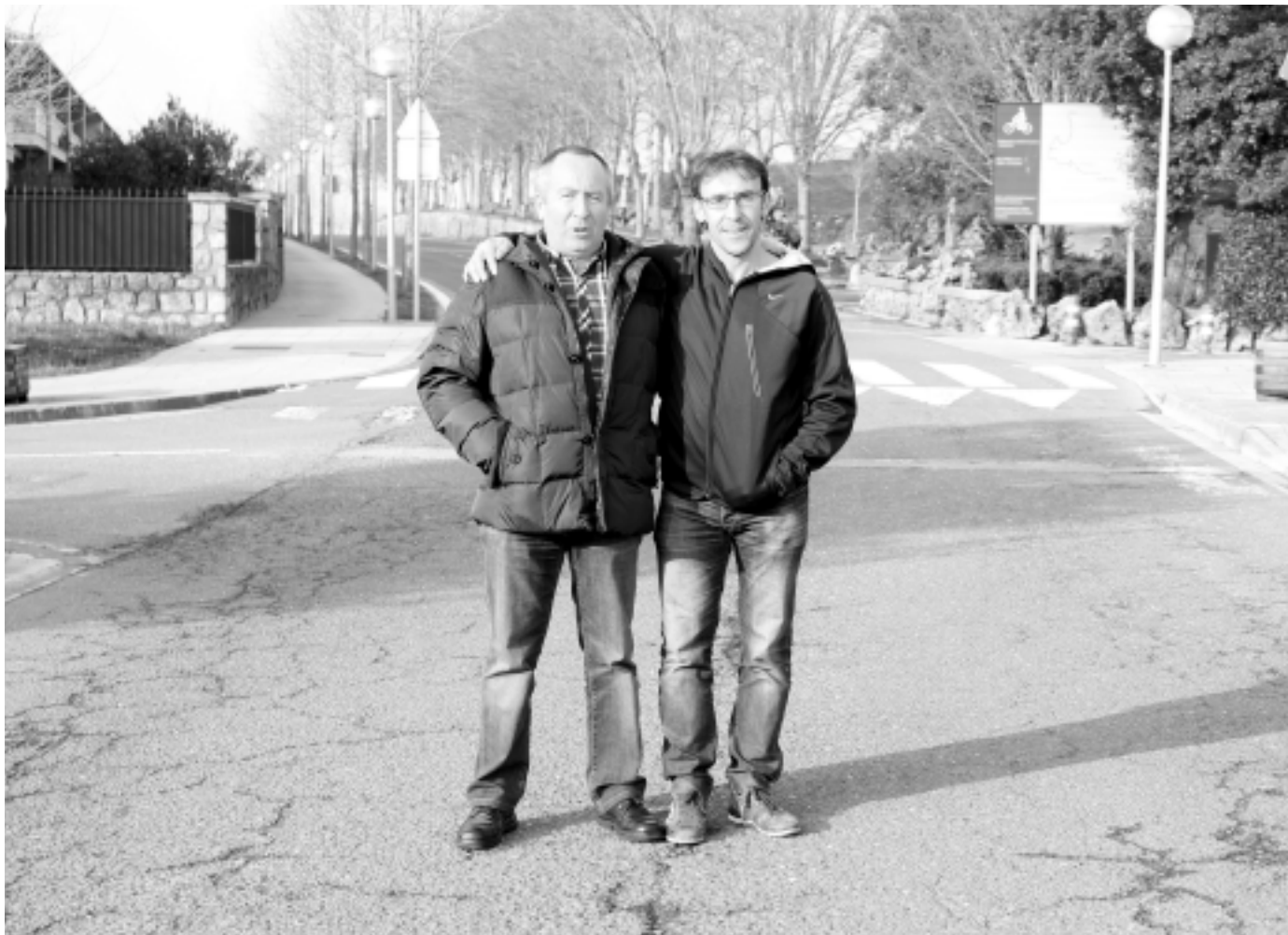
Gonzalez de Txabarri eta Iturain, itzuliko azken bi etapen helmugan. KARKARA

“Itzulia antolatzeak lan handia dakar, 100 boluntario inguru behar ditugu dena ongi joateko: 70 ibilbidean eta beste 30 herrian bertan.”