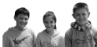
Lardizabago 6. maila

Martxoaren 16an, Lardizabal Herri Eskolako 3., 4., 5. eta 6. mailako ikasleak eskiatzera joan ginen. Txangoa lau urtetik behin egiten dugu Lintzako aterpera eta Aretteko estaziora. Lintzan bi egun egin ditugu iraupeneko eskia egiten. Hirugarren egunean, Aretteko estaziora joan ginen, eta han malda ederrak jaisteko aukera izan genuen. Eskolako irakasleez gain, eskiatzen irakatsiko ziguten irakasleak etorri ziren. Primeran pasa genuen!