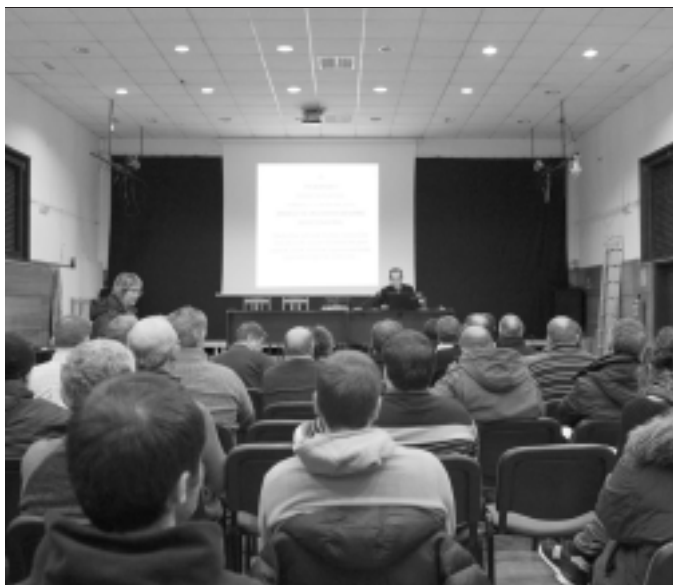
Plan Orokorra lantzeko bost bilera egin dira. KARKARA