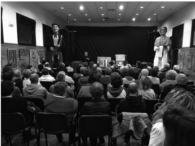
Jendetza kultur etxean, peatonalizazioa hizpide hartuta. KARKARA