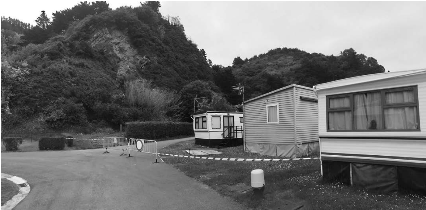
90 tona inguru harri erori ziren kanpinera apirilean. KARKARA

Apirilaren 12an, goizaldeko 13:00aldera, luizia izan zen Orioko Kanpinean.