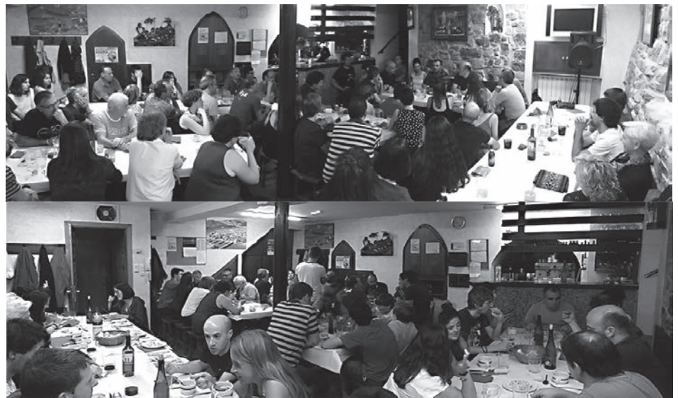
Joan den apirilean Arkaitzpe elkartean egindako bertso afaria.