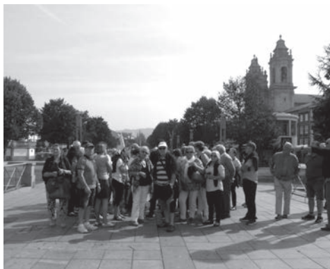
Txomin Iribar Jubilatuena Elkartearen Presidentea

Datorren irailean Andaluziara egingo dugu bidai, 17tik 25era. Interesatuak oraindik izena emateko garaiz dabilta, telefonoz deituz.