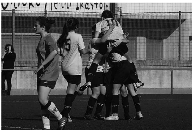
Orioko futbol taldeko kadete neskek, gola ospatzen. KARKARA