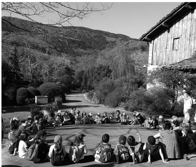
Ikasle talde bat, Iturraran Parketxeko bisita gidatuan.