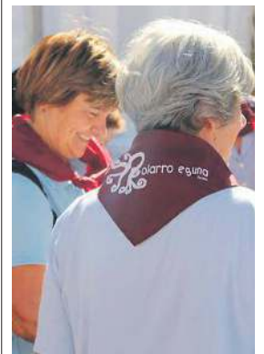
Olagarro Eguneko argazki bat.

JAIKAK // 2023ko Olagarro Eguna ohi baino geroago ospatuko dute aurtengoan, Zumaia Udalak jakinarazi duenez. Horren arrazoiak Zumaia triatloia proba dela azaldu du erakundeak. Aurtengo ere egingo dute herrian hain kutuna den Olagarro Eguna, baina astebete geroago. Hori horrela izanda, triatloia irailaren 16an jokatuko dute, eta Olagarro Eguna, berriz, irailaren 23an izango da.