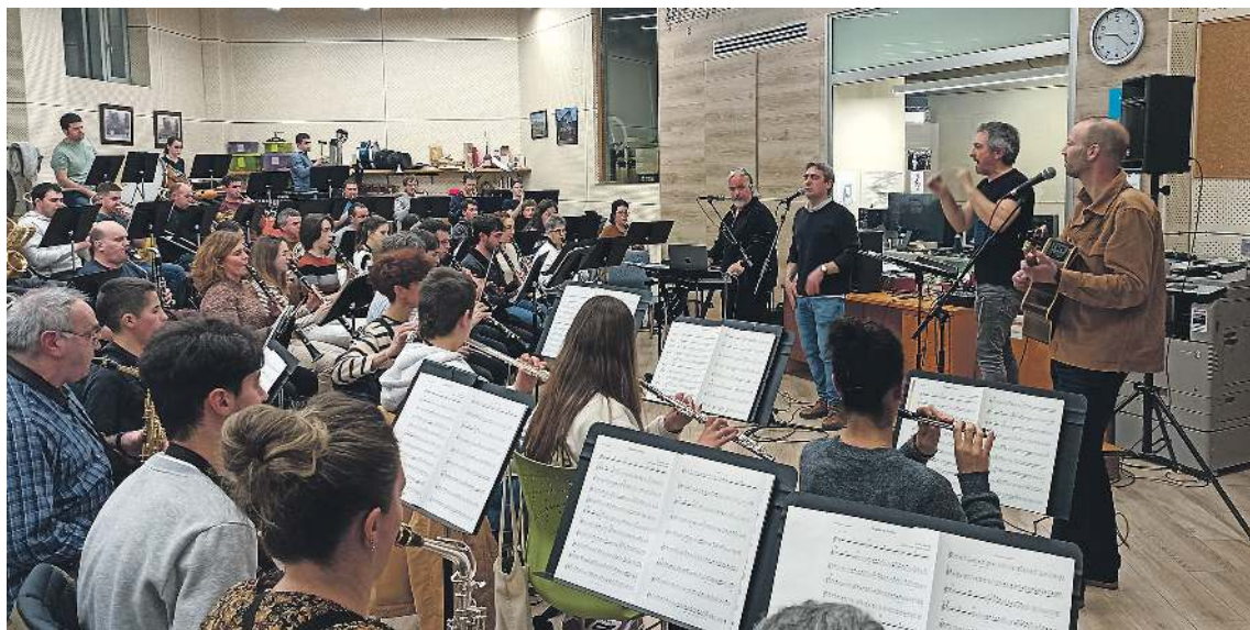
Azpeitiko Udal Musika Bandako eta Sorotan Bele taldeko kideak herenegun egin zuten azken entsegu orokorrean. MAIALEN ETXANIZ

HITZAK ez du bere gain hartzen egunkarian adierazitako esanen eta iritzien erantzukizunik.