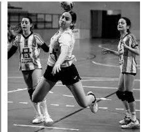
Orio Eragineko jokalaria. S.CUBERO

Gaiaren inguruko gogoeta egin nahi izan du, baina «teorizatu gabe»; adibide argiak azalduz, alegia: «Aplikazio horietan badira, esaterako, Kaixo esan aurretik zuzenean biluzik agertzen diren argazkiak bidaltzen dituzten pertsonak». Gai hori eta beste hainbat jorratzen ditu Sex Sua antzezlanean.