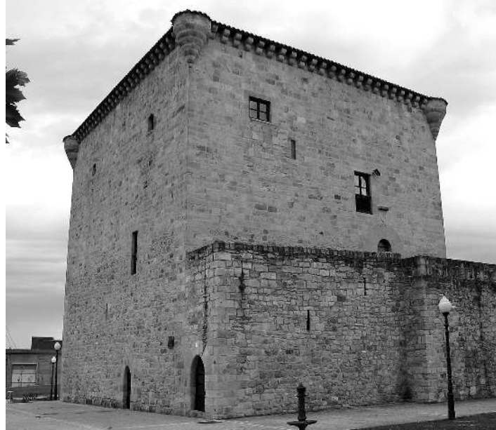
Malpika dorretxea, Zamudio. WIKIPEDIA

Esate baterako, lehenago majadero totala zelako ondorengoa hobea izan beharko lukeen Biden jaunak, Ameriketako Estatu Batuetako agure goren eta zahar-