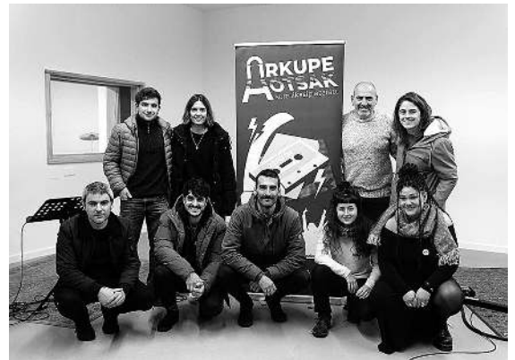
Arkupehotsaken parte hartu duten musikariak, horien bidegile izan diren sortzaileak eta Kulturazeko kideak. KULTURAZ KOOPERATIBA

martxan jarritako proiektua da Arkupehotsak, eta lau edizio osatuta, berrituta iritsi da sortzaile berrien plaza izateko sortutako egitasmoaren bosgarren aldia. Urte hauetan guztietan dozenaka talde izan dira Sanagustingo arkupeko agertokian zuzenekoak eskaintzen. Dena den, zuzenekoetatik haratago, sormen eta transmisio proiektu osatua bilakatu du Kulturazek.