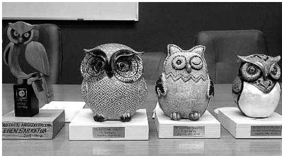
Gau Txori argazki rallyko sariak.

Sari banaketa ekitaldia noiz egingo duten ez dute zehaztu oraindik, baina lau sari izango dira eskuragai: bilduma onenaren saria (150 euro eta garaikurra), bigarren sailkatuaren saria (100 euro eta garaikurra) eta hirugarren sailkatuaren saria (70 euro eta garaikurra). Era berean, sari horiek jasotzen ez dituen herriko lehen sailkatuak ere garaikurra eskuratuko du.