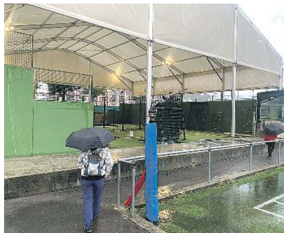
Bi padel pista ditu Lubaki kiroldegia. JUAN LUIS ROMATET

Bi padel pista ditu Lubaki kiroldegia eraikinaren kanpoaldean, tenis pistaren alboan. Kanpoan egonda, euririk arazo bat baino gehiago sortu izan ditu urte hauetan guztietan. Hasiera batean, euri ura bi pisten arteko estolda zulo baten bidez jasotzen