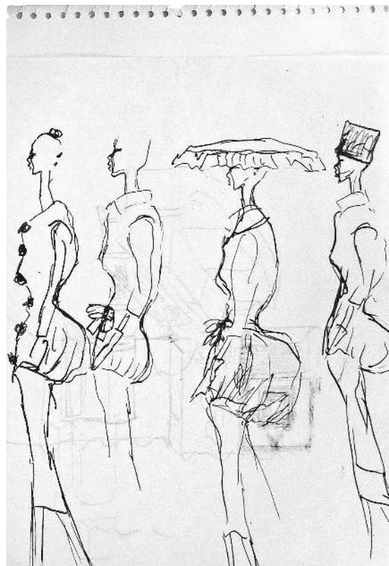
Euskadiko Artxibo Historikoaren esku gelditu diren bildumako marrazkietako bi. Goikoak ehun lagina ere badu. EUSKO JAURLARITZA