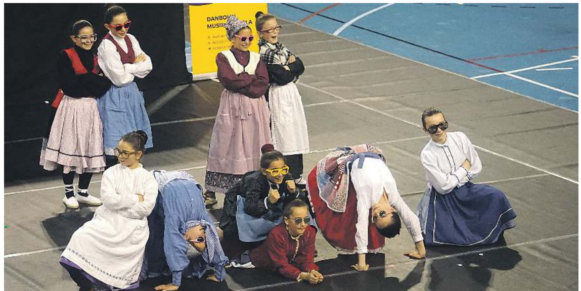
Danbolin musika eskolako dantza ikasleen 2022ko ikuskizuna. AITZIBER ARZALLUS

Urtarrilaren 22an, pasa den igandean, hasi zen aurtengo lehen hiruhileko kultur programazioa, Ainarak dokumentalaren proiektioarekin eta Anne Etxegoien kontzertuarekin. Martxoaren 31 bitartean luzatuko da neguko kultur egitaraua, eta adin guztietako herritarrei zuzendutako hamazazpi ekitaldi biltzen dituela nabarmendu du Orioko Udalak: ipuin kontaketa, antzerkia, erakusketak, hitzaldiak, kontzertuak, ikuskizunak... Ekitaldietarako sarreak eta gonbidapenak astebete lehenago jarriko dituzte eskuragarri Kultur Etxean.