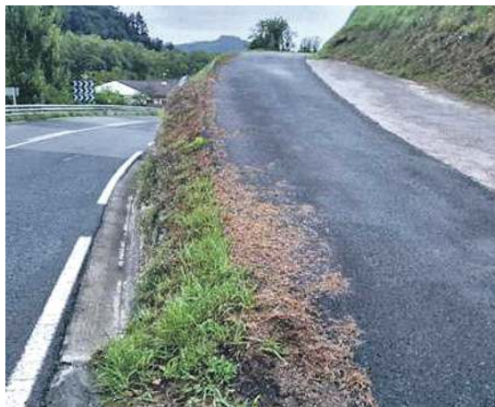
Erlauta auzorako errepidea.

Udalaren arabera, lanek 5.000 euro inguruko aurrekontua izango dute, eta aurreikuspenak betetzen badira, hilabeteren buruan amaituta izango dira lanak.