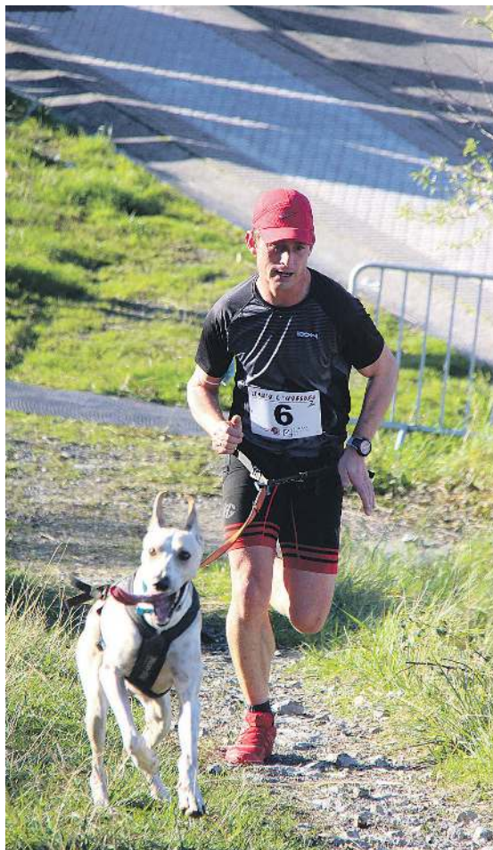
Parte hartzaile bat Basustarako aldapan. ONINTZA LETE ARRIETA

Izena kronoak.com webgunean eman daiteke bihar gauerdian arte. «Gaur egun 50 bat parte