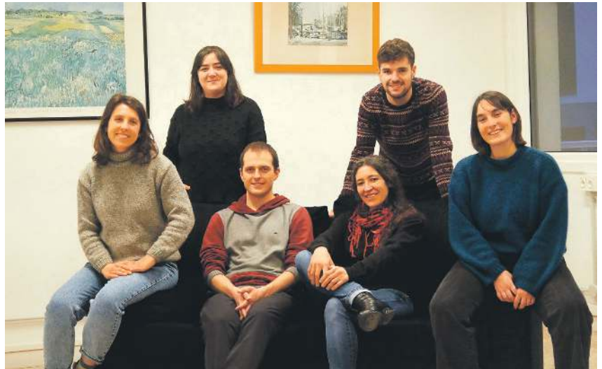
Alberga sortu duten Zumaia lagunak. ALBERGA

«Zumaia eta zumaia beharrak identifikatu, eta horiek asetzeko tresnak pentsatu eta garatzen» hastea da Albergaren beste helburuetako bat. Gainera, ekonomia sozial eraldatzailean oinarritzen diren proiektuak sustatzea, eta proiektu horien aterpe izango diren espazio fisikoak sortzeko asmoa ere badute. «Lanaren burujabetza ahalbideratuko duten bideak jorratu», «ekintzaileen eta proiektu sozialen arteko