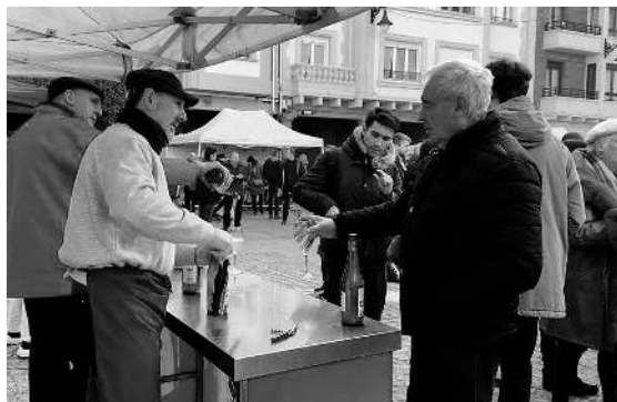
Igandean Sagardo Eguna ospatu zuten Zarautzen.