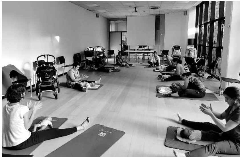
Udazkenean egin zuten Erditu ondorengo ikastaroan hartutako irudi bat.

Batukada Feministaren saioak Azkoitian zein Azepeitian eskainiko dituzte aurreneko aldiz. Hain zuzen ere, astelehenetan izango dira saioak ekainaren 12ra bitartean, 18:00etatik 20:00etara, Xabier Munibe Ikastolan eta Azepeitiko Emakumeen Txokoan, txandaka. Udalak azaldu du 2022ko ikastaroaren jarraipena dela, baina parte hartu nahi dutenentzat izen ematea zabalik dagoela. Haurdunaldirako yoga ikastaroa ere astelehenetan izango da, urtarrilaren 23tik ekainaren 26ra; 18:30etik 20:00etara egingo dituzte yoga saioak, Elkargunean. Xilografia ikastaroaren saioak, berriaz, asteazkenetan izango dira, martxoaren 1etik apirilaren 19ra bitarte-