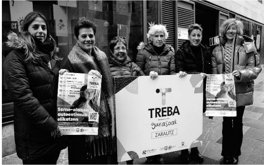
Treba egitasmo hitzaldi eta tailerren aurkezpenean, Zarautz Herri Hezitzaileko kideak. ARITZ MUTIOZABAL

Gazteentzat, berriz, hitzaldi eta tailer bana antolatu dituzte, eta 16-30 urte bitartekoei zuzen-