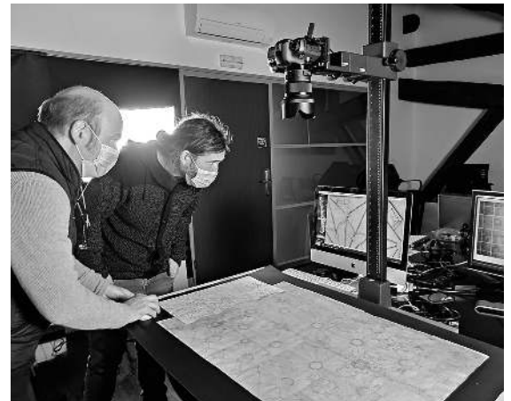
Zenbait dokumentu digitalizatu dituzte Udal Artxiboan.