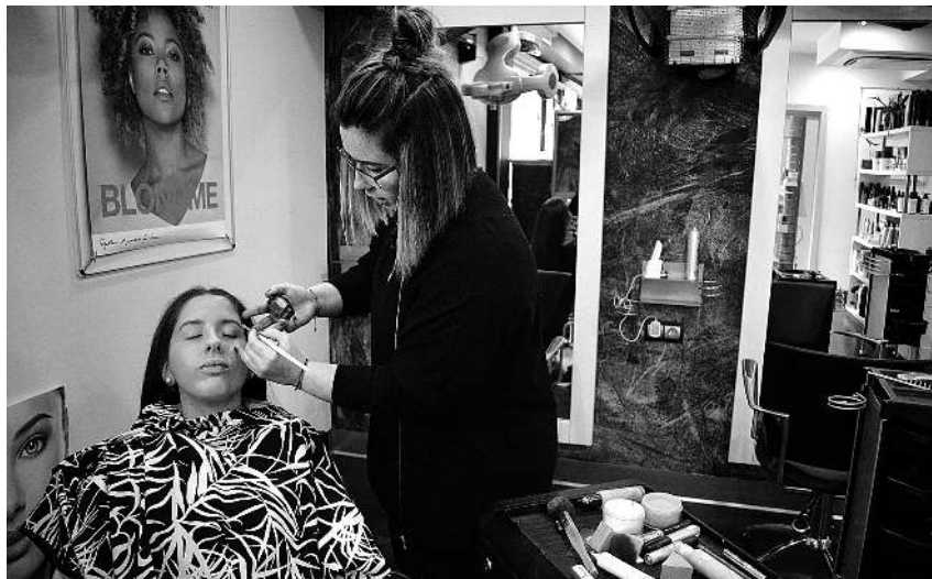
Goian, atzo gauerako afaria prestatzen Ardozaleak elkartearen. Behean, kantinerak danborradarako prestatzen Adats ile apaindegian. IHINTZA ELUSTONDO