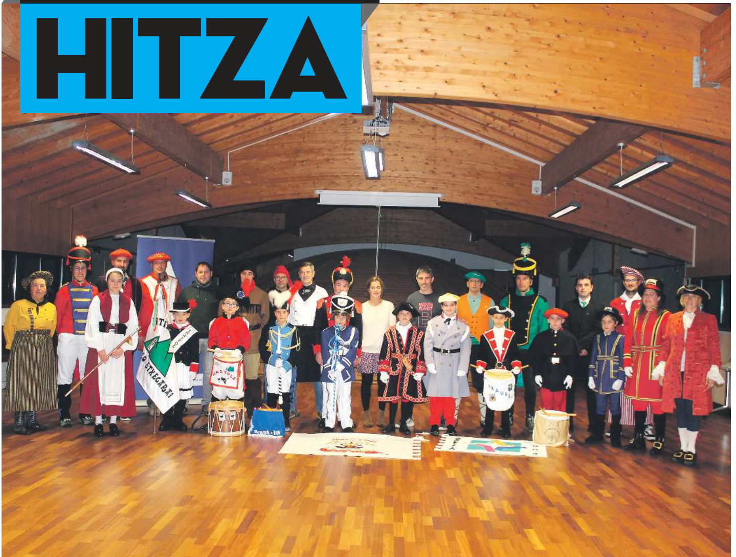
Aurtengo sansebastianen aurkezpena, joan den astelehenean Azpeitiko udaletxean. AITZIBER ARZALLUS