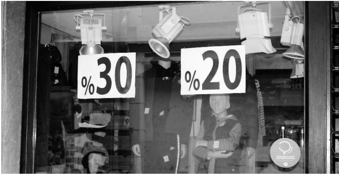
Urtarrilaren hasieratik merkealdietako kartelak ikus daitezke dendetako erakusleihoetan. AITZIBER ARZALLUS

Gabonetako kanpainak eta merkealdi sasoiak «egoera zaila» bizitzen ari den merkataritza txikiari bultzada eman dio; hala, herritarrak herrian bertan erostera animatu dituzte dendariak.