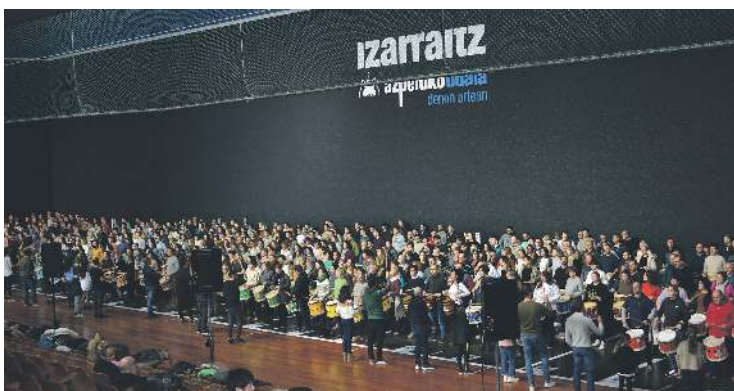
Joan den astean hasi ziren helduak danborradarako entsezetan, eta aste honetan ere bi saio egin dituzte. JULIENE FRANTZESINA

Helduen danborradako berrikuntza nagusia kanta berria izango da: Pantxoa eta Peioren Batasuna . San Sebastian bezperako danborradan ziren San Sebastian eguneko banderaren jaitserakoan joko dute; hain zuzen