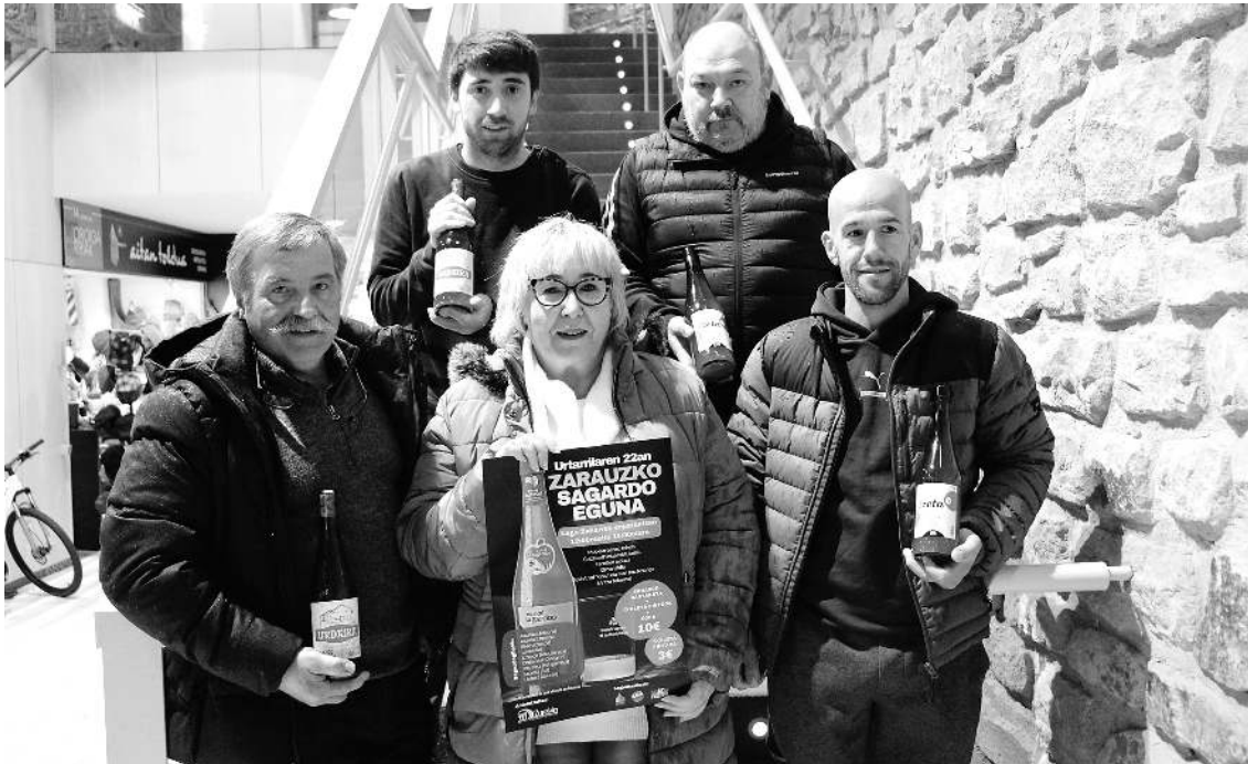
Zurekin elkarteak kideak eta Urdaira eta Izeta sagardotegietako arduradunak Sagardo Egunaren aurkezpenean, Merkatu Plazan. J.G.T.