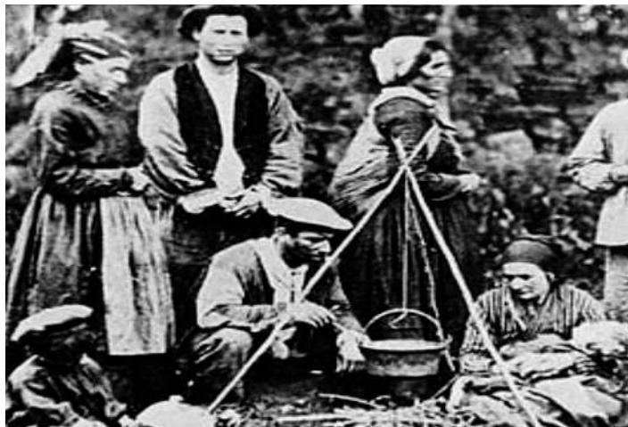
«Argazki horrek ditu kulpa guztiak, irudi horrek ekarri dit [...] oroitzapen zaharra...».

E uskaraz esanahi zabalekoa da min hitza: oinazea adierazten du, alde batetik, gorputzean jartzen zaigun sentipen nekagarri hori, eta, beste batetik, adjektibo gisa ere erabiltzen dugu jakiek ahoan sortzen duten halako sentsazio bero edo erredurazkoa adierazteko. Egia da azken aldian jendeak pikante deitzeo ohitura txarra hartu duela, baina minak dira (eta ez pikanteak) era horretako jakiak, pipermina adibide. Kontuak bihurriagoak egiten dira «min» hori hitzaren amaierakoa edota beste hitz bati lotuta datorrenean: samina da atsekabea edo mina sortzen duena, sumina haserre errazekoa edo haserre bizikoa dena, karmina garratza dena. Nostalgia edo urrutitasunak sortutako goibeltasunari lotuak dira, bestalde, oroimina eta herrimina; eta indar bereziko loturak adierazten dituzte adiskide min edo lagun min bikoteek. Azkenik, zerbait jakiteko gogo biziazi itsatsita dator jakin-min hitza.