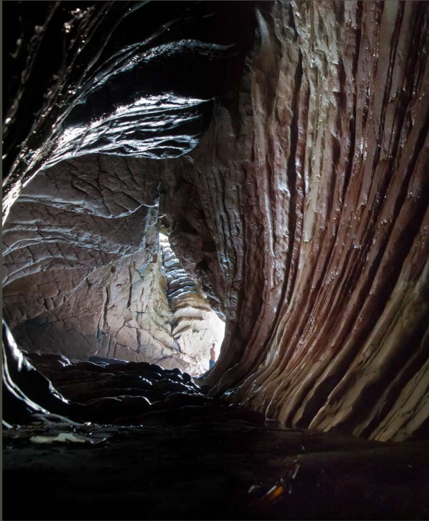
argazkia eta testua Gorka Zabaleta