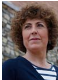
Edurne Egaña EAJ-PNV