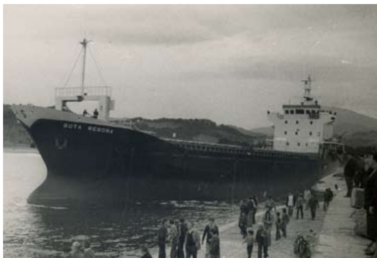
▲ LAU IRUDI Gabarra baten botadura moilan; Balenciagaren aireko ikuspegi bat; arrantzontziak konpontzen; eta Sota Begoñaren itsasoratzea.