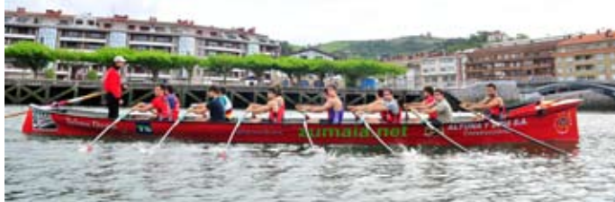
Arraunketa mota desberdina sartu du Zabaletak: arraunkada luzeen ordez, motzak egiten dituzte orain.

AE: Debalde etortzeko jarri diguten baldintza bakarra da garantiatzeko entrenatzailea nahi zutela, baita sendagilea ere. Zerbait berria nahi zuten.