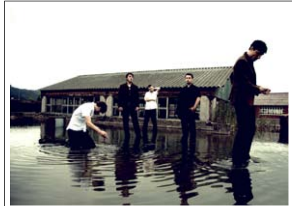
Ekainak 10, ostirala, Aita Mari aretoan, kontzertua.

"Artadira iogoera" txirindulari proba, 11:00etan 16 urte baino gazteagoak