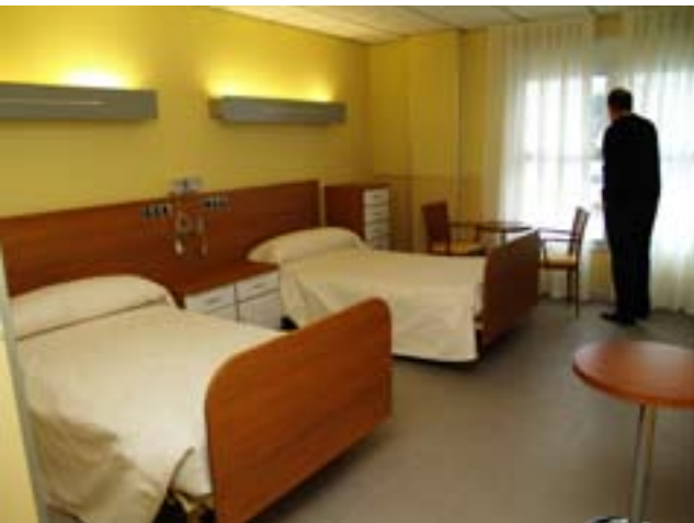
Bikoteentzako gelak ere badaude, behar izanez gero.