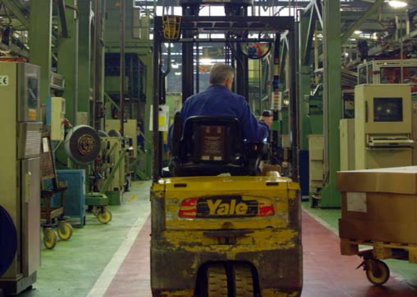
299 langilek egiten dute lan gaur egun Ayra Durexen.

erregulazioa edo kaleratzea. Bigarren aukerak arrisku handiak ditu eta dramatikoagoa da. Horregatik saiatzten ari gara, ahal dugun neurrian, inor ez kaleratzen. Baina ulertu behar dugu ezin dugula egoera honetan luzaro jarraitu.