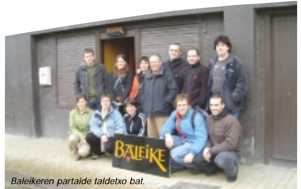
Baleikereren partaide taldeko bat.

2000. urteko irailean askatasuna eta malgutasuna irabazi zuen aldizkariak gaur egun duen lokalera igaroz. Hilabetekari izatetik, hamabostekari izatera igaro zen eta lantaldea ere aldatu zen. 100. zenbakira iristearekin agur esateko unea iritsi zen. Pare bat hilabetera, ordea, berriz agertu zen, formatu txikiarekin eta lantalde berriarekin. Ordutik beste 50 zenbaki ere egin ditugu eta orain 150. zenbakia duzu esku artean.