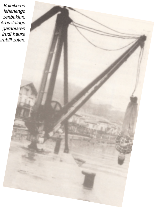
Baleikereren lehenengo zenbakian, Arbustaingo garbiaren irudi hauxe erabili zuten.