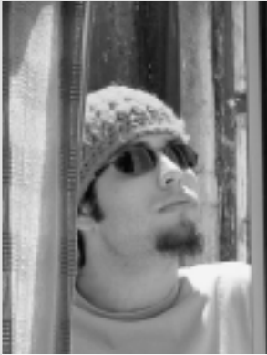
x a 2

150 zenbaki egin, eta ez da mementorik egokiena amorrazioaz hitz egiteko. Agian ez. Baina, akaso bai. Izan ere, 12 urte igaro dira orduz geroztik, eta zipriztin batzuk kenduta, egoera beretsuan gaude. Eta horrek amorrarazi egiten nau. Orduan gaztetxoan nintzen, 12 urterekin oraindik bibote ile ziztrin batzuk