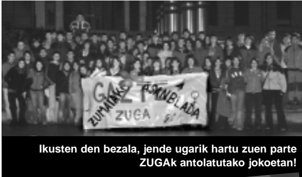
Ikusten den bezala, jende ugari hartu zuen parte ZUGAk antolatutako jokoetan!