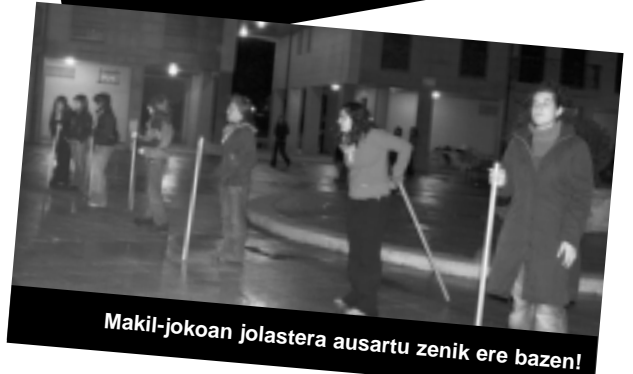
Makil-jokoan jolastera ausartu zenik ere bazen!