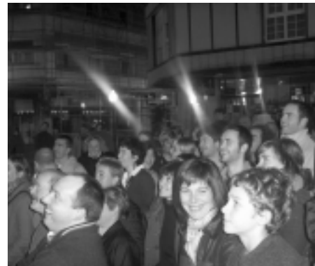
Jendeak ederki pasatu zuen bertsoak entzunez.