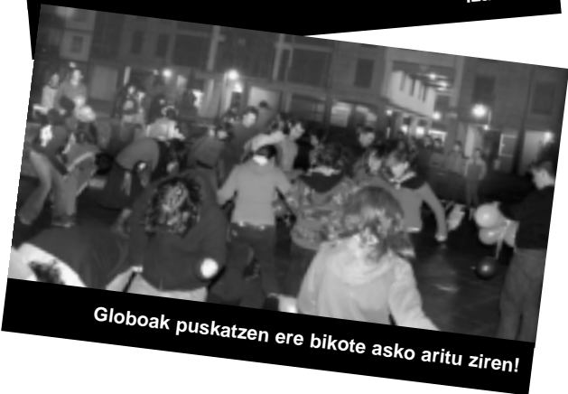
Globoak puskatzen ere bikote asko aritu ziren!