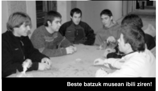
Beste batzuk musean ibili ziren!