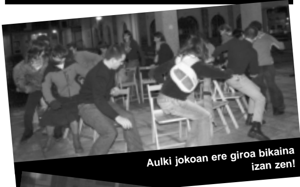
Aulki jokoan ere giroa bikaina izan zen!