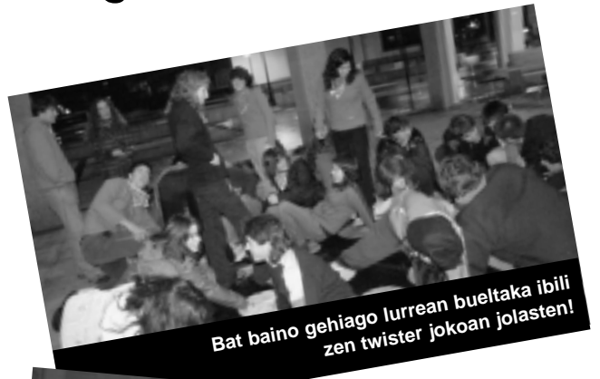
Bat baino gehiago lurrean bueltaka ibili zen twister jokoan jolasten!