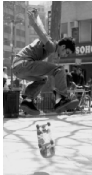
Abenduaren 27an Alondegian Gaztetxolak antolatuta, skate munduari buruzko bideo emanaldiak izango dira.