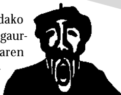
Zumaiako Bertso Eskola