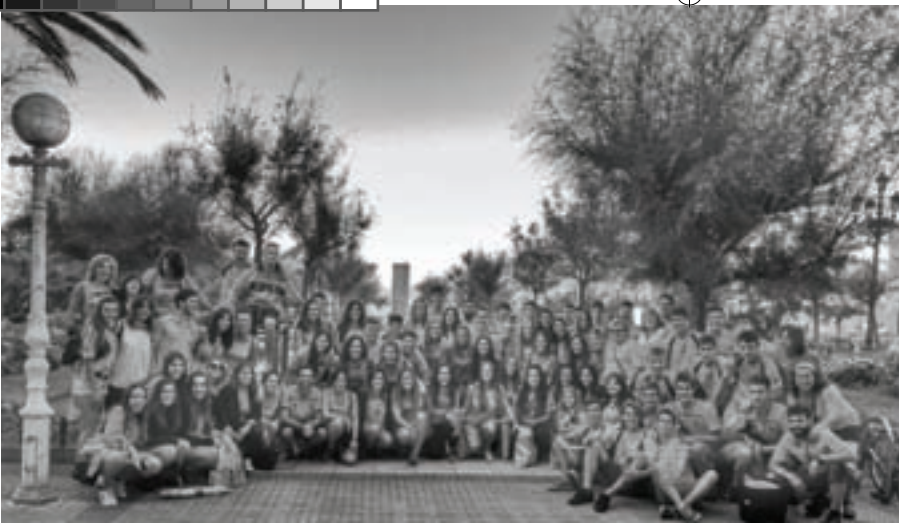
Denak horiz jantzita. Zer esan behar dute Arrimadasek eta Riverak?