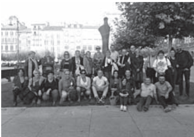
Oriotarrak Iruñean, Altzuzako Oteiza Museoa bisitatu ostean. KARKARA

“Oteizaren figura herritarron artean zabaltzea zen asmoa eta, neurri batean, lortu dugula esatera ausartzen gara.”