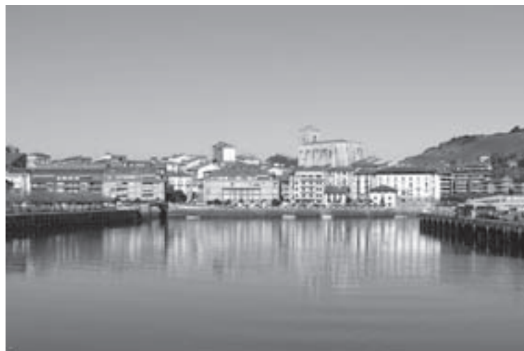
Zumaiaiko herrigunea. IHINTZA ELUSTONDO/UROLA KOSTAKO HITZA

Arraun kontuei ezin, diot egin uko, Zumaian ni neu bainaiz, Cabeza de Turco , oriotar seilua, iritsi orduko, inork nire lekua, ez luke hartuko.