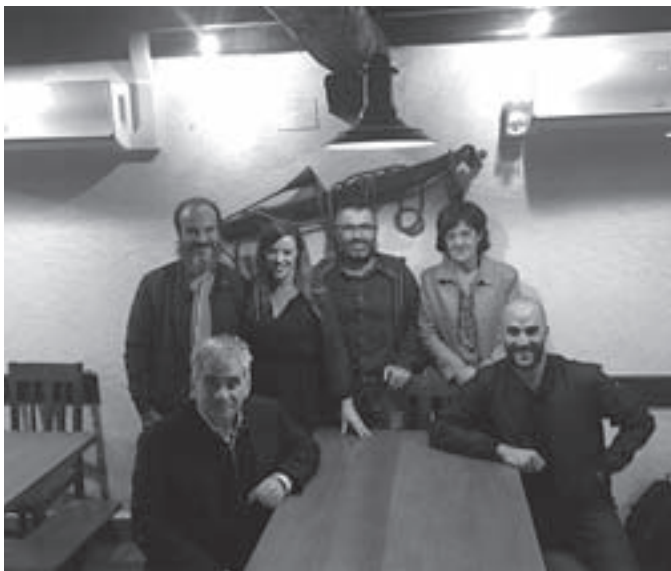
Atxaga, Alegria, Garikano eta Karkarako kide batzuk. KARKARA