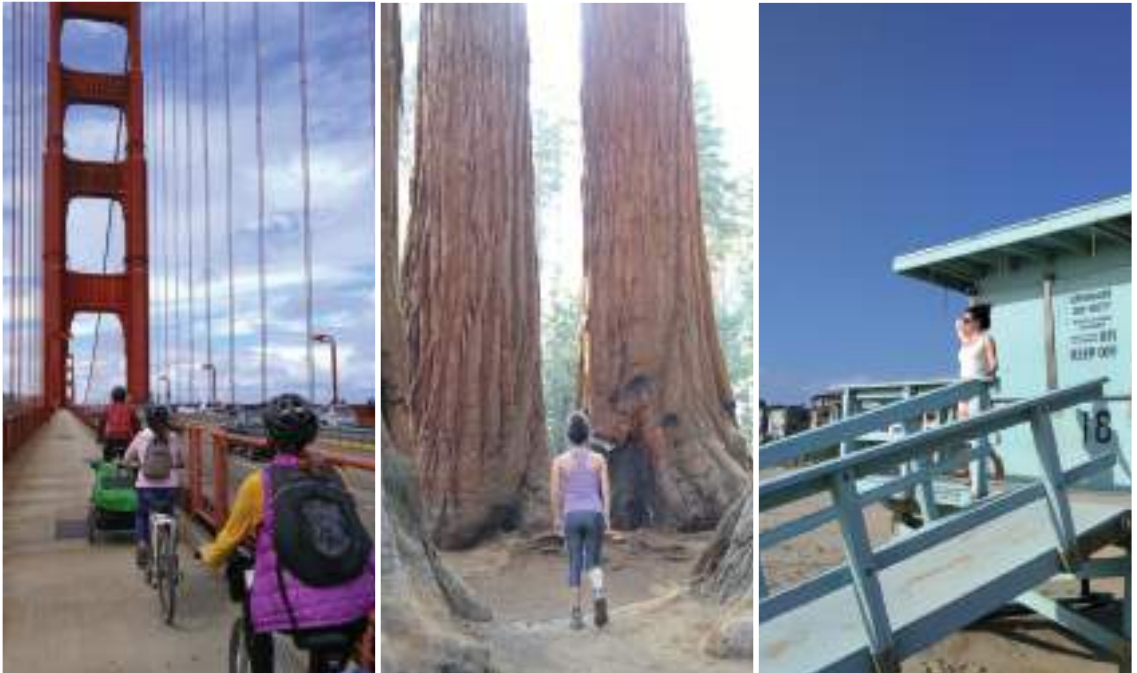
Kalifornian postdoktoradutza ikasten ari zela egindako bidaietako irudiak.

gazteak, pasioaren alde. Lotura hori egitea oso arriskutsua da, eta pena ematen dit pasioa gatazkarekin lotzeko joera horrek; izan ere, pasioa oso gauza polita da berez.