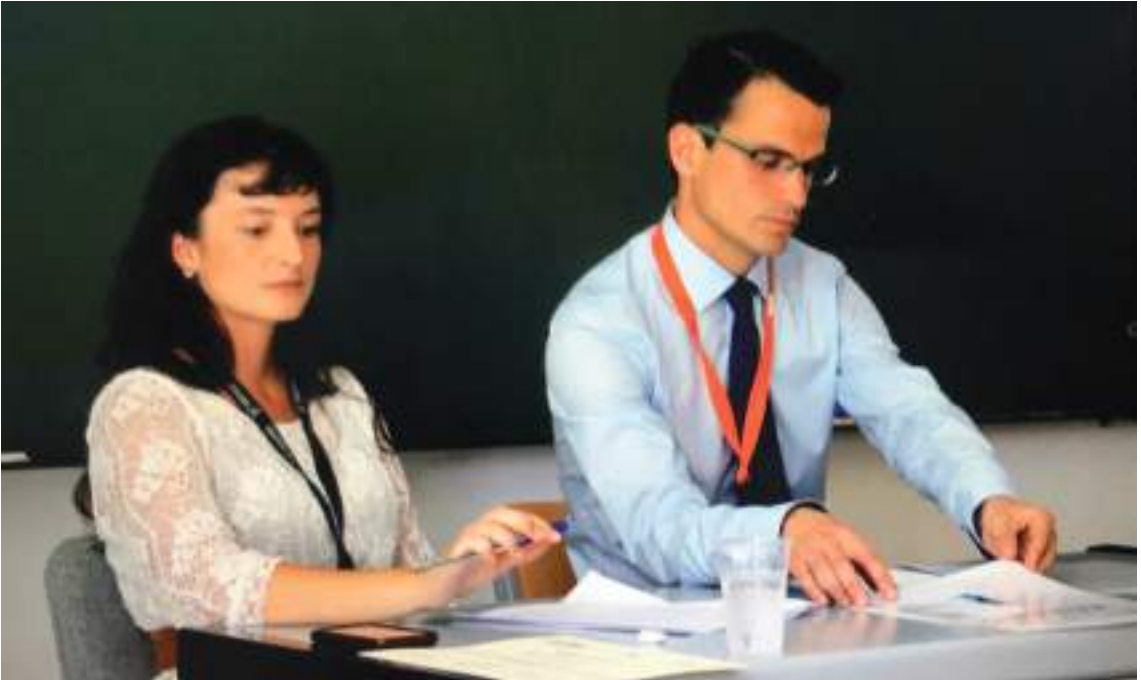
Doktorego tesiaren azken urtean, 2013an, European Conference on Psychological Assessmenteko ponente funtzioan.

batzuekin ere izan dezaketela zerikusia seinale horiek, baina asko ezagutzen dugun pertsona bat asko aldatzen ari dela nabaritzen badugu, seinaleei arreta berezia jarri behar zaie.