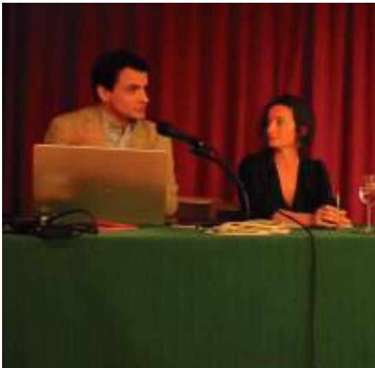
EHUK antolatutako Udako Ikastaroetan, iaz.

da Espainian, eta alderdi kliniko eta ikertzailetik oso interesgarria da hori niretzat.