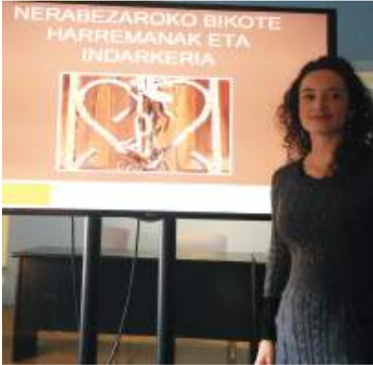
Eusko Jaurlaritzak antolatutako ikastaro batean, Donostian.