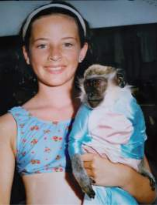
Benidormen oporretan, 8-9 urterekin.

"NERABEAK SENTIKORRAK DIRA ALDAKETEN AURREAN, ETA ETAPA HORI GAKOA DA PREBENTZIORAKO"