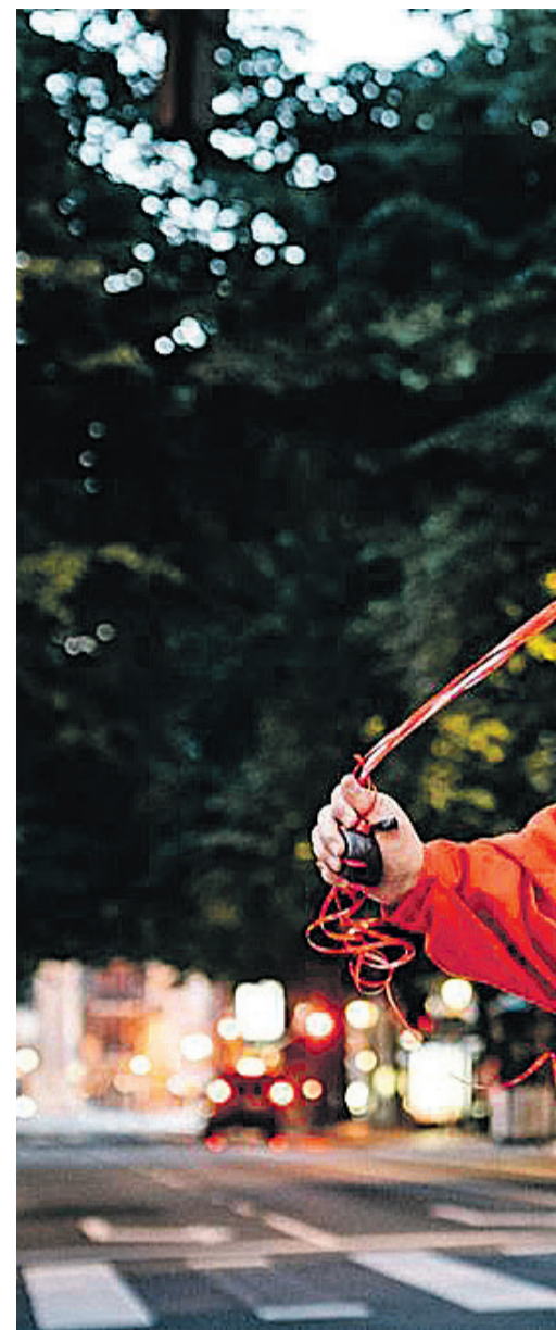
Yogurinha Borova. UTZITAKOIA