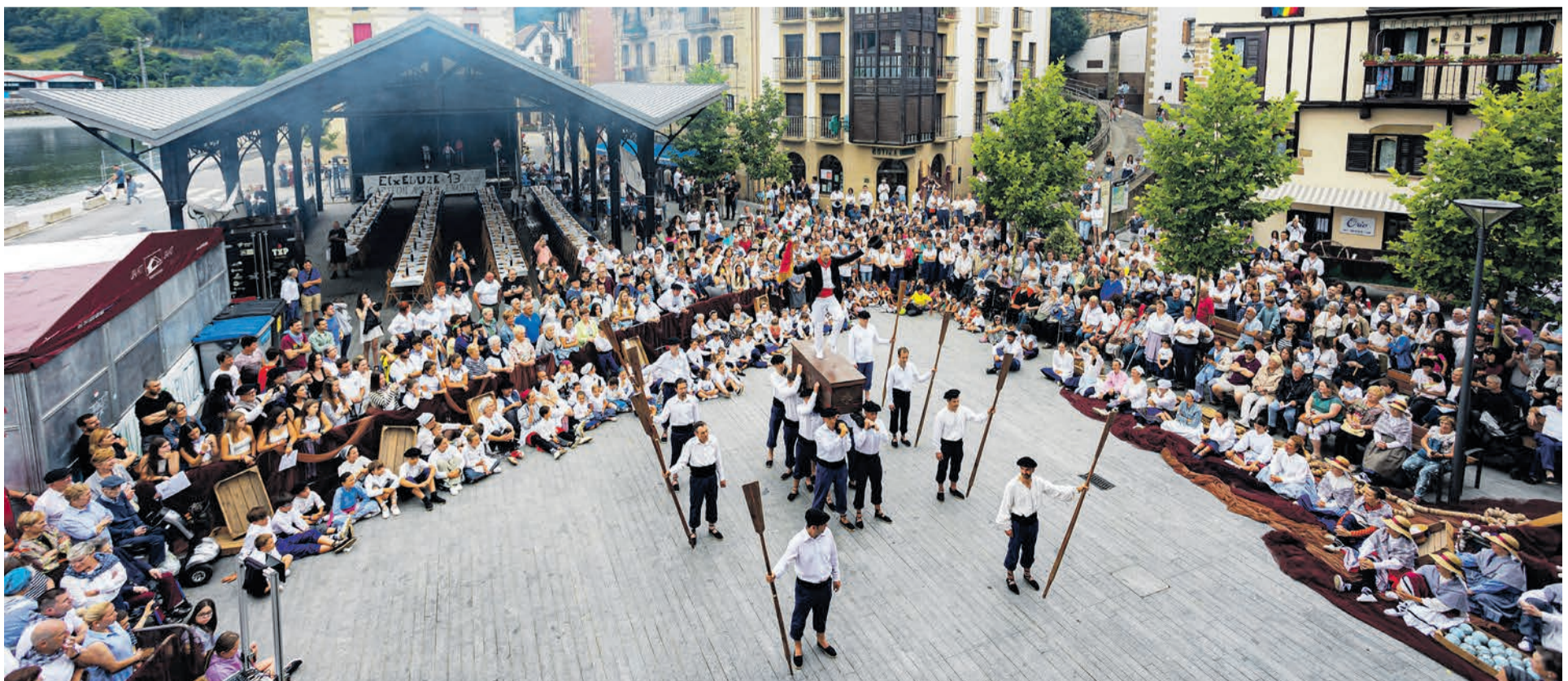
lazko Arrantzale Eguneko dantzaren irudia.