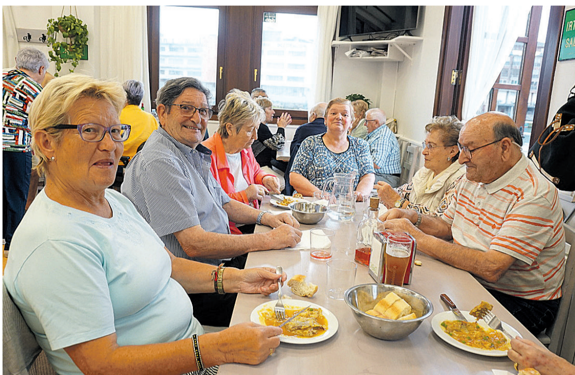
Iazko festetako jubilatuen otordu bateko irudia.