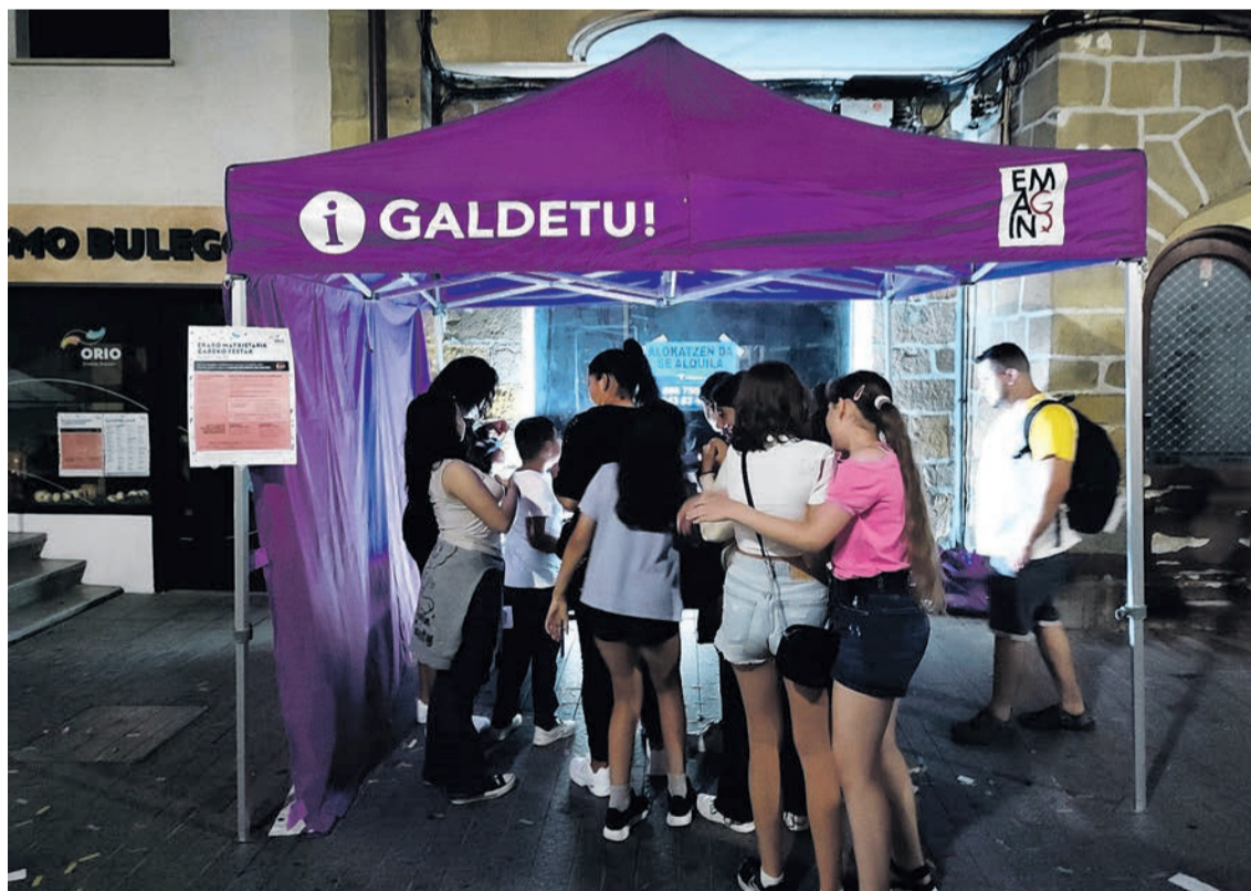
Emagin taldekoen puntu morea, artxiboko irudian.

Gune morea jarriko dute aurten berriro San Pedro festetan. Ekainaren 28an eta 29an ezarriko dute karpa, eta 01:00ak arte izango dela aurreikusten dute arduradunek. Zerbitzua Emagin elkarteak eskainiko du, eta herritarrek bertan aurkitu ahal izango dutenaren inguruan hitz egin du Orio Gukak Emagineko kideekin.