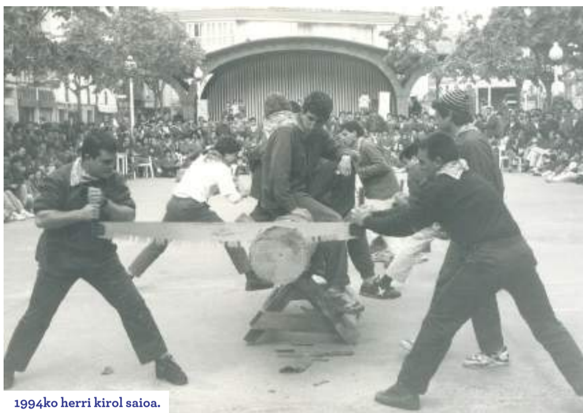
1994ko herri kirol saioa.