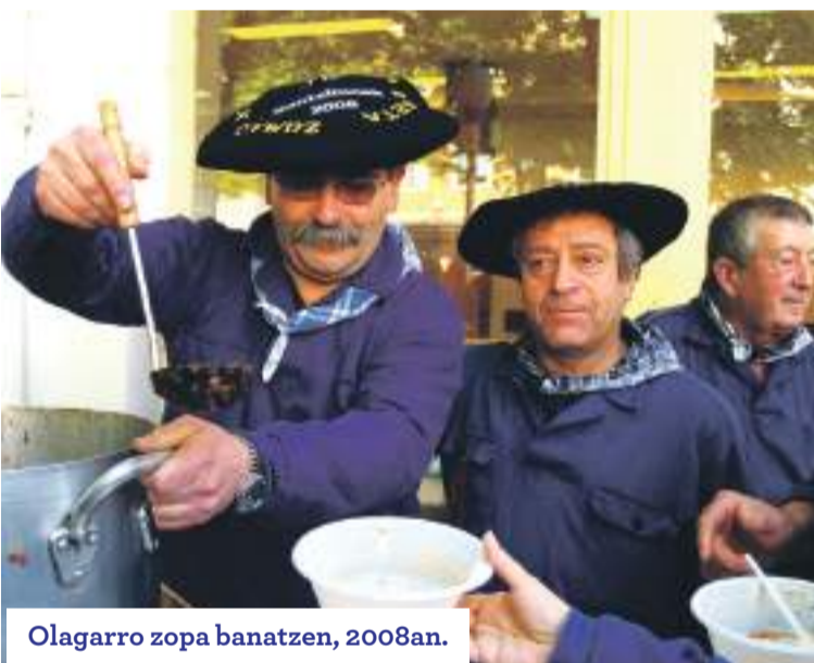
Olagarro zopa banatzen, 2008an.