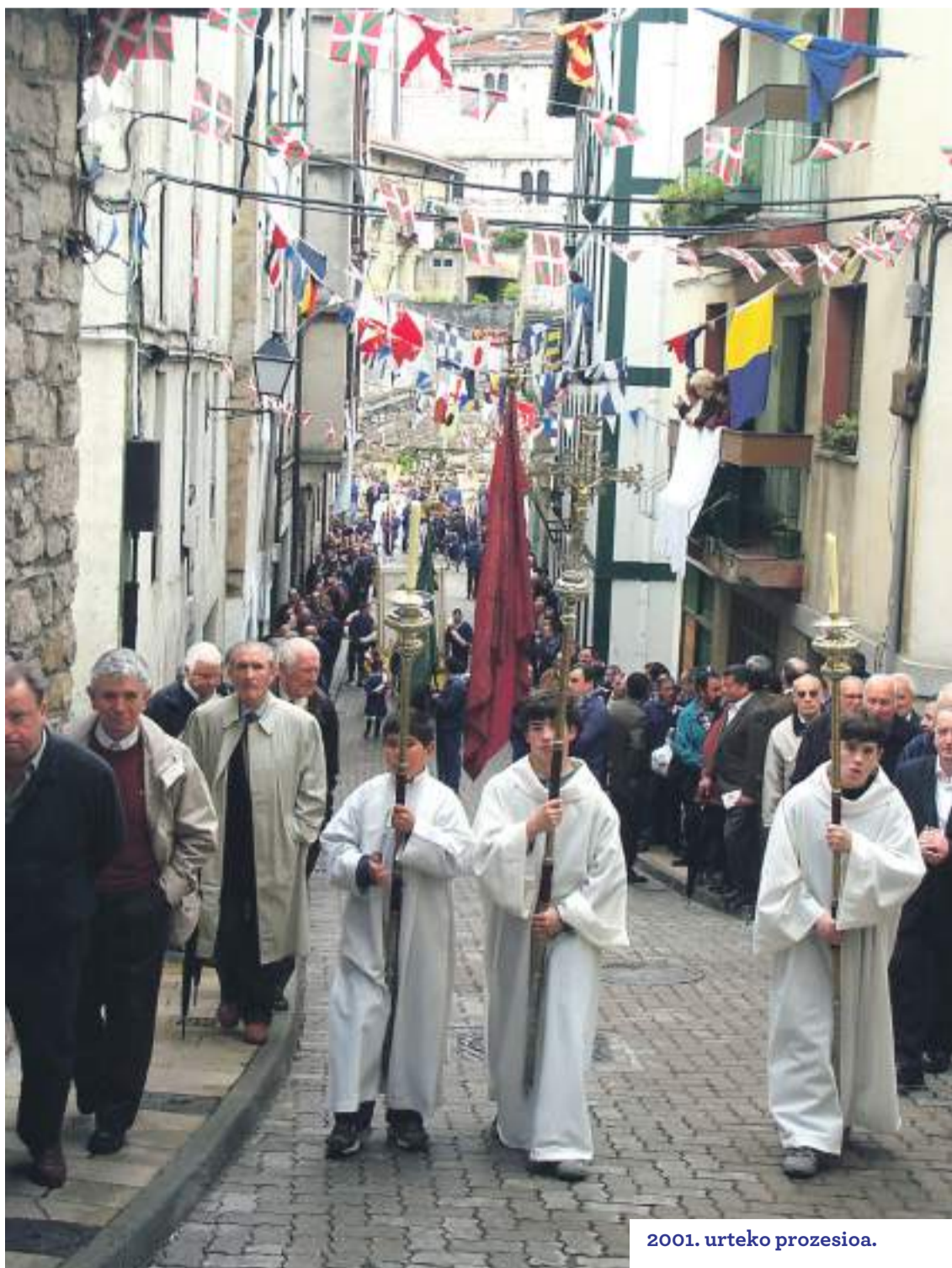
2001. urteko prozesioa.

Festen antolaketan egindako aldaketek eta hobekuntzek herritarren parte hartzea handitzea ekarri dute, gaur egun zumaiarrak izanik San Telmo jaien oinarria. Santelmoen historian gauzatutako ekitaldiek, berriaz, milaka irudi eta oroitzapen utzi dituzte, eta Baleike Gukak horietako batzuk bildu ditu, herritarren oroimena astintzeko asmoarekin.