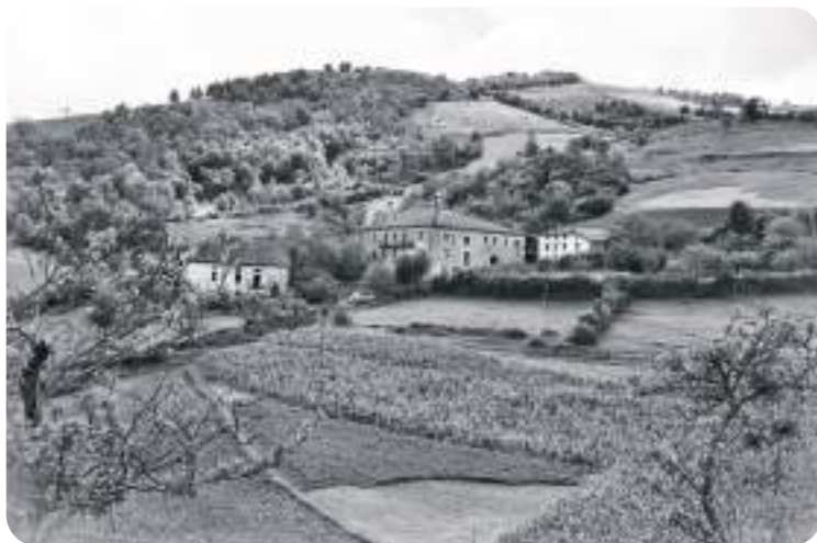
Martirieta auzoaren antzinako irudi bat.

batzuk: harrike bota , merkexurrin ibili , ostixena jo , karriau , laptrax ein eta andarikun ibili .