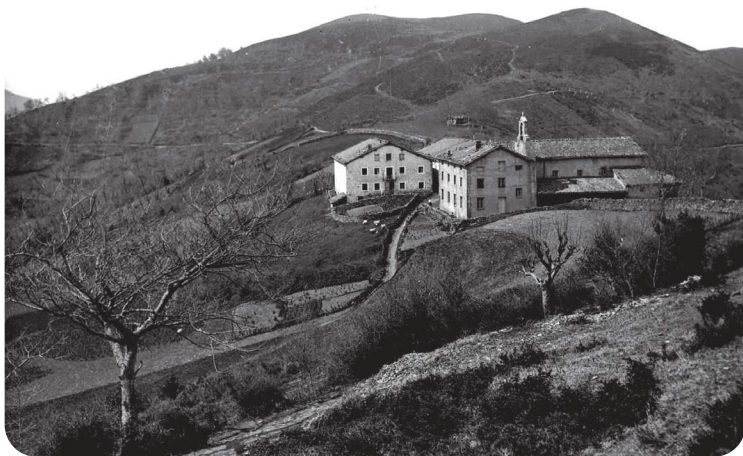
Marixa auzoaren argazki zahar bat.

neur daiteke, kasu bakoitzean ematen diren bereizgarriak kontuan hartuta. Esate baterako, zarata adierazteko, burrundaie , danbaie , kurruxkaie , ardaxe eta abar erabiltzen dira. Kantitatea adierazteko berriz, galanki , mordue , lepo eta pillue erabil daitezke, besteak beste.