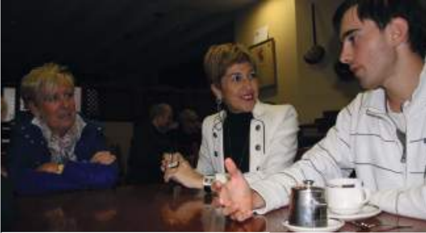
Aldalur, erdian, ingeles eta frantses kafe tertulietan.