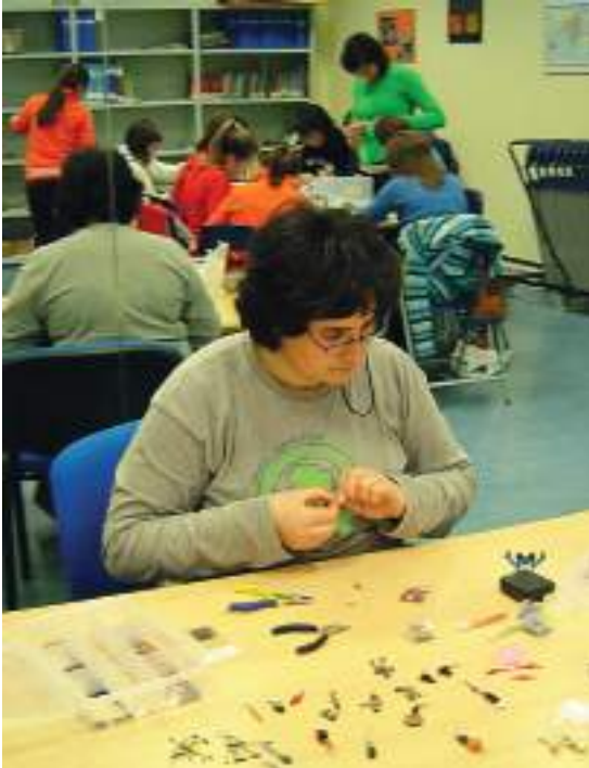
Sudupe hainbat gazterekin tailer batean, 2004an.

"TALDE BAT DUT ALBOAN, ETA SEKULAKO SOSTENGUA EMATEN DIO PROIEKTUARI"