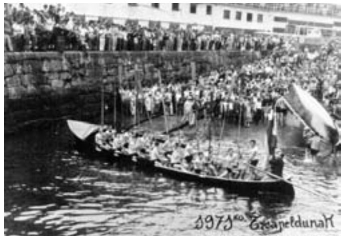
Ikazetak 1963an egindako trainerua, Oriok dohaintzan emana UMri.

patutako balearen jatorrizko argazkia ere.