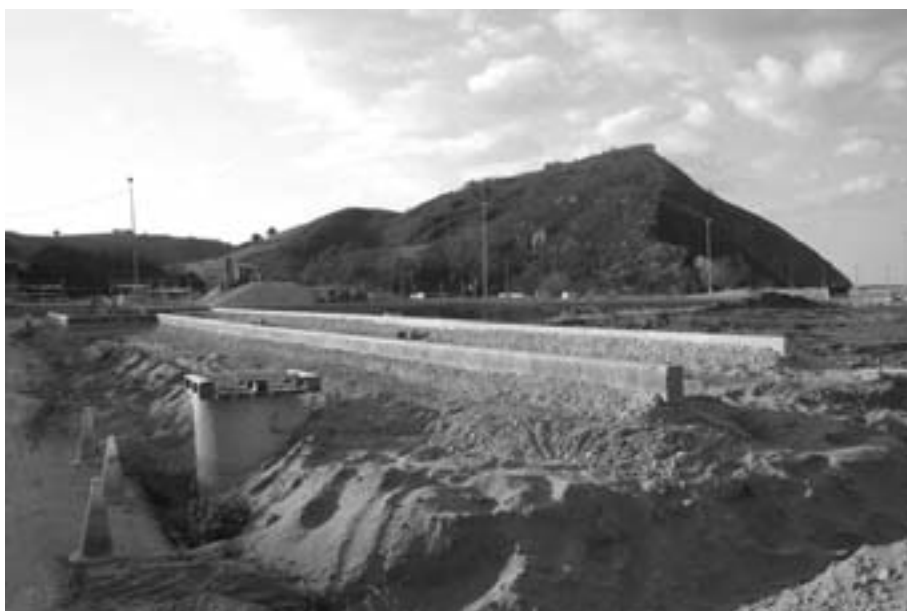
2004an hasi ziren Antilla eremua berritzeko lanak. KARKARA