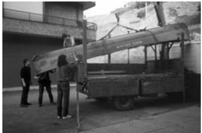
“Maria Rosario” arrantza-batela, Lorenzo Lizasok egin 1946an.

Todos los Santos fragata, 1803an Orion eraikitako ontziaren planoak ere jasoa du Museoak; baita 1901ean Orion harra-