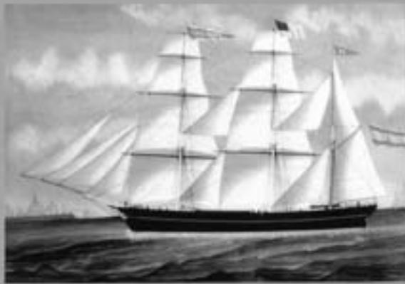
Oria ibaiko untziak liburuaren azala. UNTZI MUSEOA, 1994