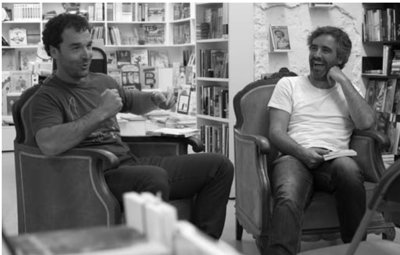
Gaztañazpi eta Urdinaga, Zarauzko Literaturia jardunaldietan. KARKARA

“Orio dezente agertzen da liburuan, bai, eta uste dut oriotarrek irakurketa hurbilagoa egin dezaketela”