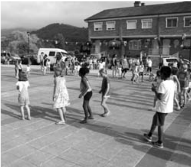
Giro eguzkitsuarekin ospatu zituzten Anibarko Portuko jaiak.