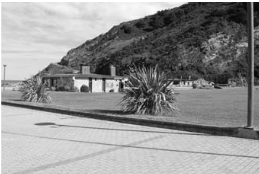
2007an amaiu ziren lan gehienak. KARKARA

Antilla hondartza da Orioko hondartza nagusia; Ori ibaiaren bokalearen eta Kukuarri mendiaren artean dago. 3500 m 2 inguruko azalera du, 220 metro luze eta 90 metro zabal ditu batzaz beste.