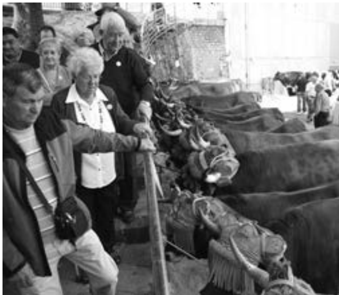
Giro ederra izan zen Asentzio ferian. KARKARA