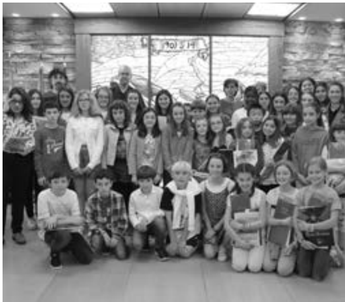
Literatur lehiaketako sari banaketa. KARKARA