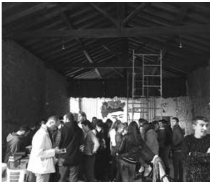
Minutu gutxitan bukatu ziren Berri Txarraren kontzertuko sarrerak