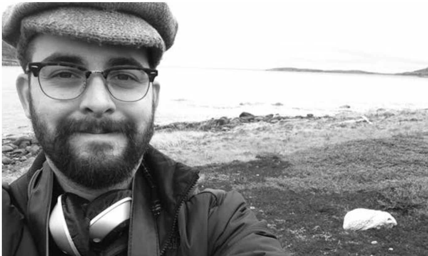
Hartery Red Bayn. Atzean, Saddle Island eta balea hezur bat. A. HARTERY

“Geruzak bereizi eta bakoitzari instrumentu egokia jarrita balea kantuak modu eraginkorrean erreproduzitu daitezke.”