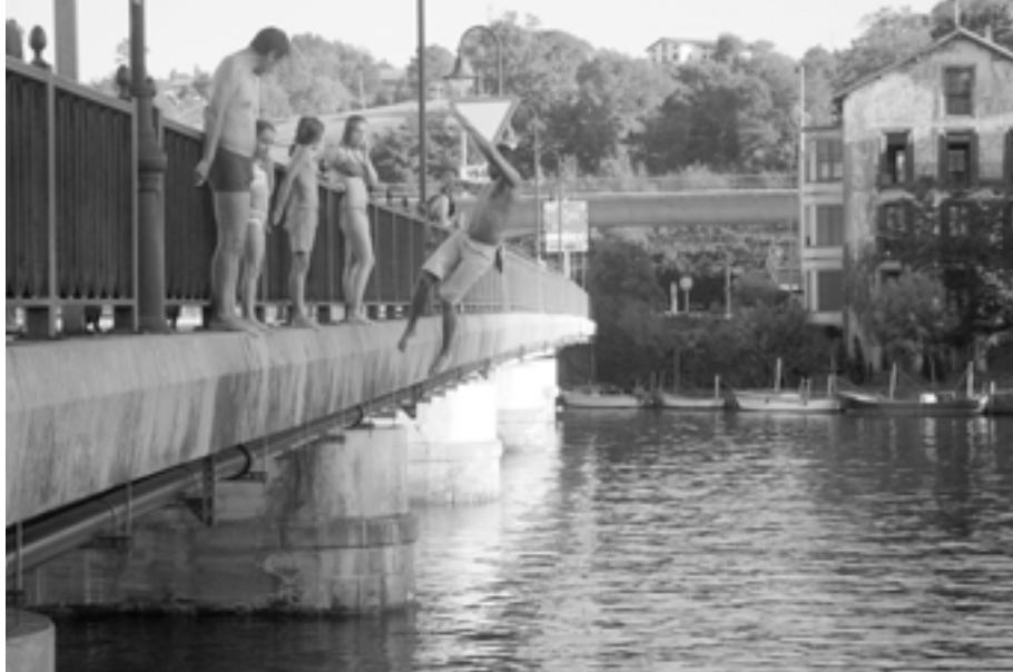
Orain txiki-txikitatik ikasten dute igeri egiten neska-mutilek. KARKARA