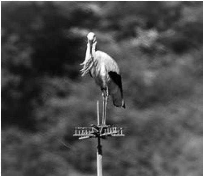
Aste santu amaieran zikoina agertu zen Orion.

“Jendea ibili bai, ibili zen hondartza aldean, baina herriko tabernetan dantzarako nahikoa giro epela izan omen zuten.”