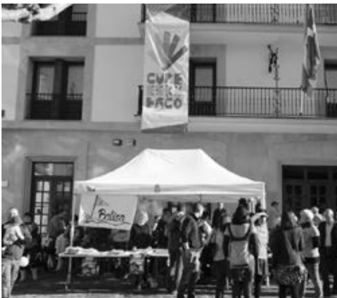
Maiatzaren 7an herri galdeketa egingo da Orion. KARKARA

Kanpandorrean ostatu hartu duen zikoinak maiatza gerturatu digu herrira mokotik zintzilik, eta urteko bosgarren hilak Herri Galdeketa dakar altzoan. Nahi al duzu euskal estatu burujabe bateko herritarra izan? ala ez izan. That's the question. Atal berezia sortu dugu Karkara.com atarian galdeketa inguruko informazio guztia jasotzeko. Ea ba!