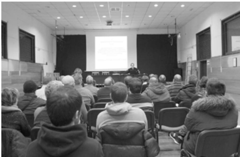
Hiri Antolamendurako Plan Orokorra prozesu parte-hartzailean landu zuen Udalak. KARKARA

Herritarren partaidetza geroz eta indar handiagoa hartzen ari da administrazio publikoan. Politika modu berriak agertzearekin batera, horiek martxan jartzerakoan parte hartzea garrantzia hartzen joan da. Horren harira lege proiektu bat egin du Eusko Jaurlaritzak: euskal sektore publikoaren garrantasuna, herri partaidetza eta gobernu oneko legea .