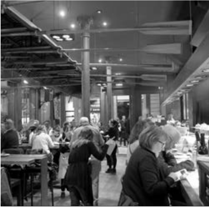
Astebarruan ere jende asko ibiltzen da Orío tabernan . AGIRRESAROBÉ