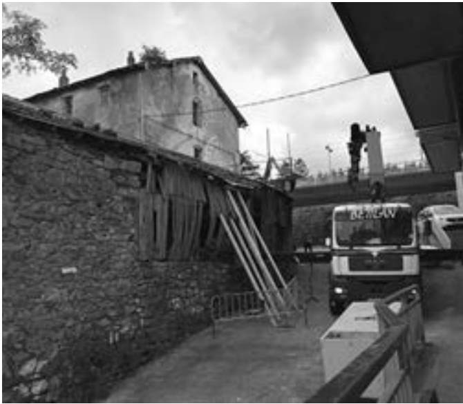
Mutiozabal ontziola berritzeko lanak hasi dira. ORIOKO UDALA