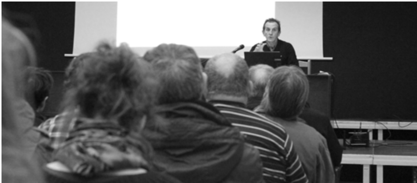
Plan Orokorra aurkezteko eta herritarren proposamenak jasotzeko bilera irekiak egin ziren 2015 hasieran. KARKARA

Orio 2030ean nolakoa izango den galderari erantzutea da Hiri Antolamenduko Plan Orokorren helburua.