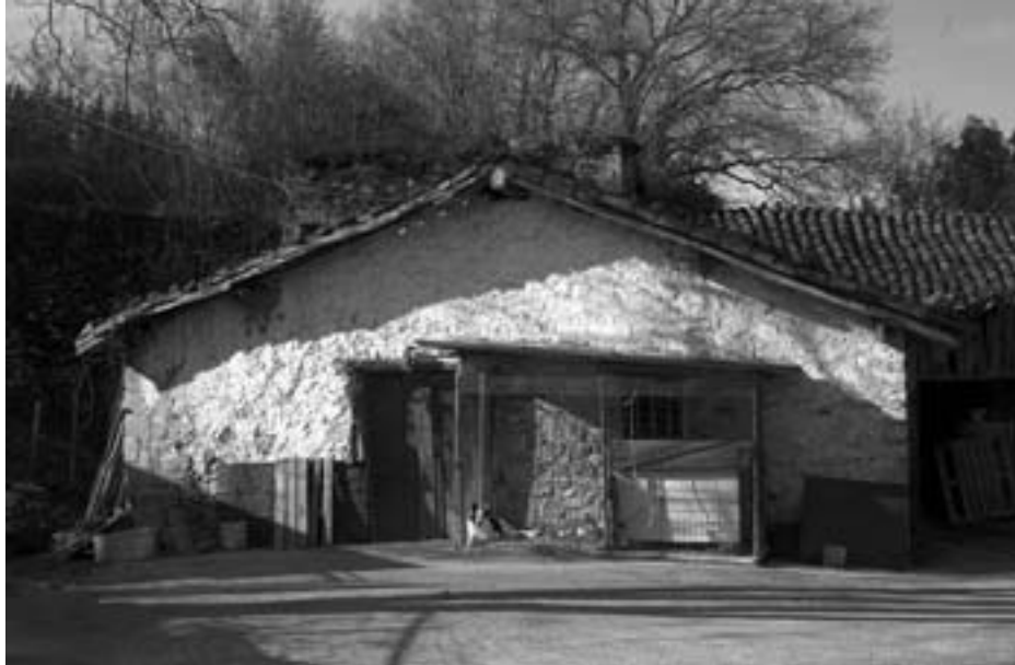
Argazkiko eraikinaren barruan zegoen errota, duela 50 urterarte eduki zuten martxan. KARKARA