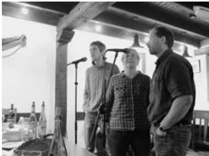
Herriarteko Bertsolari Txapelketako saioa Gure Etxean. ERRIKOTXIA