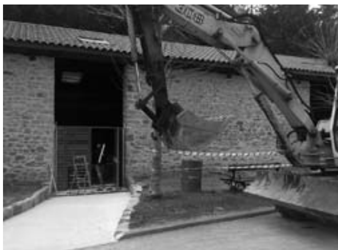
Etxeluze gaztetxeko obrak. ETXELUZE