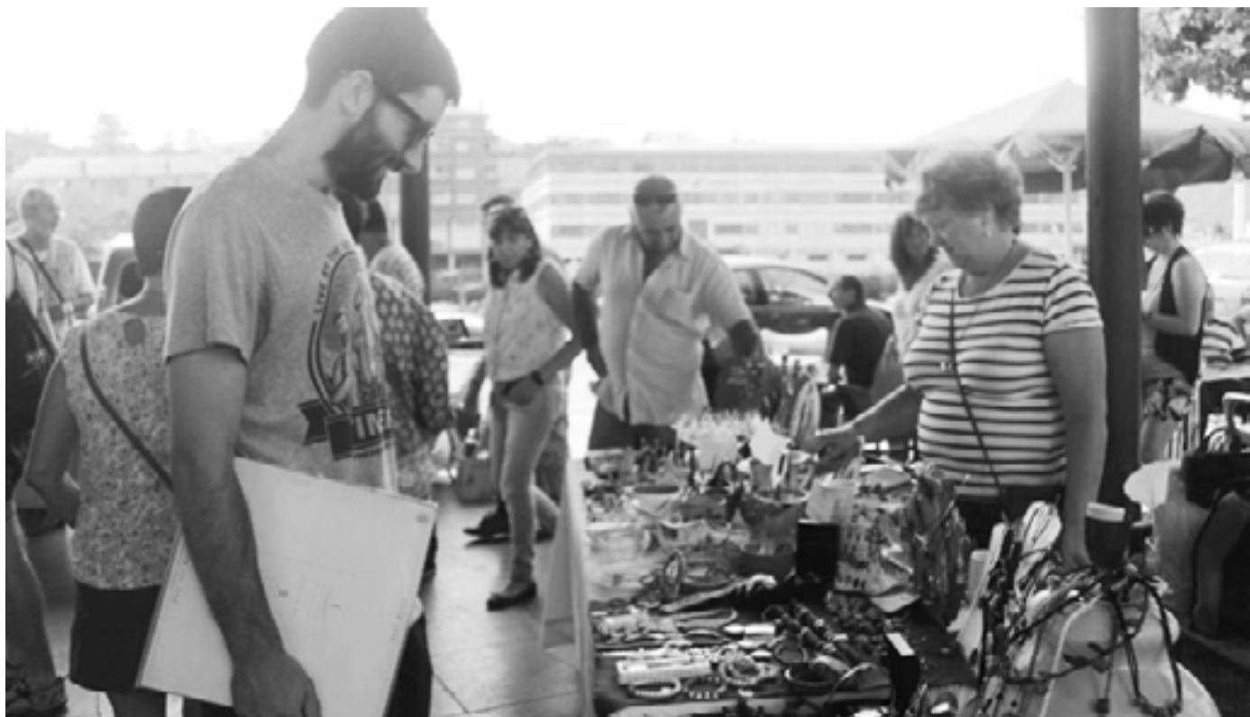
Bigarren eskuko azoka herriko plazan. KARKARA

Krisiak pertsonalak, politikoak, ingurumenekoak edo ekonomikoak izan daitezke. Azken horretan egingo dugu azpimarra hil honetako Udalaren Txokoan, azken urteetan horrek hartu baitu presentziarik handiena gizartean.