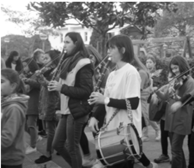
Santa Zezilia egunean herriko musikariak kalera atera ziren.