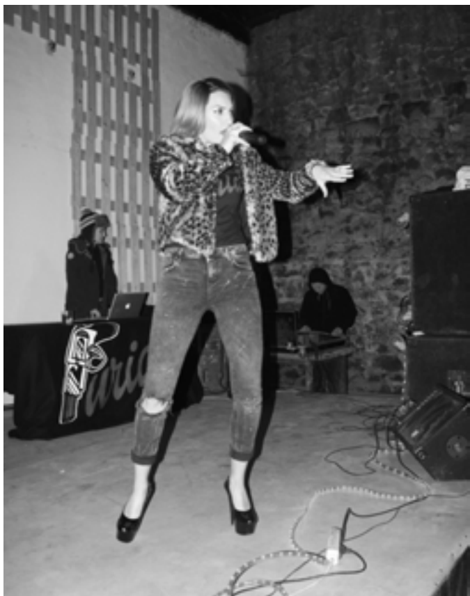
Xaltxa Badago jaialdi feministako kontzertuko irudi bat, Furia.

Jaialdi feminista, Orioko Xaltxerak antolatutako festa: sexualitate tailerra, Bertsxortan, La Furia, Vinagre de Moderna, Koxka eta Dr. Myrna.