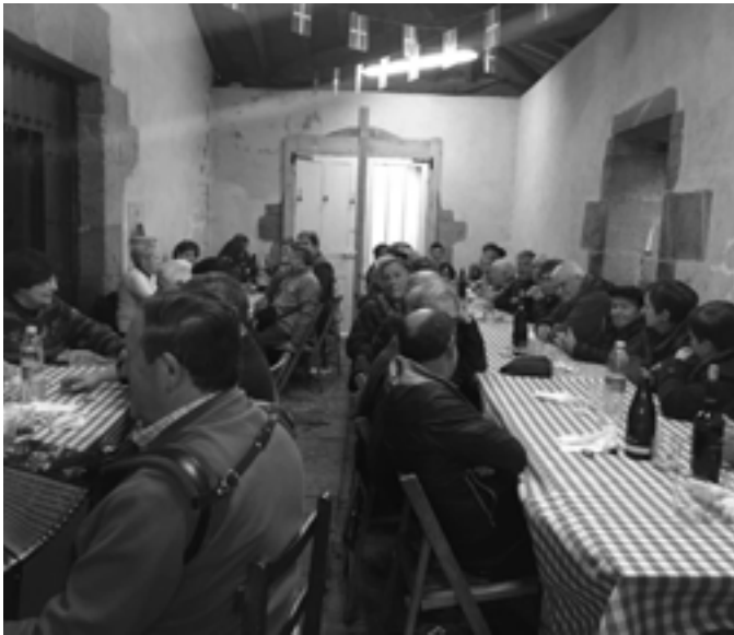
San Roman jaiak ospatu dituzte Altzolan. Erromeria izan zen.