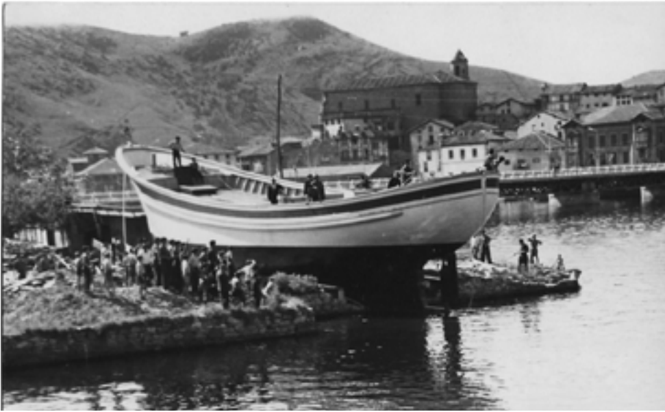
Maria Auxiliadora baporea, uretaratu zen egunean, 1961-04- 28an.