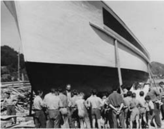
Eugenio Arbilla maisua, bere ikasleei azalpenak ematen.