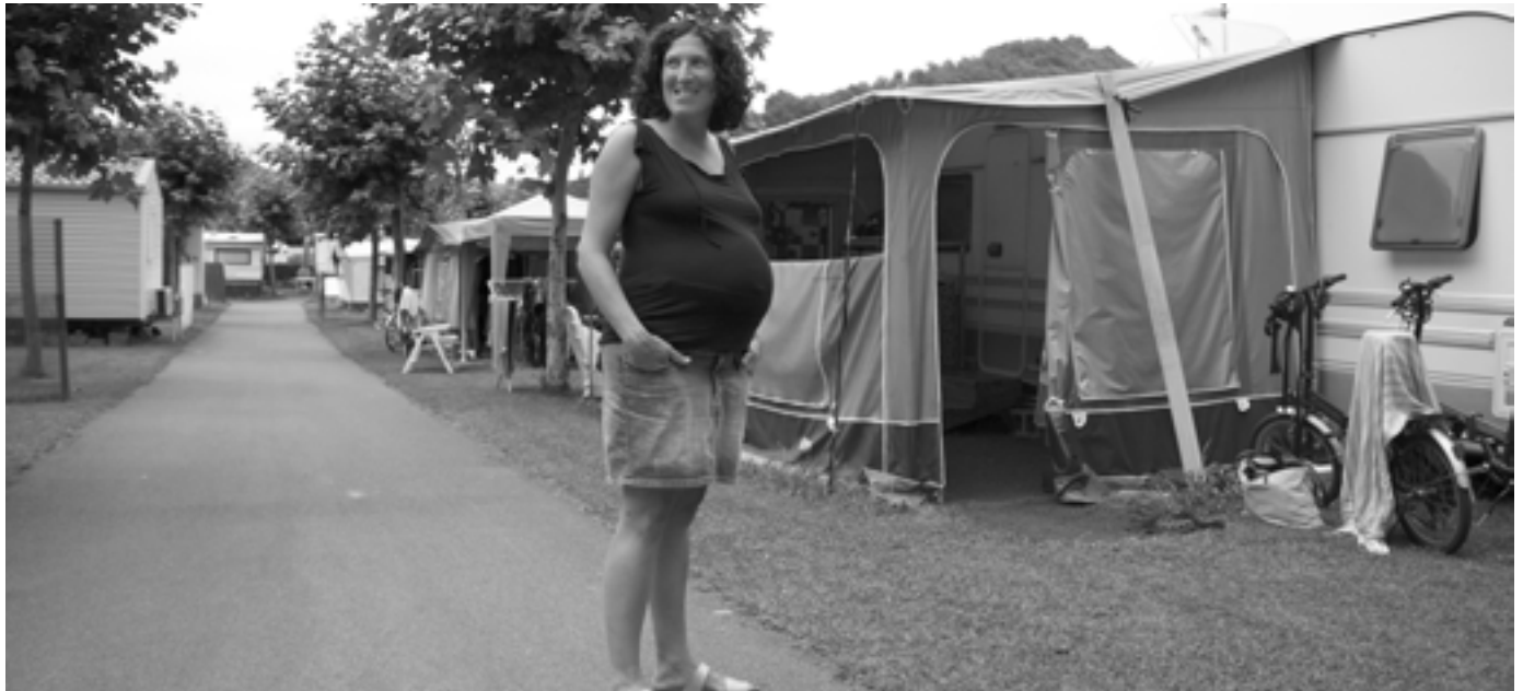
Jaio zenetik udarak Orion pasatzen ditu Loitzune Ameztik. KARKARA

tzean, badira guztiek aipatzen dituzten hainbat gauza. Lasaitasuna da horietako bat. Aspalditik ezagutzen dugu elkar heringoak –dio Goenagak– eta atea irekita utzi eta lasai joan naiteke badakidalako jende ona dagoela . Kanpinera etortzea arnasa hartzea da beretzat, etxetik gertu badago ere, deskonektatzen laguntzen dio.