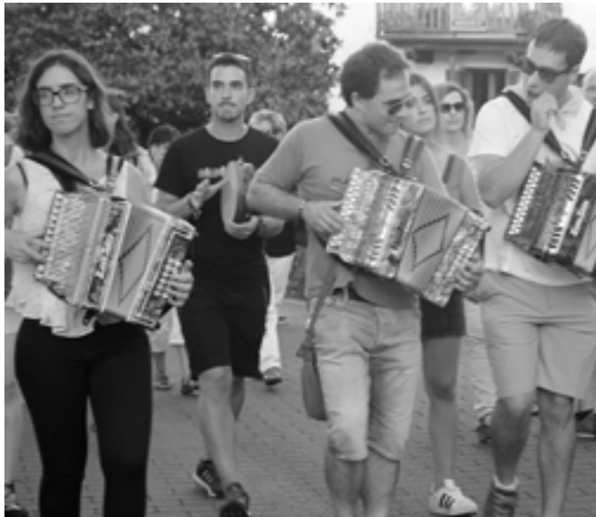
Aiako festak. KARKARA