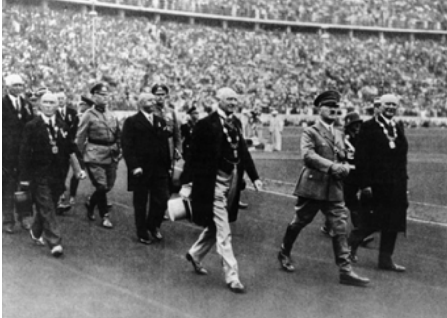
Adof Hitler, 1936ko abuztuaren 1ean, Berlingo olinpiaden inaugurazio-ekitaldian.