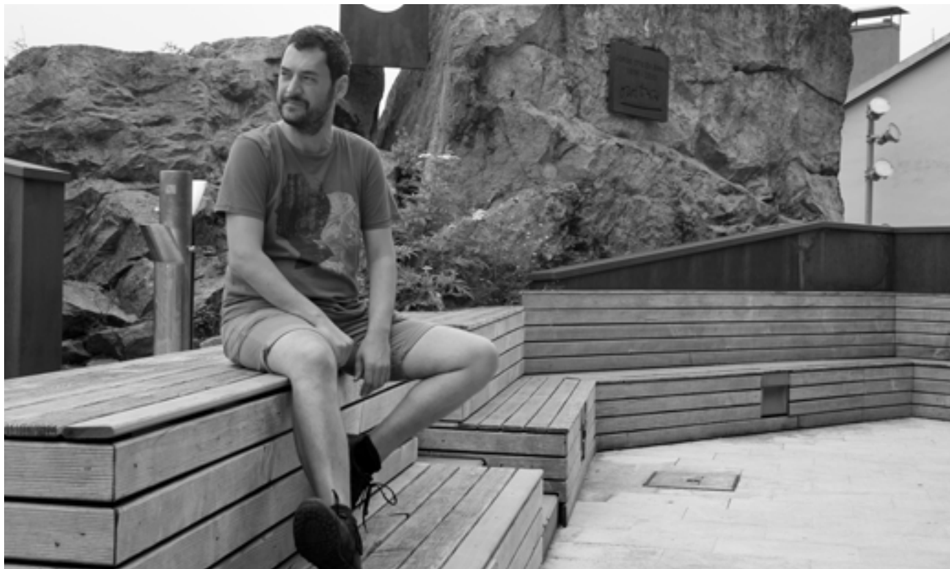
Euskaldun berria da Lozano, Bartzelonan ari da euskara ikasten. KARKARA

“Ez da gauza bera hizkuntza bat testuinguru linguistikoan bertan edo hortik kanpo ikastea. Pixka bat antinaturala da.”