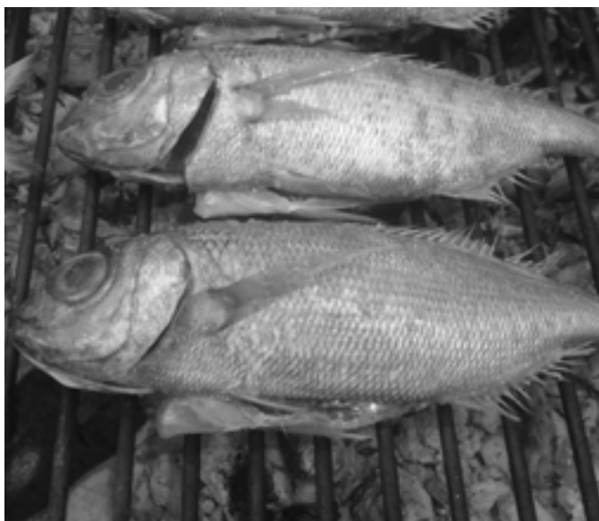
Bisiguaren eguna. KARKARA