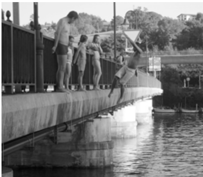
Moilan bainatzen. KARKARA