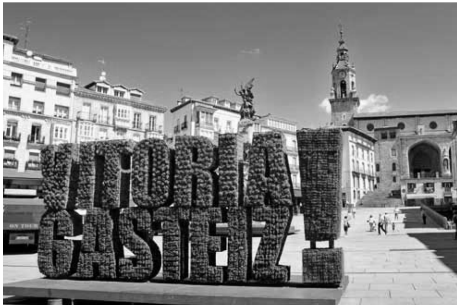
Gasteizko Andre Maria Zuriaren plaza.

KARKARAK ez du bere gain hartzen aldizkarian adierazitako esanen edota iritzien erantzukizunik. KARKARAN argitaratutakoa berreman daiteke, osorik edo zatika, baldin eta iturria aipatzen bada.