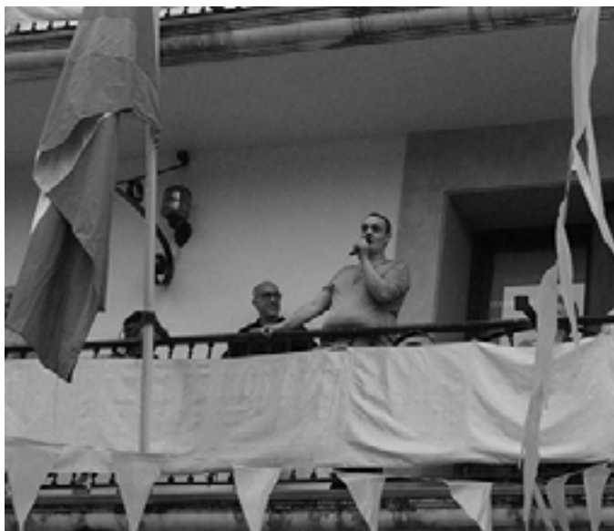
lazko sanpedroei Loretxukoek eman zieten hasiera. KARKARA