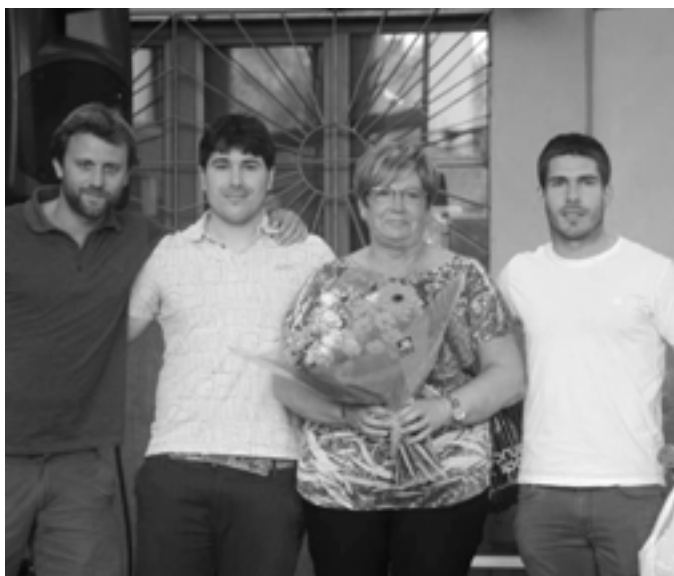
Orioko Futbol Taldeak denboraldi amaieran bazkaria egin zuen. OFT