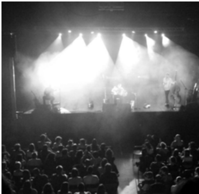
Emanaldiaren momentu bat, Korrontzikoak taula gainean . BAGA BIGA