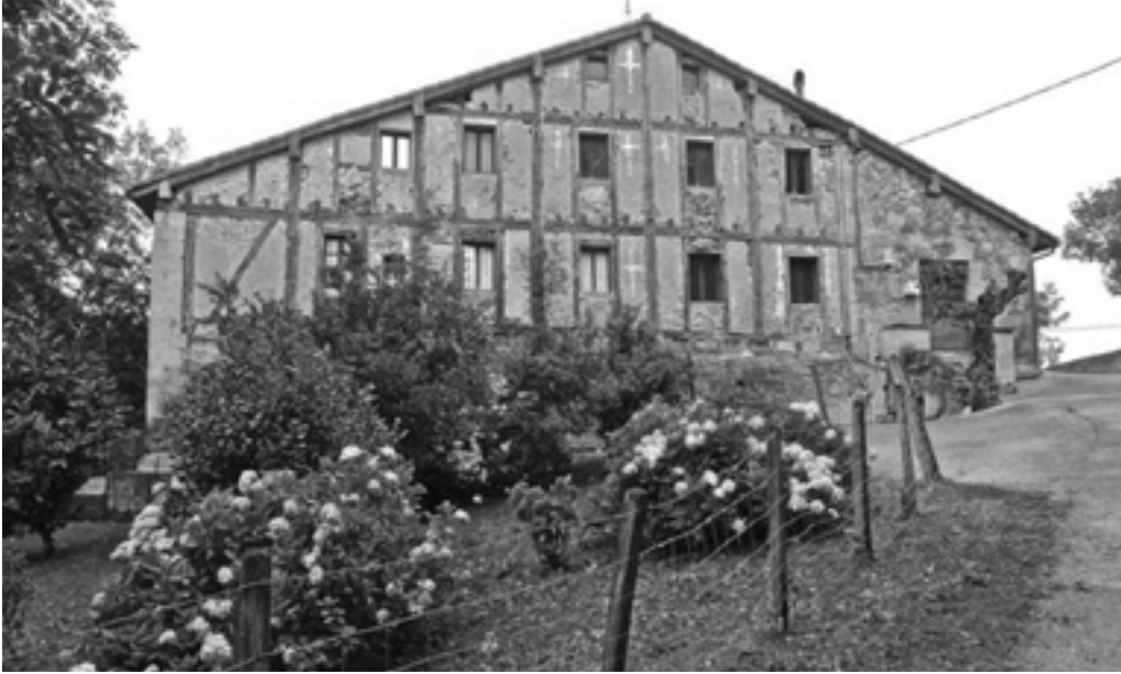
Loiolako San Ignaciok Iturriotz baserri honetan pasatu zuen Parisetik etxera egin zuen bidaiako azken gaua.