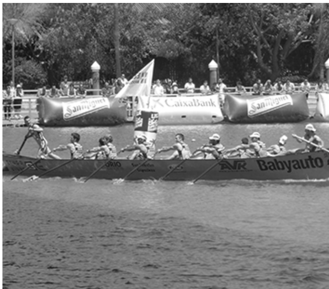
Orioko mutilak Sevillako estropadan. JESUS LEON