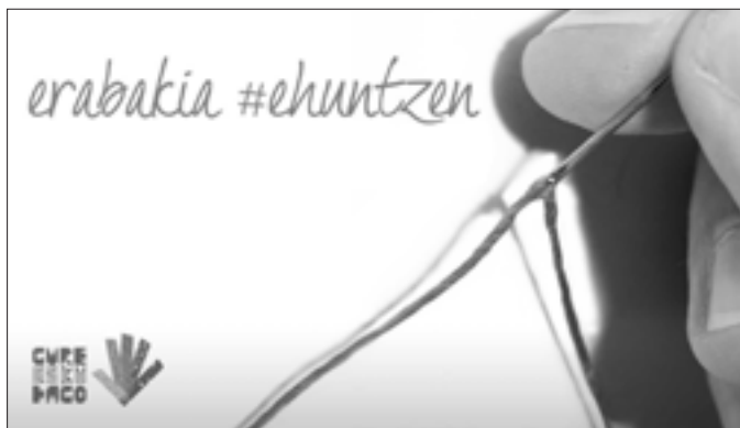
Orioko Gure Esku Dago