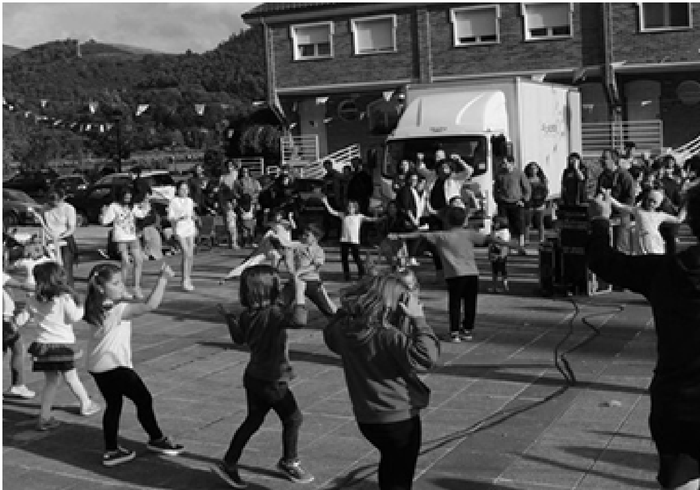
Anibarko Portuko festetan dantzaldia egin zuten . BEGOÑA RUIFERNANDEZ