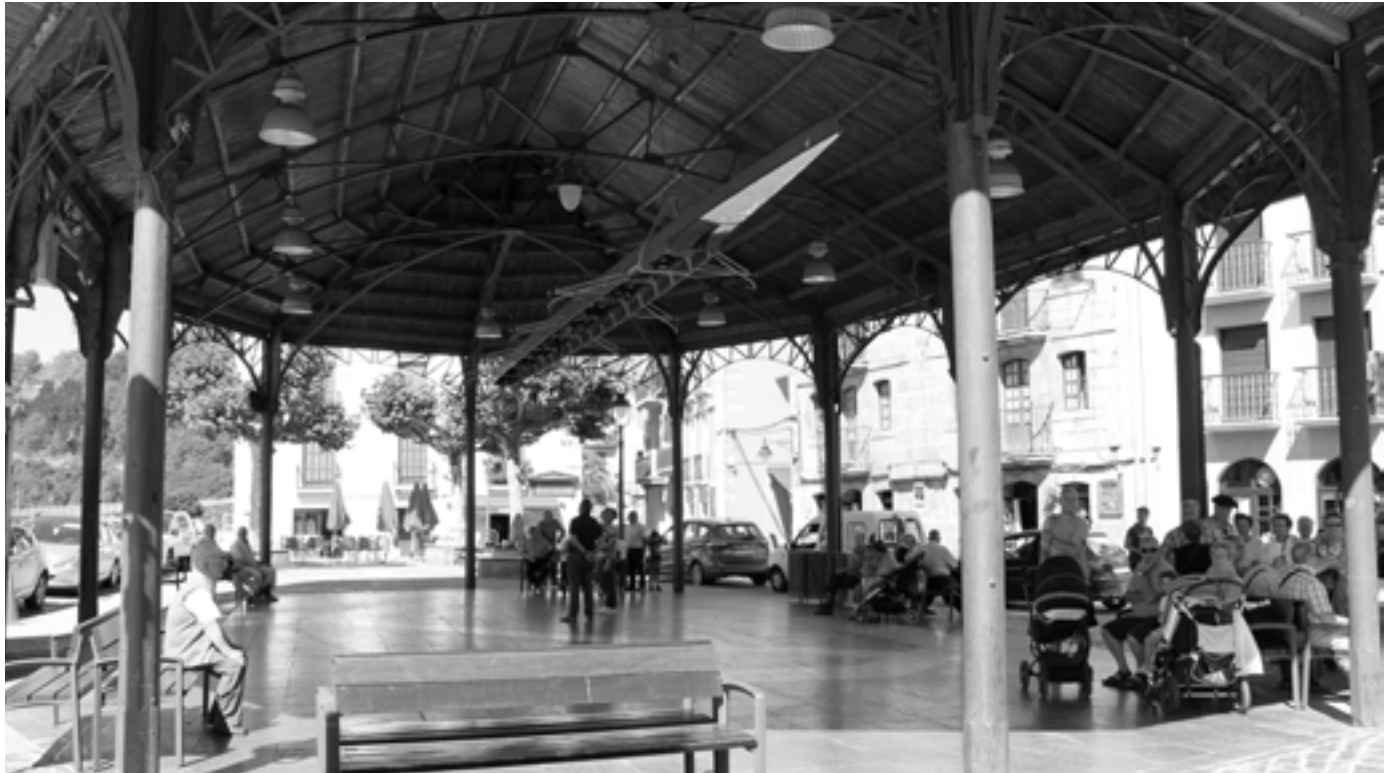
Orioko plaza. KARKARA

Aurreko legealdian onartu zen plaza asteburutan autoentzat ixtea. Ordutik, asteburuetan plaza itxi egin da. Erabaki horrek iritzi kontrajarriak sortu ditu. Batetik, herriarentzat onura ekarri duela pentsatzen dutenak daude; baina, beste alde batetik, herriko negozioei kalteak ekarri dizkiola uste dute hainbat ostalarik.