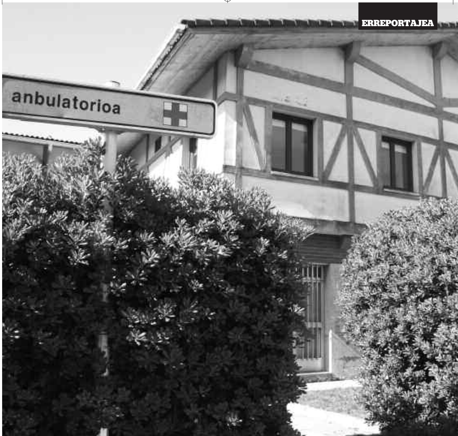
1976tik dago Orion Osakidetzaren oinarriko zerbitzuak jasotzeko gunea. KARKARA