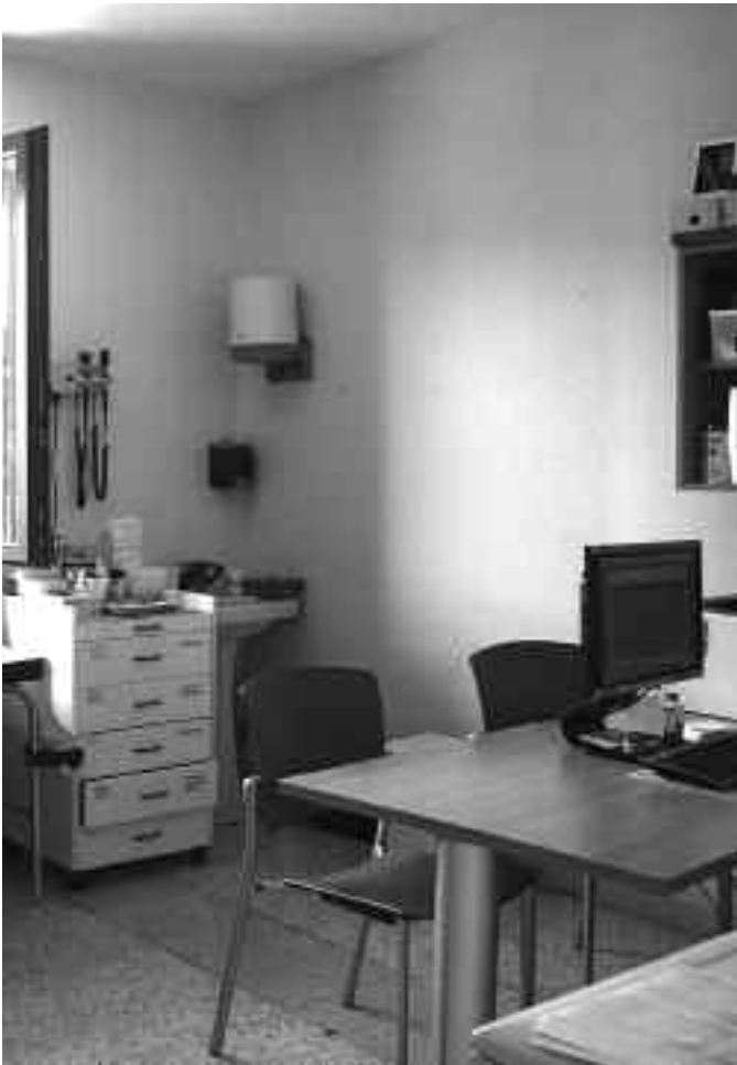
Hiru familia-mediku eta pediatra bat ditugu herrian. KARKARA

baita aldagela eta biltegiak berritu ere. Azkenik, 2009an teitua konpondu zuten, guztiz eraberritu.