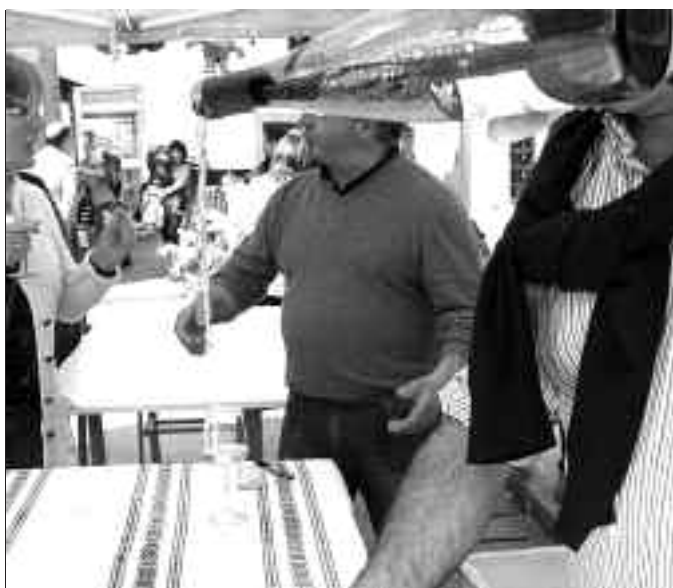
Jendea erruz biltzen da Aian txakolinaren aitzakian. KARKARA