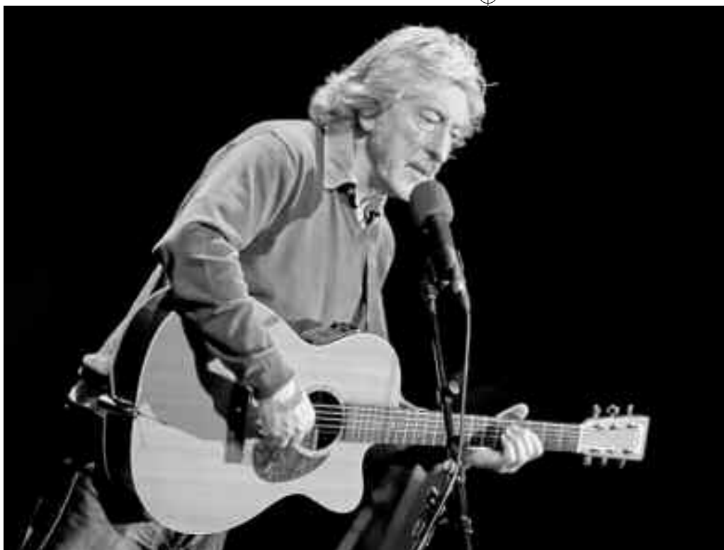
Benito Lertxundi gitarra eskutan. TXANTXANGORRIA