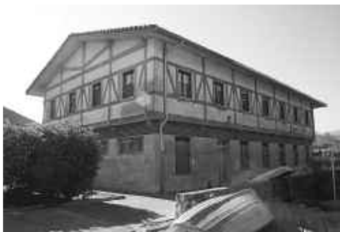
1985. urtean eraiki zen Itsas Etxea. KARKARA

“Herrian Itsas Etxea izenez ezagutzen den eraikinak erabilera ugari izan ditu beti”