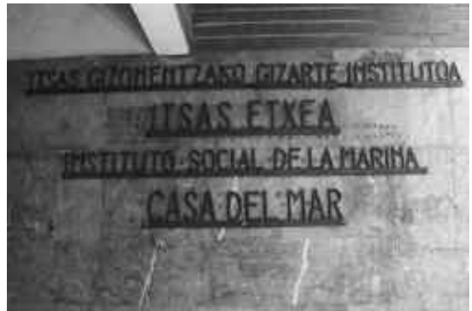
Eraikina Itsas Gizonen Institutoarentzat eraiki zuten berez. KARKARA