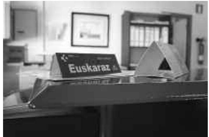
Anbulatorioko langile guztiek dakite euskaraz. KARKARA

Idatzizko lanak, berriz, gazteleraz egiten dituzte gehienetan. Batetik, terminologia aldetik errazago egiten zaielako – ikasketak gazteleraz egindakoak dira denak –, eta bestetik ez dakigulako beste aldean dagoen pertsona, informea irakurriko duena, euskalduna den ala ez –dio Aranburuk–.