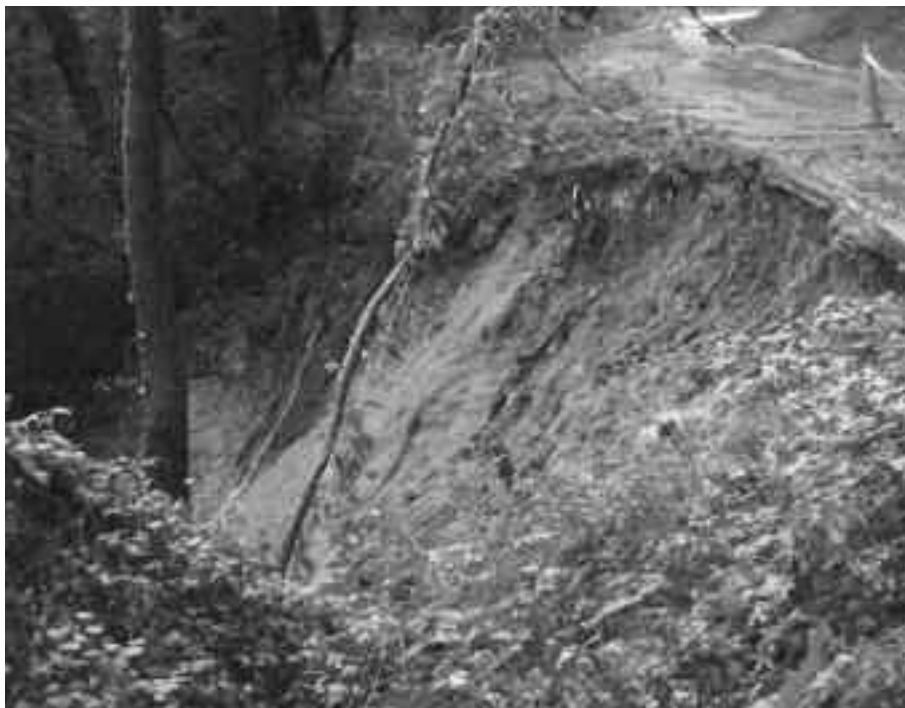
Benta bideko triskantza . ORIOKO UDALA

Uda eta udazken lehorraren ondoren, euria erraz bota zuen azaroan. Lurrak horrenbeste ur segidan hartu ezinda, luiziak izan ziren Orio eta Itxaspe eta herria eta Orioko Benta lotzen dituen bideetan.