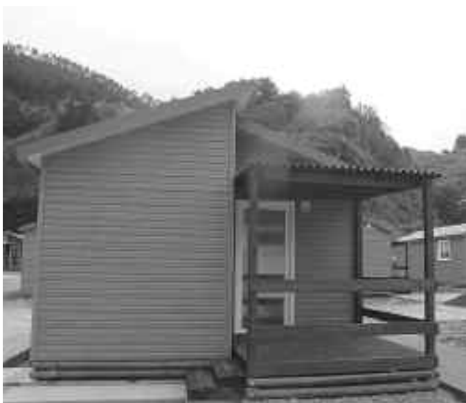
2013an egin zituzten Bungalowak, argazkian horietariko bat. KARKARA