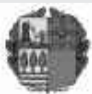
Eusko Jaurlaritzako Kultura Sailak diruz lagundutako hedabidea