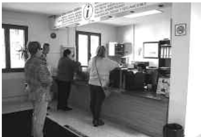
Gaur egun bi lagunek egiten dute lan harreran. KARKARA

2005ean berogailu sistema berri zuten eraikinean, eta urte bat geroago harrera-lekua eta komunak berri, araudi-egokitzeko. Ateak eta leihoak aldatu zituzten 2007an, eta