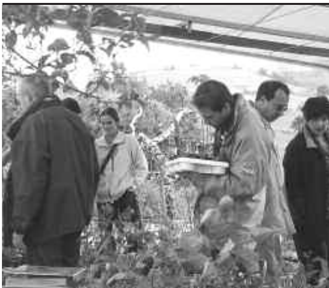
12. edizioa izango du aurten Landare Berezien Azokak. KARKARA