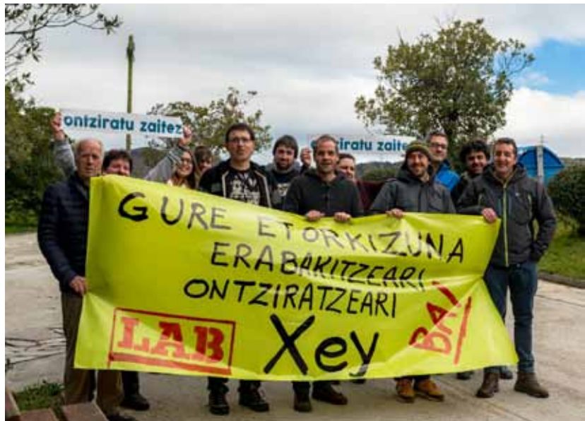
Goian Zumaiaiko Herri Eskolako DBHko ikasleak Erromara egindako bidaiari. Azpian, Xey enpresako langile taldea.

beharrezkoak dira herri nahia aurrera atera eta bultzada hori emateko.