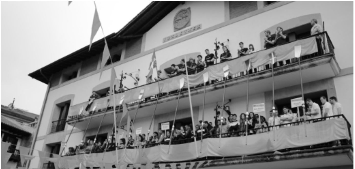
Parte hartu zuten arraunlari guztiak, aurkezpenean. KARKARA