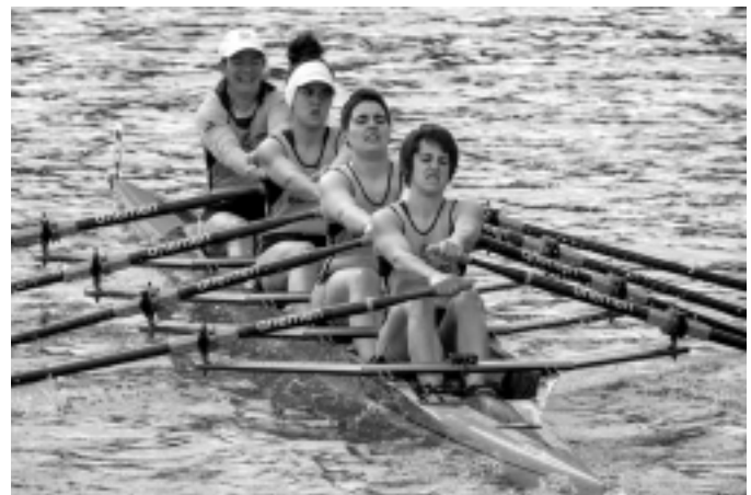
Orioko neskak lemazain gabeko lauokan. KARKARA