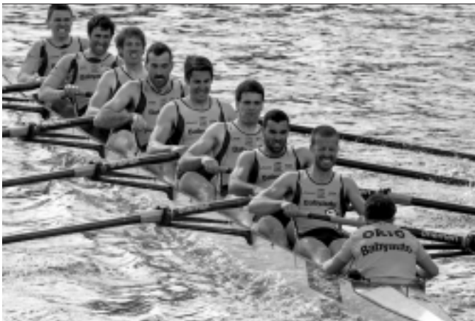
Lemazaindun zortzikoan Orioko mutilak. KARKARA

1968ko Nazioarteko Estropada bizi izan zutenek festa jendetsua dute gogoan. 47 urtean 15 aldiz antolatu dute, azkena 2009an. Arraunketa elkarteak 50 urte bete ditu aurten, aitzakia ezin hobea berriz antolatzeko. Bizia hartu du berriz Nazioarteko Estropadak, urte luzez amestutakoa bete dute. Apirilaren 4an izan zen eta festa giroa nagusitu zen egun horretan Orion.