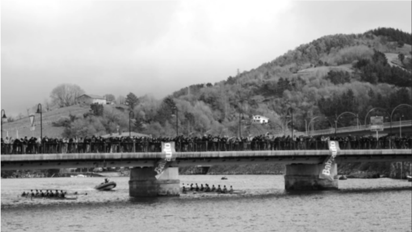
Zubia jendez lepo. Bi zortziko zubi azpitik igarotzen. KARKARA