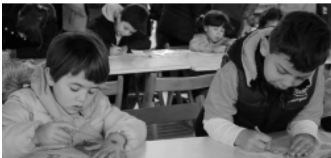
Haurrak jolasean eta margotzen aritu ziren plazan. KARKARA