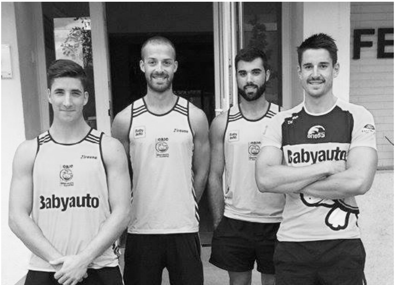
Mundialean parte hartu duten Orio Arraunketa Elkarteko lau arraunlariak. IMANOL GARMENDIA

“Mundiala ez da aurtengo esperientziarik onena izan. Urtean zehar lan handia egin arren, ez dugu helburua lortu”