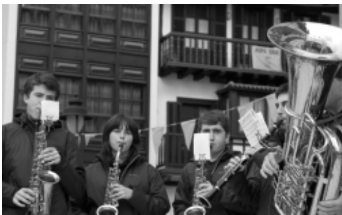
Talai Mendi txarangako hainbat kide. KARKARA