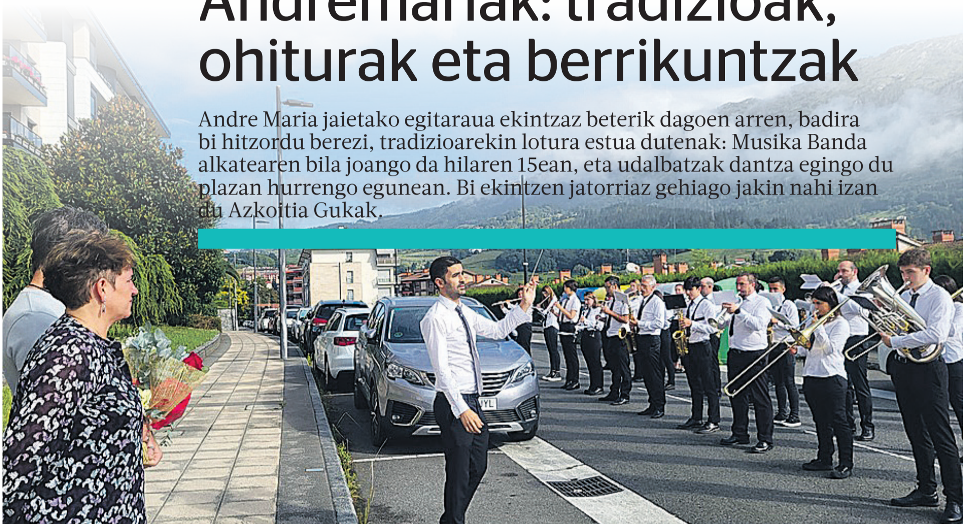
Musika Banda Ana Azkoitia alkatearen bila joan zen, iaz.

Andre Maria jaietako egitaraua ekintzaz beterik dagoen arren, badira bi hitzordu berezi, tradizioarekin lotura estua dutenak: Musika Banda alkatearen bila joango da hilaren 15ean, eta udalbatzak dantza egingo du plazan hurrengo egunean. Bi ekintzen jatorriaz gehiago jakin nahi izan du Azkoitia Gukak.