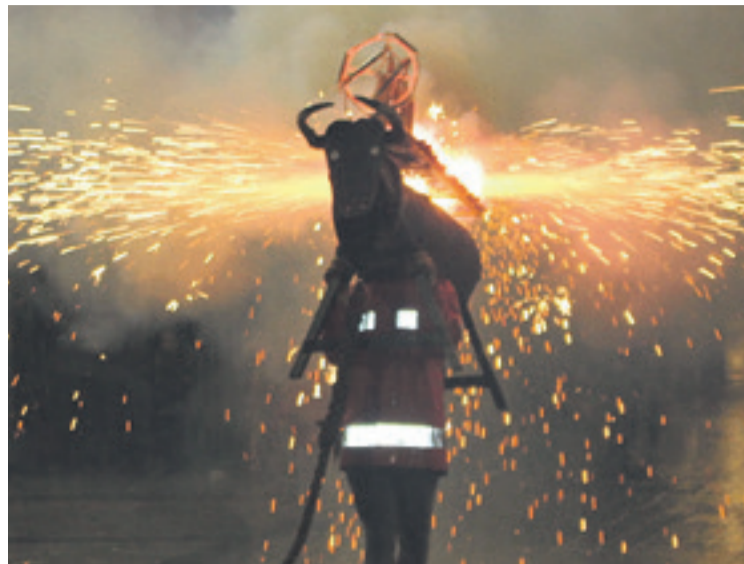
Azkoitiko suzko zezena.