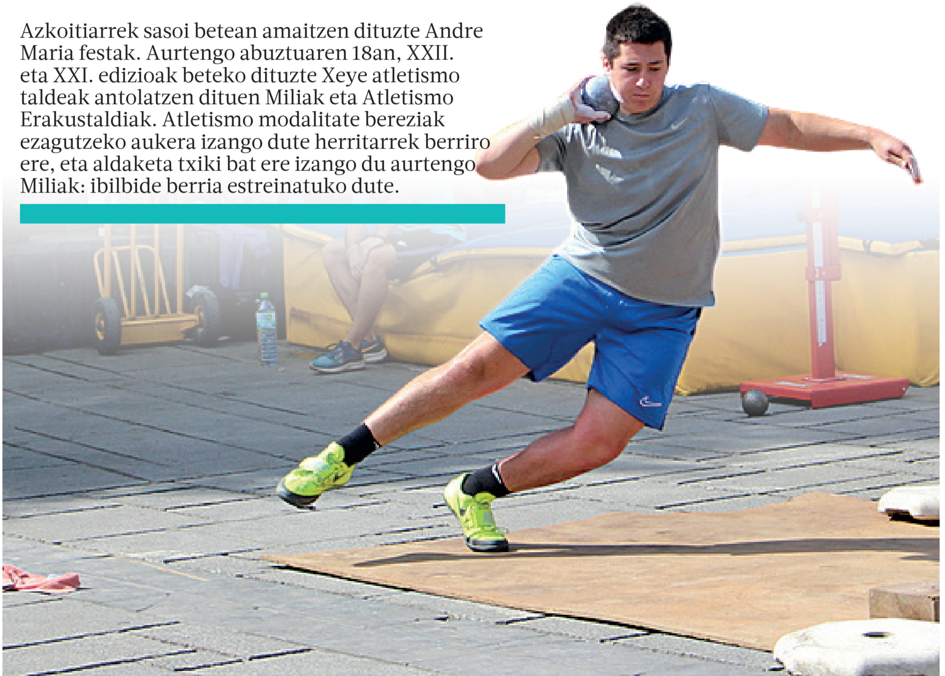
Kirolari bat pisua jaurtitzen.

Azkoitiarrek sasoi betean amaitzen dituzte Andre Maria festak. Aurtengo abuztuaren 18an, XXII. eta XXI. edizioak beteko dituzte Xeye atletismo taldeak antolatzen dituen Miliak eta Atletismo Erakustaldiak. Atletismo modalitate bereziak ezagutzeko aukera izango dute herritarrek berriro ere, eta aldaketa txiki bat ere izango du aurtengo Miliak: ibilbide berria estreinatuko dute.