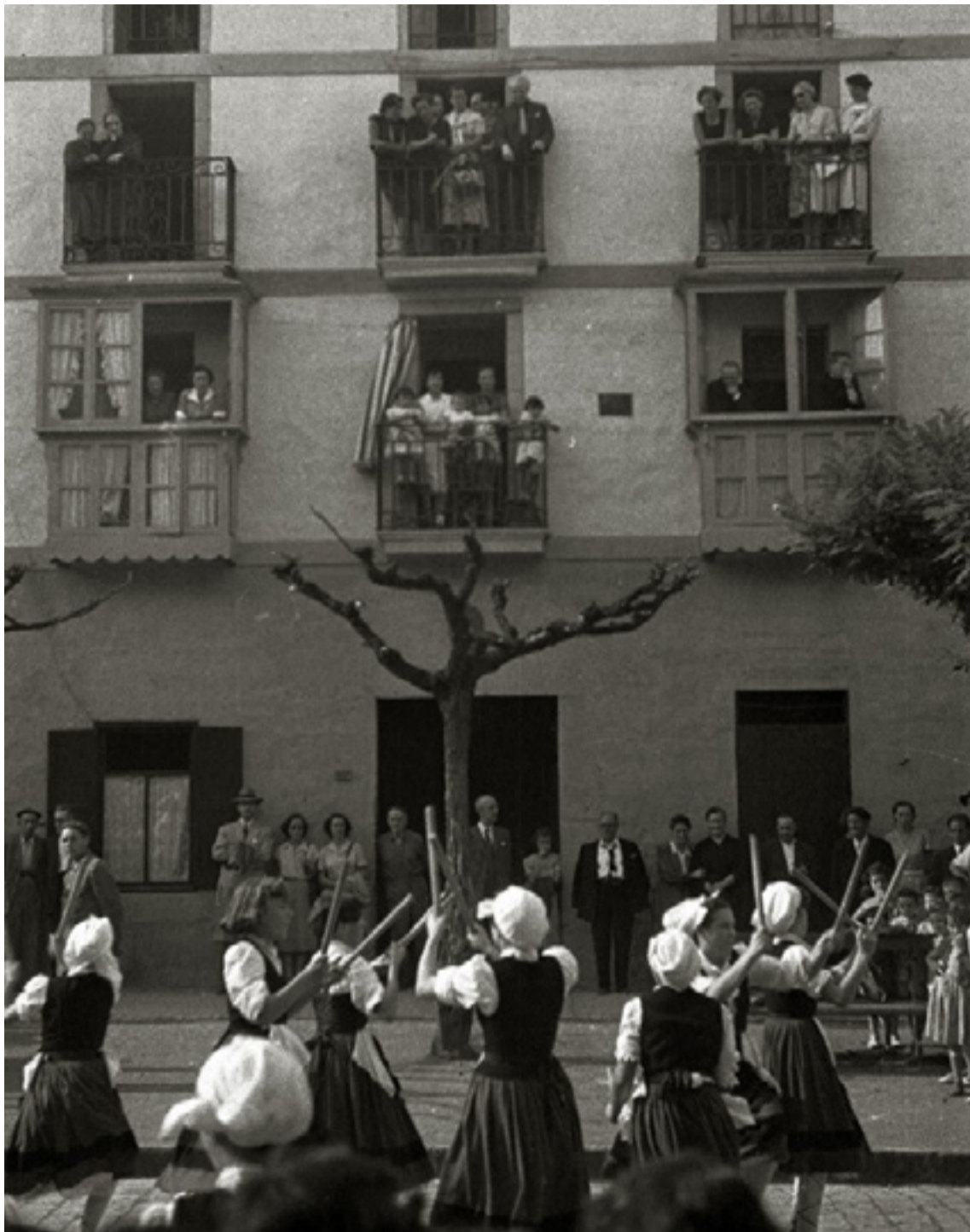
Dantzariak Plazaberrin, 1951 urtean.

tiok ezin garez udaltxeko balkoian elkartu, aurten go festetako egitaraua hartu dugu jarraibide gisa, eta antolatutako ekintzetan, era batera edo bestera, modu aktiboan parte hartzen duten Azkoitiko taldeetako ordezkariak eta herritarrak gonbidatuko ditugu balkoira», azaldu du Azkoitiko Udalak.