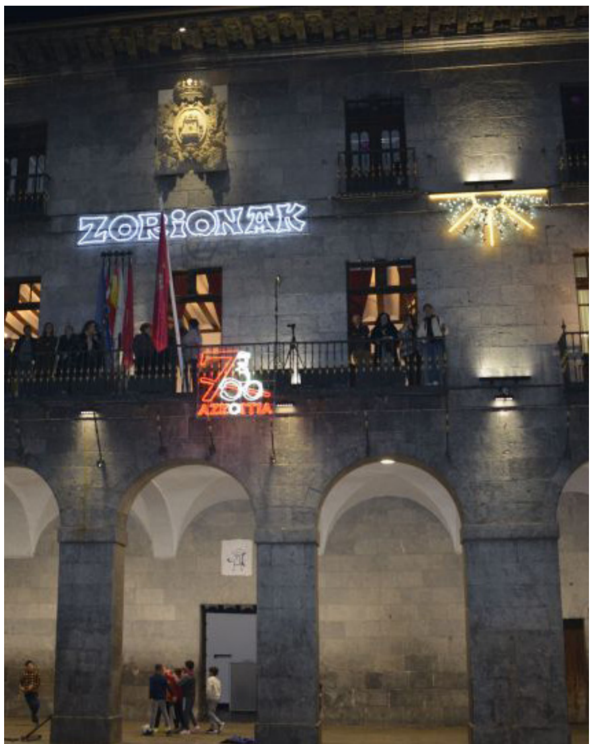
Azkoitiko udaletxea, urtarrilaren 4an, zazpigarren mendeurrena ospatu zen egunean.

A lfonso XI. a erregeak hiri gutuna eman zion Azkoitiko hiribilduari 1324ko urtarrilaren 4an, eta beraz, aurten 700 urte bete dira gertaera hartatik. 1324ko urtarrileko egun hark zazpi mendeko historiaren hasiera ezarri zuen, eta horrek markatu du, neurri handi batean, Azkoitian aurtengo urte erdiaren agenda kulturala, data berezi hori oroitzeko ekitaldi ugari gauzatu baitituzte.