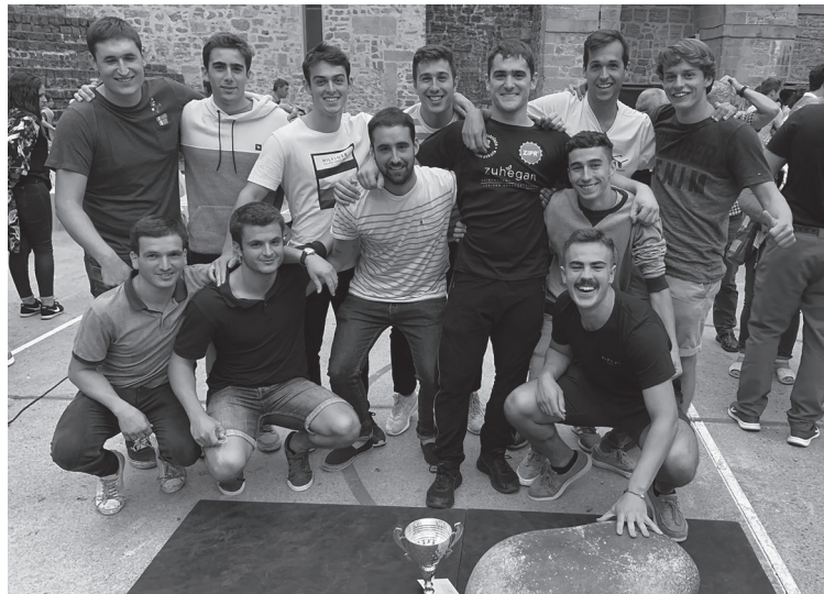
Gorka Etxeberria eta lagunak. GETXEBERRIA

Ostolazakin badet laguntza prestatzen, urtez urte ari naiz nere markak ontzen, ea noizbait Aldape didazun laguntzen, udaletxeko balkoin txapela astintzen.