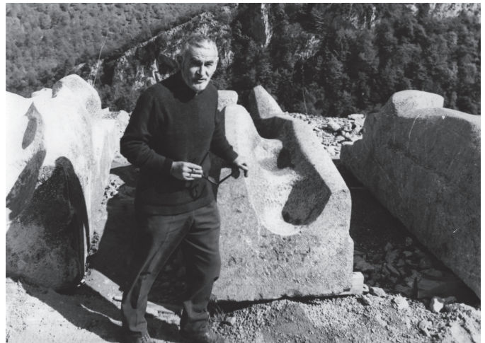
Apostoluekin errepede bazterrean.

“Oteizak hiru ideia nagusi uztartu nahi zituen Arantzazun: eskultorikoa, erlijiosoa eta sinbolikoa.”