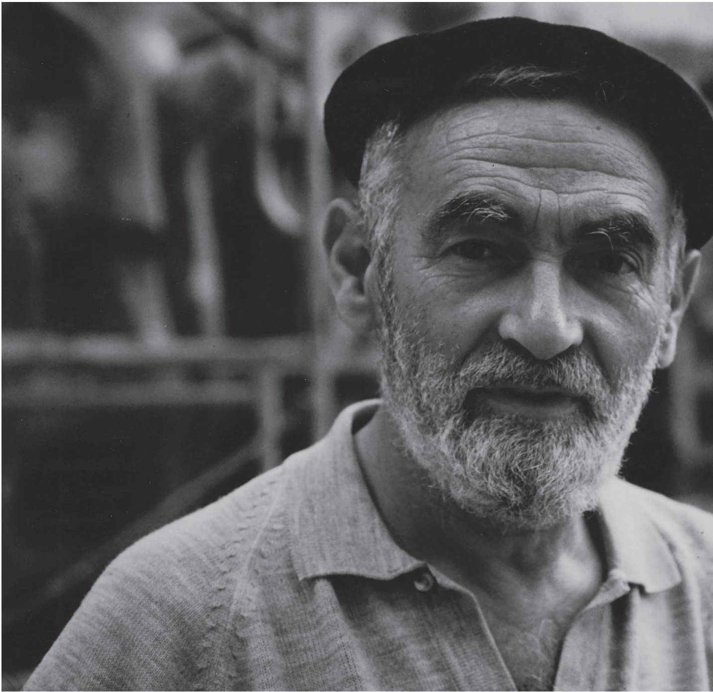
Jorge Oteiza.