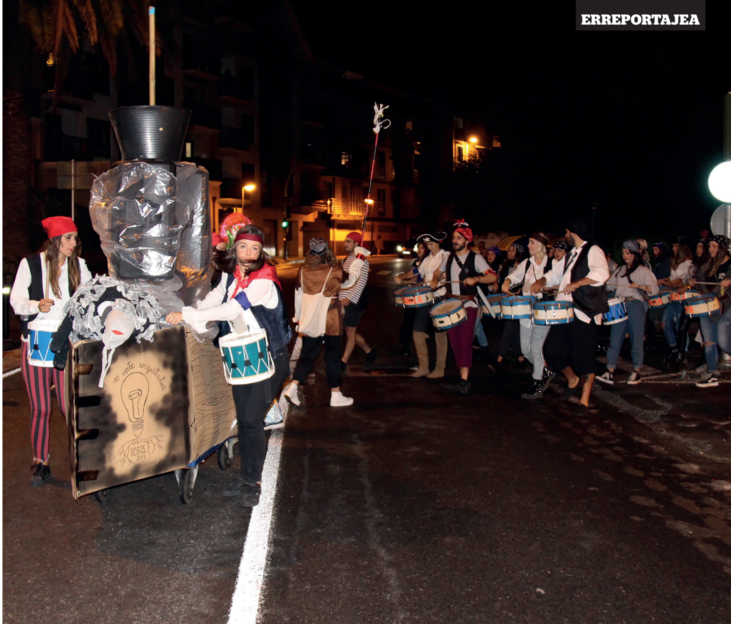
Piraten Danborradarekin eta kaleen izen aldaketarekin eman zioten hasiera gazteek aurtengo Gazte Festei. ONINTZA LETE ARRIETA