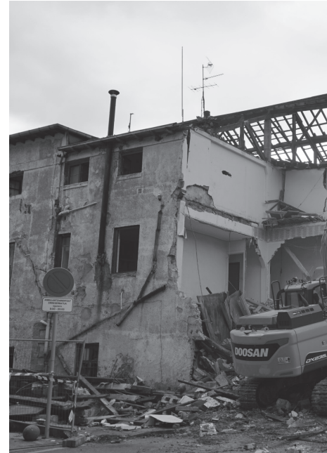
Urriaren 9an hasi ziren eraikinaren kanpoko ho