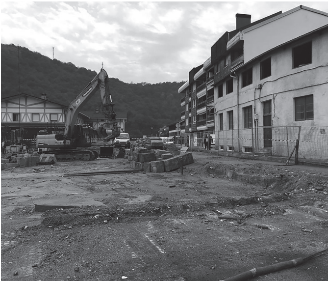
Kofradia Zaharra botata, partzela garbitzen ari dira lanean. KARKARA