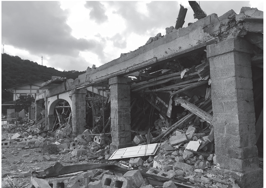
Urriaren 10ean ateratako argazkia, eraikina botata.