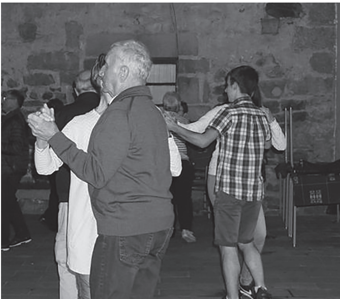
Urriaren 20an eman zioten hasiera erromeria denboraldiari. KARKARA