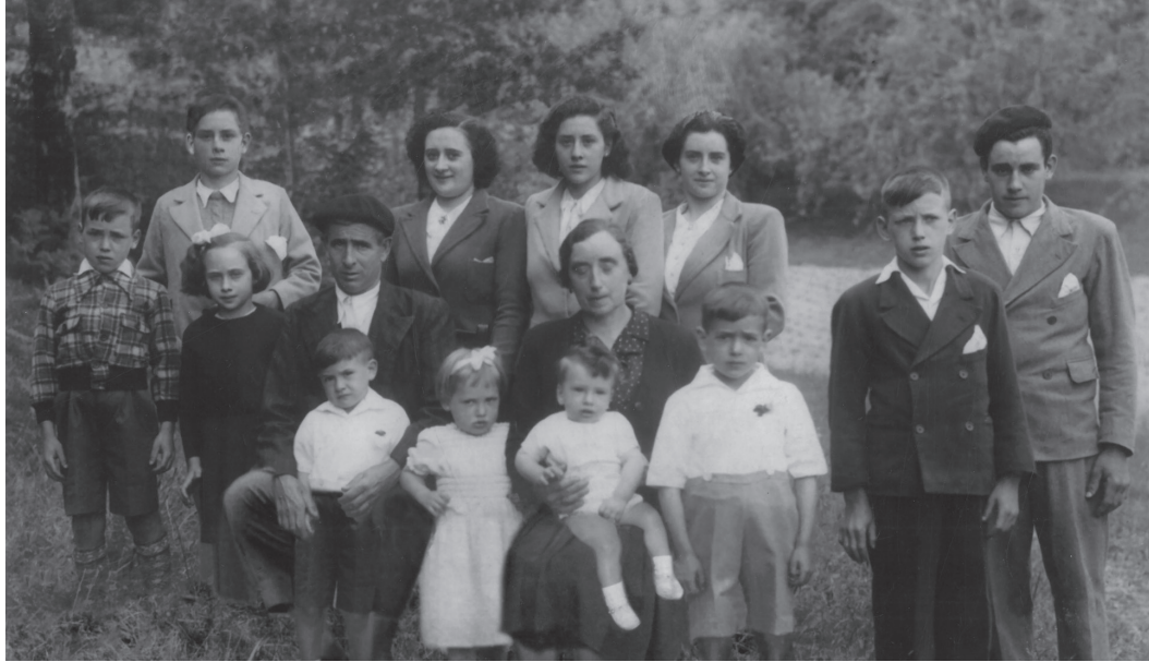
Iruntxiberriko aita, ama eta 12 seme-alaba; gazteena artean jaio gabe.