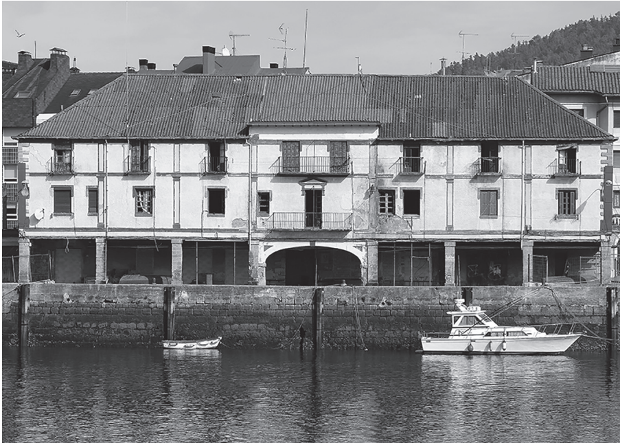
Kofradia Zaharra. Botatzeko lanak hasi aurretik.