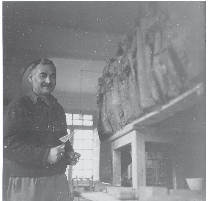
Friso materialean sortutako piezei forma ematen.