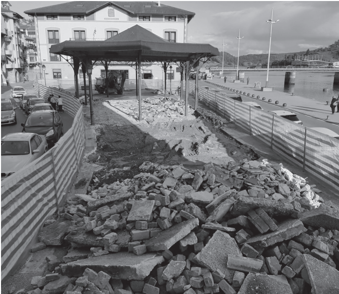
Aurrera doaz Herriko Plazako berritze lanak. KARKARA