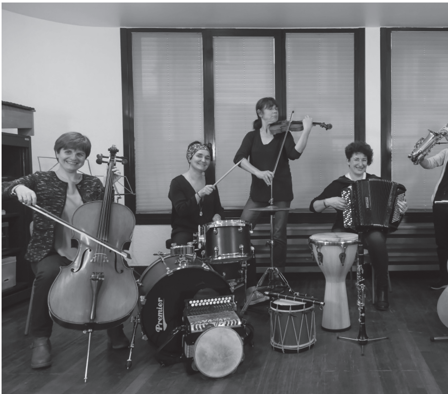
Danbolin musika eskolako kideak.