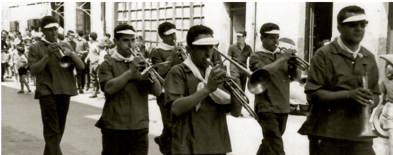
Herriko Txaranga kalez kale. 1965