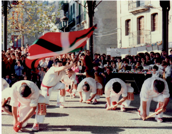
Dantzari Txikien egunean, plazan eskainitako saioa.

Jende mordo bat ibiltzen zen. Akordatzen naiz hasieran goiko solairuan ere futbolinean jarri genituela. Behin gora igo eta konturatu nintzen, ordea, porterian txapela jartzen zutela pilotarik ez barrura sartzeko, eta behera jaitsi genituen. Gero, goian, ping-pong-eko mahaiak