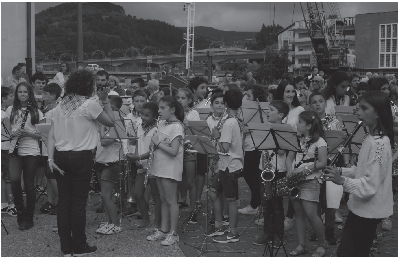
Danbolin musika eskolako ikasleak 2018ko San Pedro jaietako txupinazoan.

Nik guraso bezala ulertu dezaket ez dela egokia, baina musika eskolaren zergatia entzutean ulertzeko modukoa iruditzen zait. Beste musika eskolekin ere hitz egiten dugu eta ez dago sistema perfekturik, beti dago akatsen bat. Zaila da.