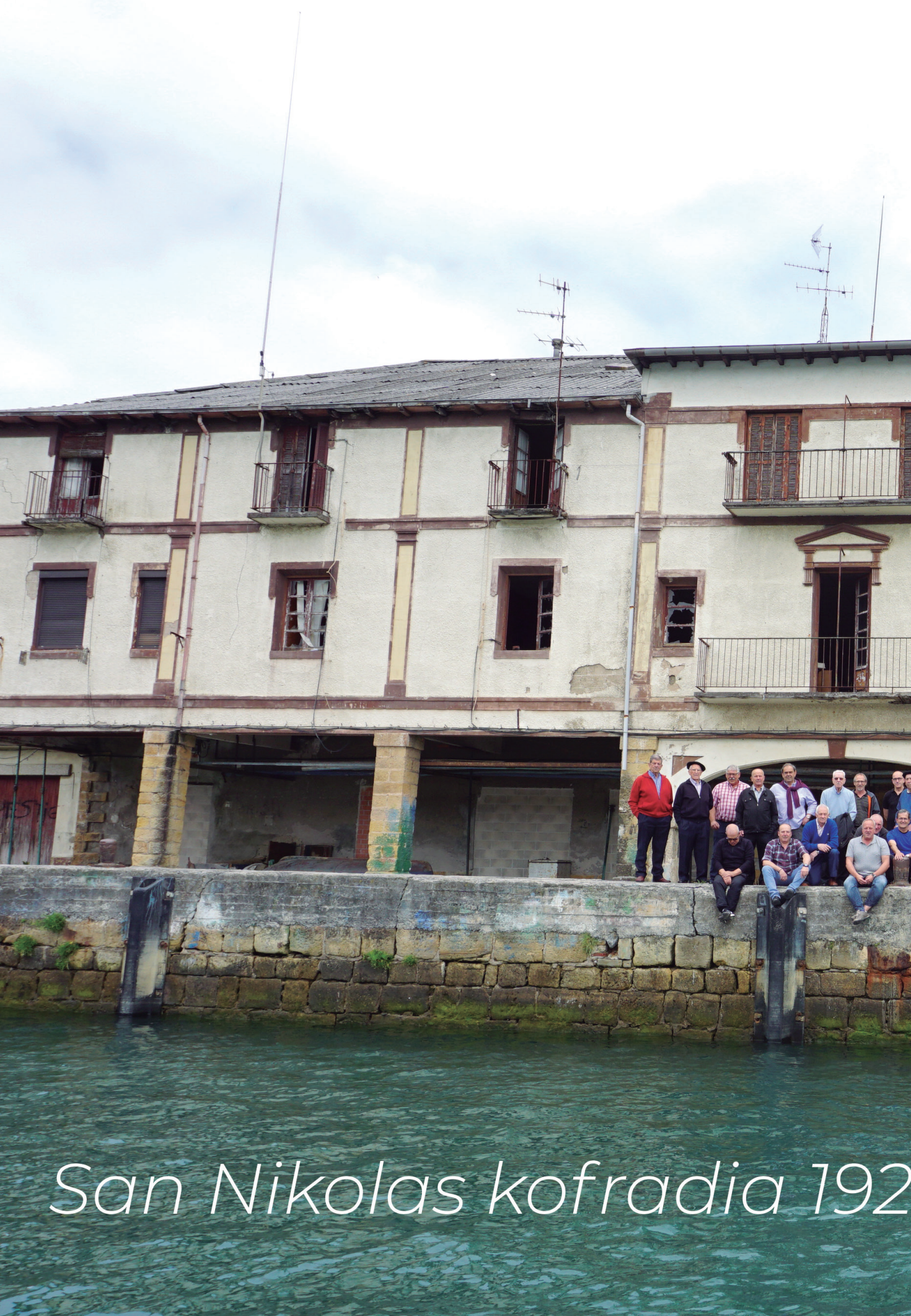
San Nikolas kofradia 192