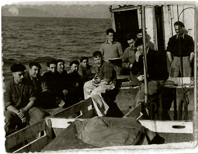
San Antonio baporeko arrantzaleak.

dut beti, ohituta geunden eta. Eta kanpora ere, ez gara apenas atera izan. Bilbo aldera, estropadetara bakarrik!