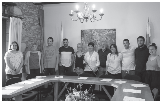
Udala ostatu duten zinegotziak.