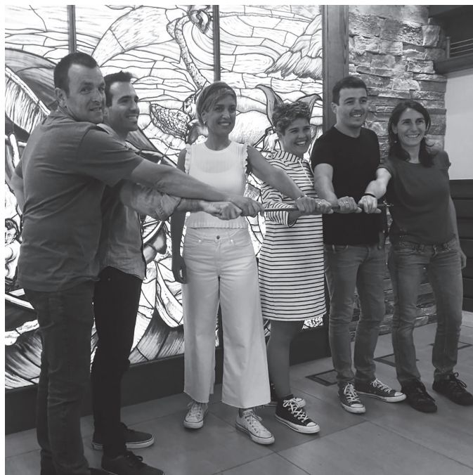
Udala osatuko duten EH Bilduko zinegotziak. EH BILDU

Esperientzia eta balio askoko taldea delakoa gurea. Horregatik, uneoro aipatu dugun elkarlanerako zubiak eraikitzen jarraituko dugu guztiekin, parte hartzea sustatuz eta herritik eraginez. Denontzako dagoelako lekua, denok egon behar dugulako.