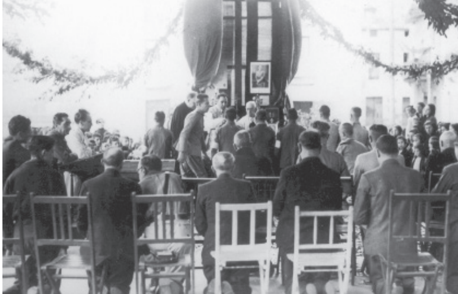
Gerra ondoren, herriko plazan, meza, koadroan Franco.