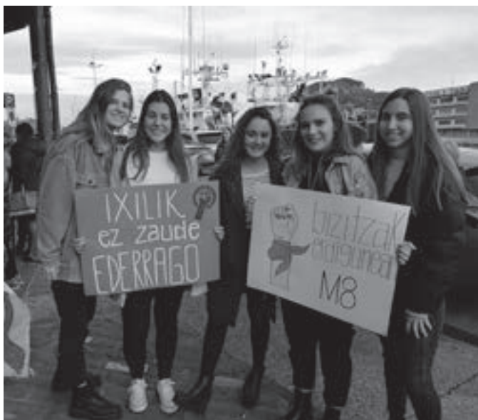
Orioko emakume kuadrilla arratsaldeko manifestazioan. KARKARA