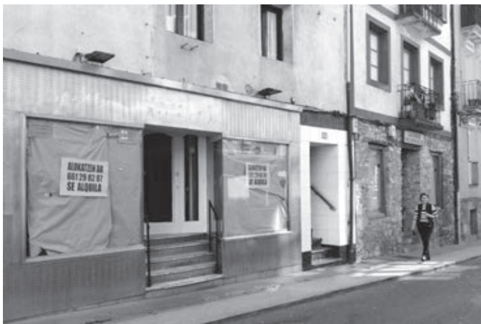
Hatoz taberna zenaren kanpoaldea. KARKARA

Urbilen egun pasa, konprak ta zinema, lokalean zerbeza lagunarte dena, latza da negozio txikien dilema; zabaltzean joan ez, eta ixtean pena.