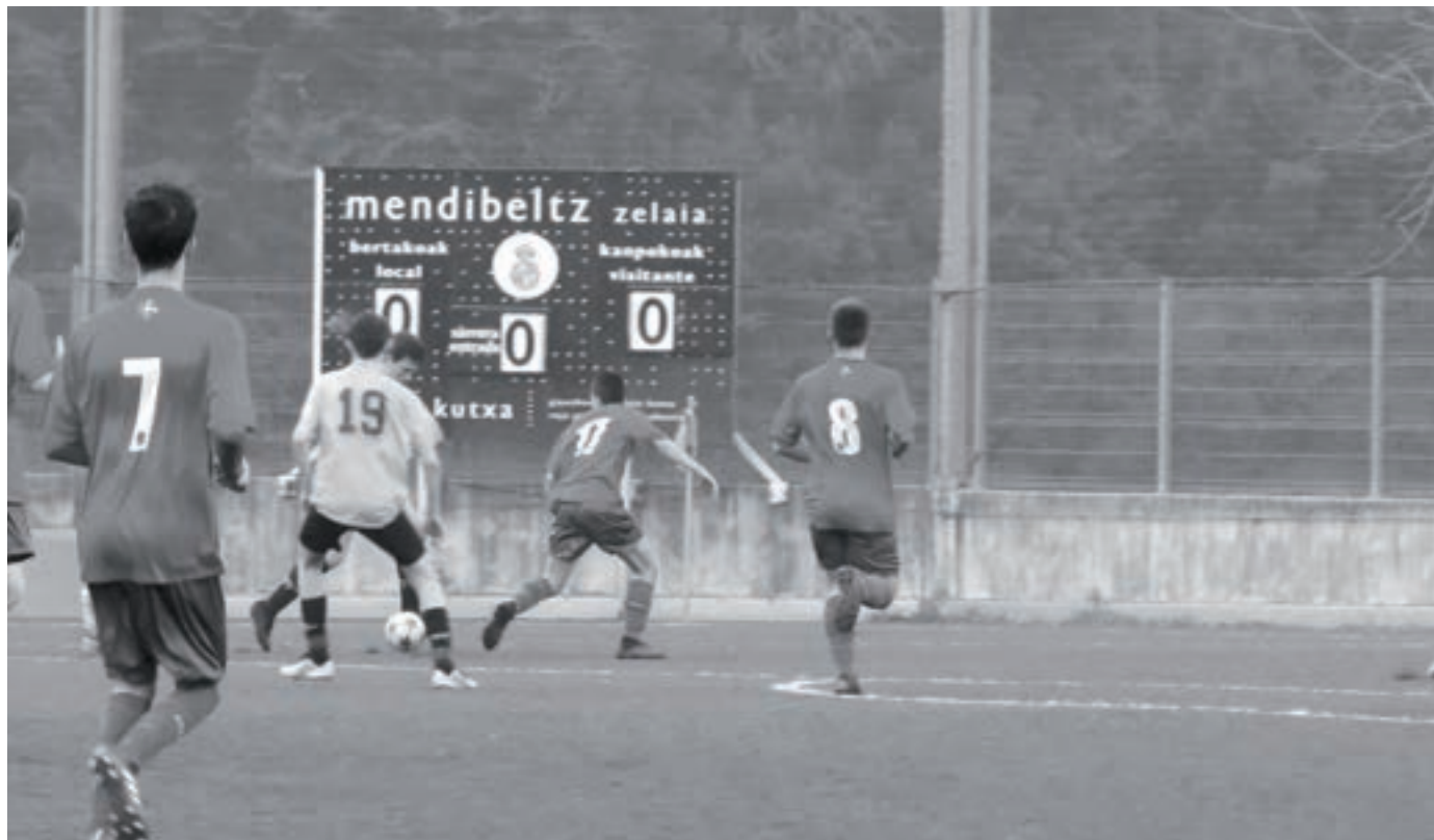
Orioko jubenilak, herriko Mendibeltz zelaian futbol partida bat jokatzen. KARKARA

Gipuzkoako makina bat udalerrik dute Kiroletako Udal Patronatu bat; esate baterako, Donostiako, Zarauzko, Elgoibarko edota Azpeitiko Udalek.