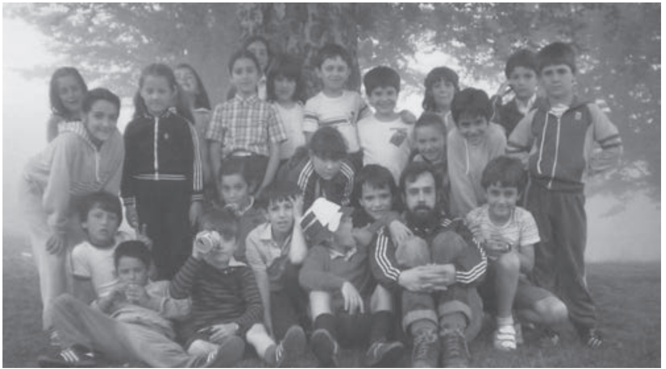
Pagoetan 1974an jaiotako neska mutilekin.

egindakoa. Garaia ere halakoa zen, Frankismotik atera berriak, herrigintzan aritzeko ilusio handia zegoen.