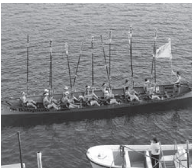
Nesken ontzia Oriaren XXV. Jaitsiera irabazi berri. KARKARA