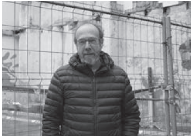
Errastineko lokaletan eman zituen bere lehen eskolak.

Publikoa nola ulertzen den, baina nik uste dut Orioko Ikastola baino publikoago izaten zaila dela: Ez dut inor