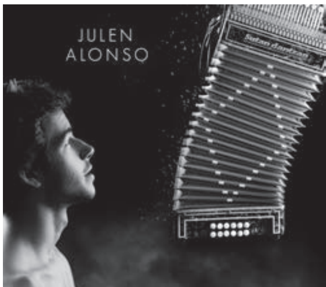
Julen Alonsoren lehen diskoko portada. JA