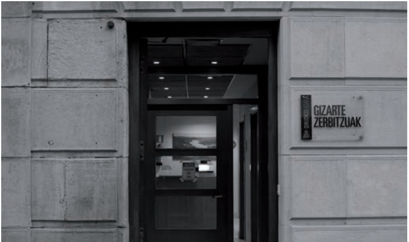
Orioko Gizarte Zerbitzu saileko bulegoaren sarrera. KARKARA

Beharrezkoa al da gizarte ongizateko bulegoa administratzaile batekin indartzea, sail honen zerbitzuak eta herritarrei eskainitako arreta hobetzeko? Horixe izan da hilabete honetako zenbakirako PSE-EE alderdiak Udalaren Txokoa atal honetarako beste taldeei botatuko galdera.