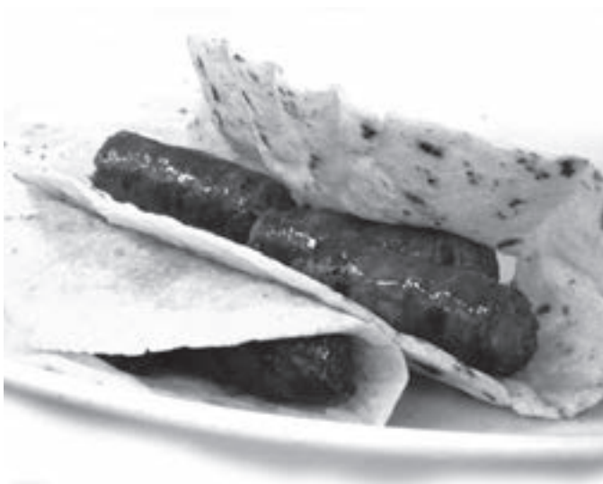
Taloak eta txistorra, Santo Tomas eguneko bereizgarriak. KARKARA