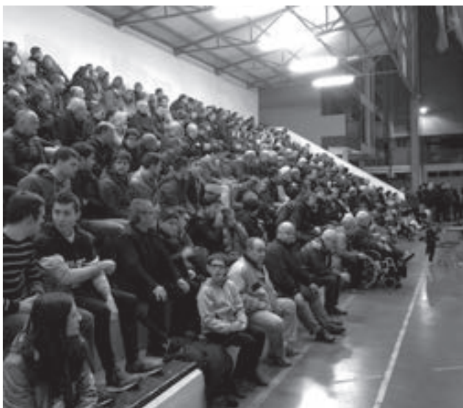
Frontoiko harmailak goraino bete ziren sanikolasetan. KARKARA