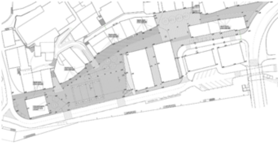
Herriko Plaza eta Aritzaga kalea oinezkoentzat izatea proposatzen du proiektuak. ORIOKO UDALA

2016ko uztailean Aritzaga kalea eta Herriko Plaza berrurbanizatzeko lanak esleitzeko lehiaketa publikoa ireki zuen Orioko Udalak. Lehiaketan parte hartu zutenei beren proposamena lantzea eskatu zion udalak, hau da, oinarritzko lan batzukeginda nola berrurbanizatuko luketen herriko sarrera.