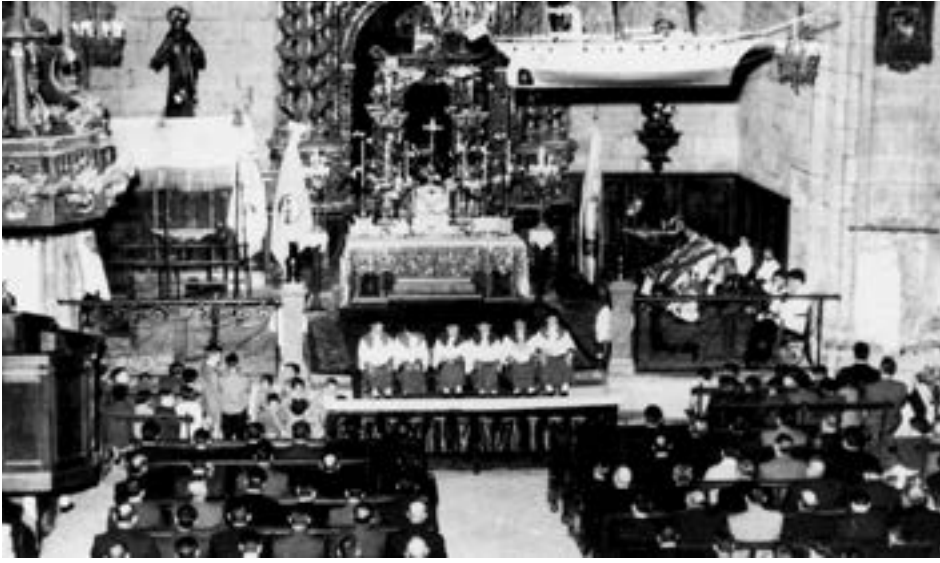
Eliza gainezka: hiru apaiz, sei monagillo, pulpitua... beste garai batzuk. EZEZAGUNA