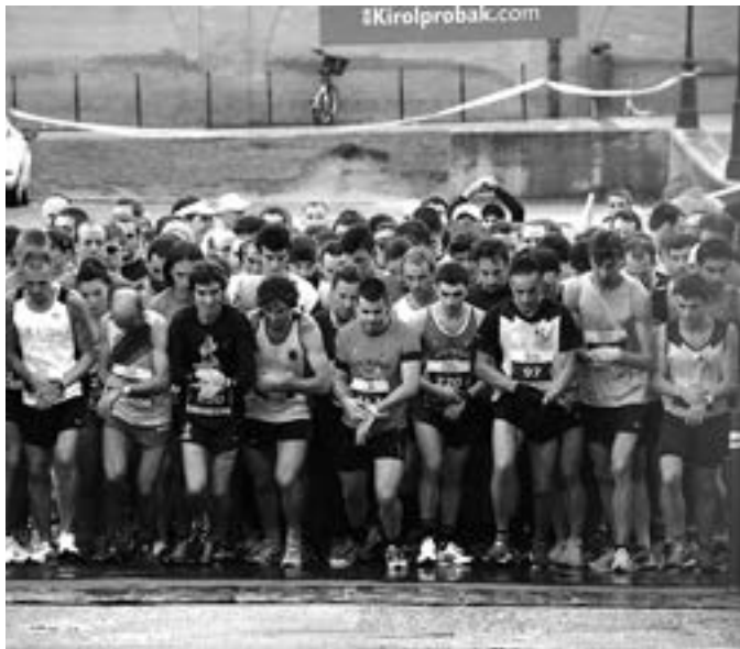
187 korrikalarik hartu zuten parte Herri Lasterketan. A. MUTIOZABAL