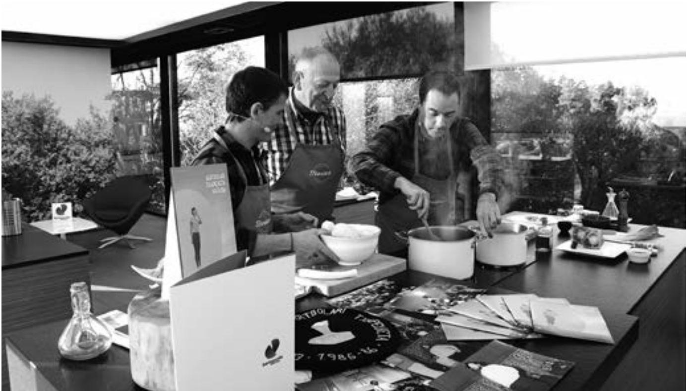
Iturrieta, Lizaso eta Agirresarobe, bik hitz egin eta batek sukaldatu. BERTSOZALE ELKARTEA

“Errezetak berritzeagatik Aldapako bazkideen ahotik entzundako errieta saioak ere kontatu ditu.”