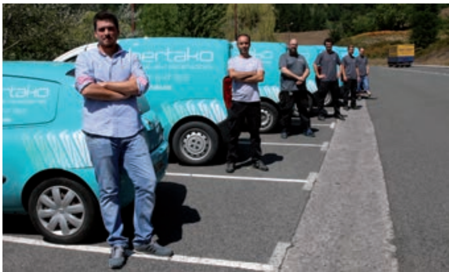
Bertako enpresako teknikariak, mantentze lanetarako erabiltzen dituzten autoekin.