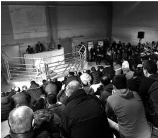
Lehen aldiz, arraza anitzeko ganaduen enkantea egin zuten. KARKARA