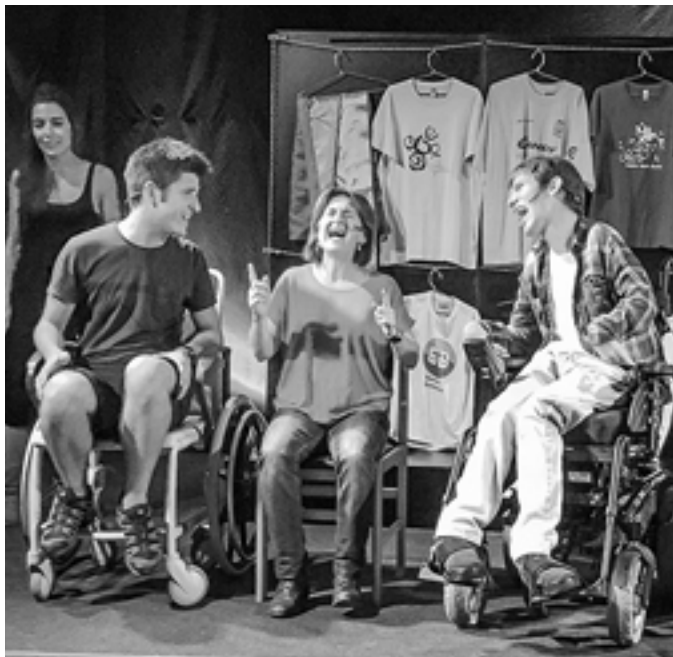
Inklusioa du hizpide Jendartean bidaide antzezlanak. J. ZABALETA