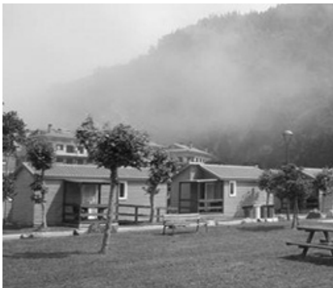
Orioko kanpinaren argazkia.