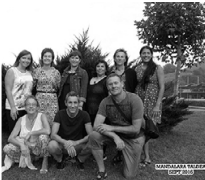
Hamar urte bete ditu Mandalarak. Lan taldearen argazkia.