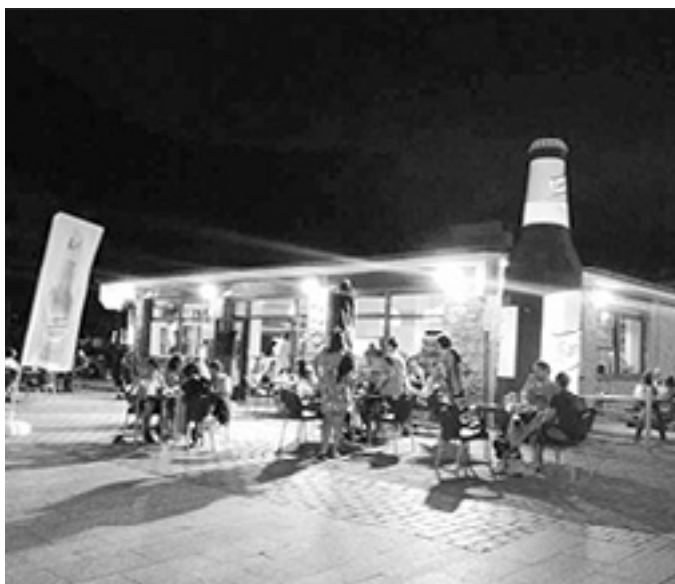
Mola-Molako kontzertu eta jaietan ere jende ugari ibili da.