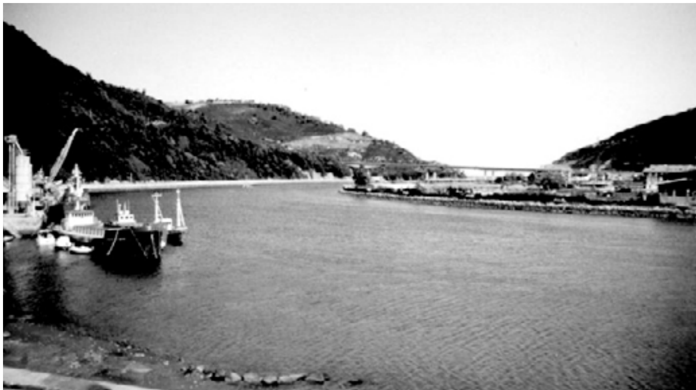
Orioko itsasadarraren irudi bat . KARKARA

Oria ibaia Otzaurteko magalean jaiotzen da. Zegamatik Oriorako bidea egiten du ibaiak eta Orion itsasoratzen da. Orioko itsasadarra Natura 2000 Sarearen baitako eremua da. Sare horrek interes berezia duten habitat eta espeziek babesa du helburu. Horrek zer esan nahi du? Oriako itsasadarra babes bereziko eremua dela.