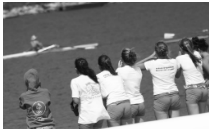
Avirongo gazteak taldekideak animatzen. JOXEMARI OLASAGASTI