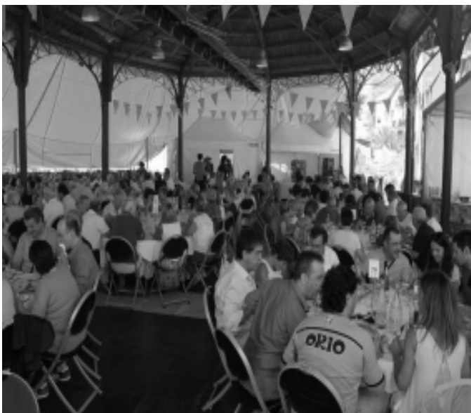
Bisiguaren Festan herriko plaza jatetxe bihurtu zen . KARKARA