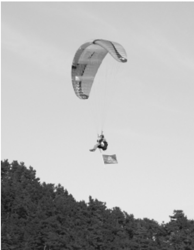
Parapentean jaitsi zuten irekierako bandera. KARKARA