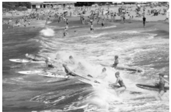
Sorospen probak hondartzan egin zituzten. KARKARA