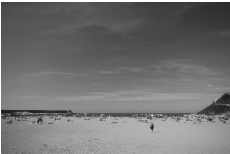
Orioko hondartza abuztuko egun eguzkitsu batean.