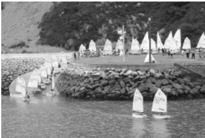
Kofradia berriko zabalgunea belaontzi txikiz bete zen. KARKARA

Gales, Irlanda, Britainia, Eskozia, Pays de la Loire, Nafarroa, Portugal, Kuba, Galizia, Asturias, Kantabria... arku atlantikoko hainbat eskualdetatik etorritako ehunka gazte aritu ziren uztailaren 13tik 16ra Orion eta Zarautzen uretako kirolean lehiatzen. Surfa, piraguismoa, bela, arrauna, igeriketa eta ur irekietako kirolez gozatzeko aukera izan zuten itsasertzera edo Oria ibaira gerturatu zirenek.