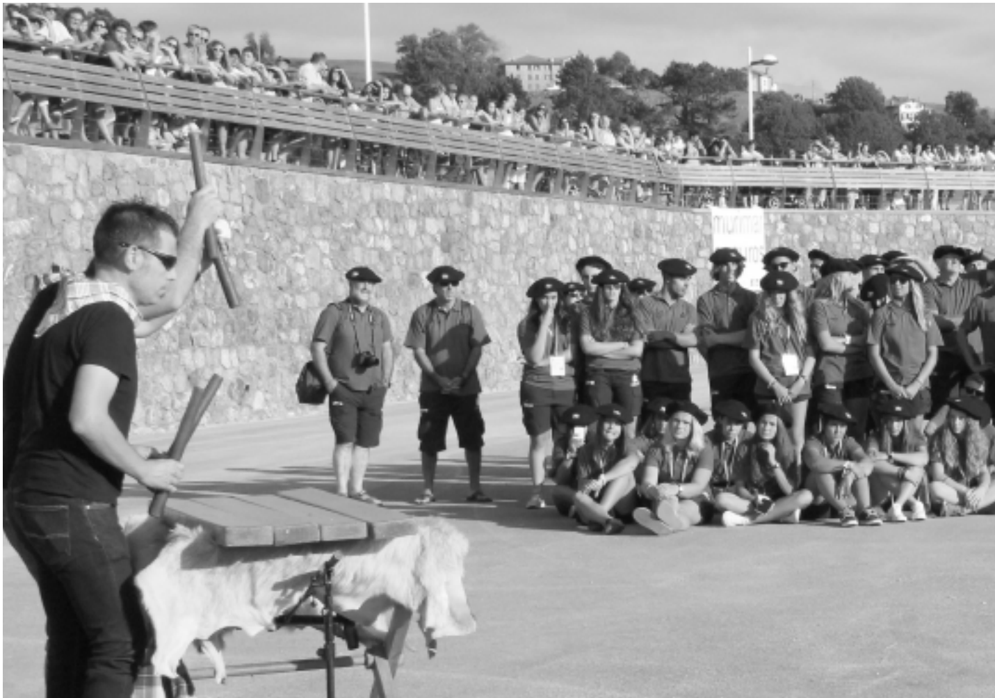
Euskadiko kirolariak Joko Atlantikoen irekieran.