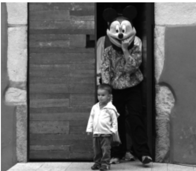
Txupinazoarekin eta kalejirarekin hasi ziren festak Aian . KARKARA