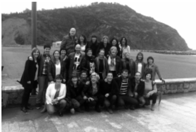
1975 urtean jaiotakoak.

Diotenez duela 33 urte elkartu ziren lehen aldiz Orion urte berean jaiotako neska-mutilak mahai baten bueltan urtemuga ospatzera. Garai hartan 39 urte bete zituzten, eta, orduetik urtero-urtero egin dute bazkaria edo afaria. Ohitura hori beste hainbat jeneraziok ere hartu du.