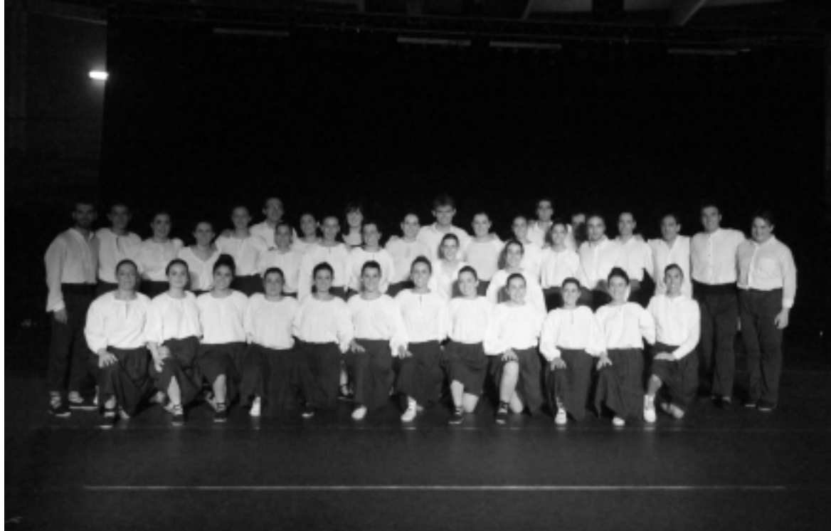
Harribil dantza taldearen emanaldian parte hartu zuten dantzariak, ikuskizunaren ondoren . KARKARA