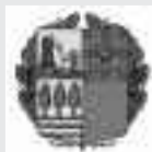
Eusko Jaurlaritzaren Kultura Sailak diruz lagundutako hedabidea