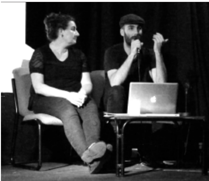
Zumeta eta Gaiton curriculumaren aurkezpenean . KARKARA