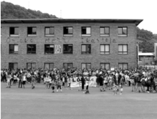
Elkarretaratzea egin zuten Ikastola aurreko plazan. KARKARA