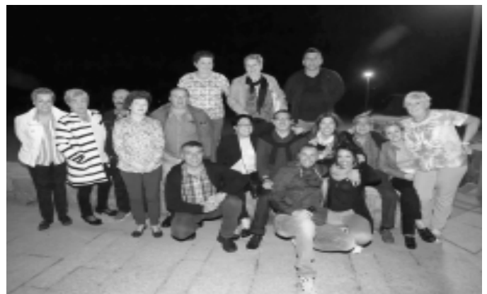
1961ean jaiotakoen afaria.