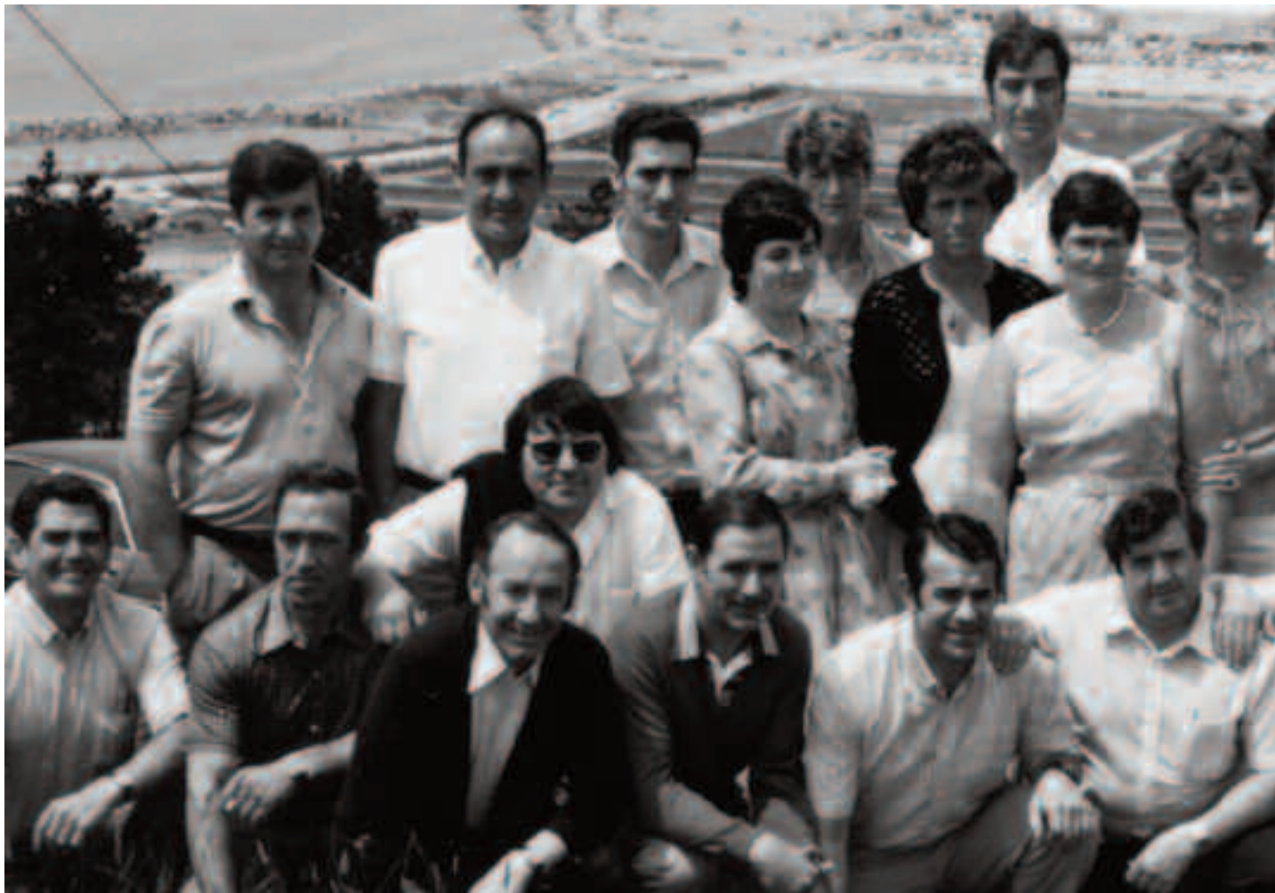
1943an jaiotakoek egin zuten lehen bazkariko argazkia.