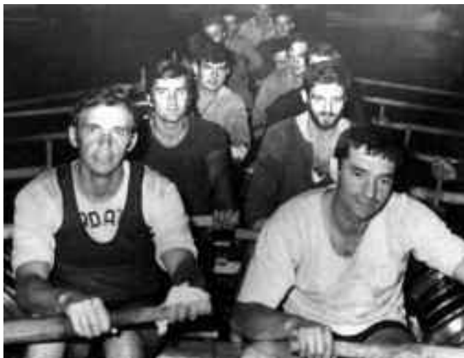
Orioko gazteek gauzatu zuten iraultza euskal arraunean.

La Voz egunkarian: ORIO, UN EJEMPLO A SEGUIR. José Luis Carral, de Pedreña: Del clamoroso triunfo de la tripulación oriotarra tenemos que sacar alguna positiva consecuencia. La de Orio es una preparación extraordinaria. Quedan olvidados aquellos secretillos que cada patrón guardaba celosamente. Ahora en Orio todo es claridad; todos saben lo que hacen y por qué lo hacen. Hacen partícipes a los demás de sus experiencias y conocimientos. Ha cambiado la mentalidad. Valga esta anécdota: con el dinero de una regata han comprado una cámara y un proyector; de esta manera filmaron y luego vieron sus actuaciones (...) Orio es hoy en día, y lo dice un pedreño, es como un catedrático solicitado por todas las universidades para que explique sus saberes.