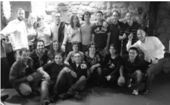
1974 urtean jaiotakoak.