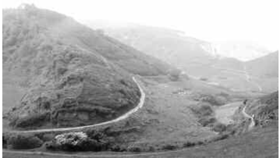
Donejakue bidea, Oriotik Zarautzera. KARKARA

Baina ez hartu nire kritika serio, osasuna behar da ze erremedio, Gainera plazer hutsa da eta dedio! bakoitzari gorputzak bale esango dio, bitarten ondo pasa mendia medio!