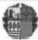
Eusko Jaurilaritza Kultura Sailak diruz lagundutako hedabidea