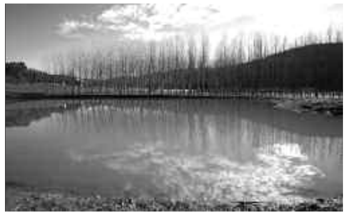
Ura igerilekua bailitzan, bare . IBAN EGIUREN