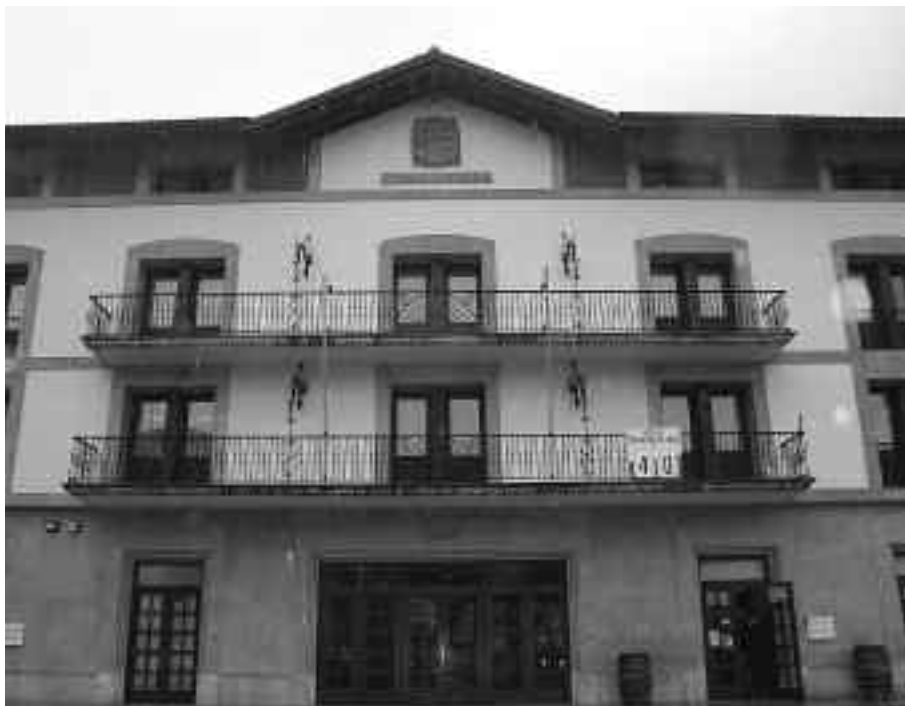
Udaletxearen fatxada banderarik gabe. KARKARA

Soka luzeko historia da espainiar banderarena. Udalerrri guztiak busti ditugaiak eta ia denek bete dute legedia, azkena, Aia. Orioko Udalak, ordea, ezer gertatu ez balitz bezala jokatzen du eta ez du banderarik etxe-aurrean.