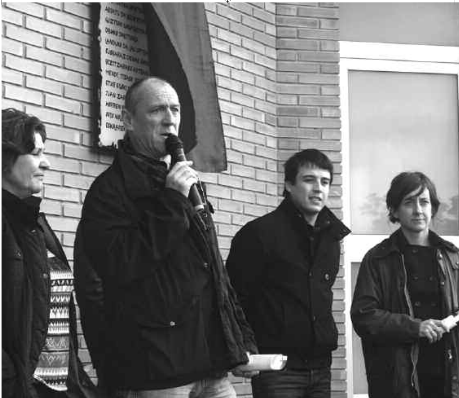
Zubizarreta DBHko inaugurazioan. KARKARA