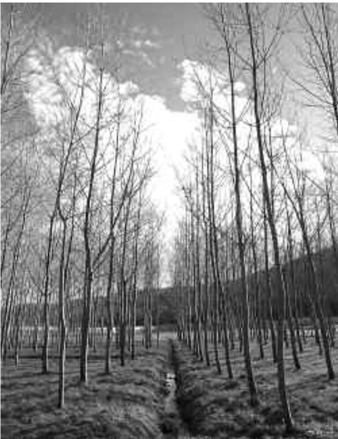
Landatutako zuhaitzak . IBAN EGIUREN