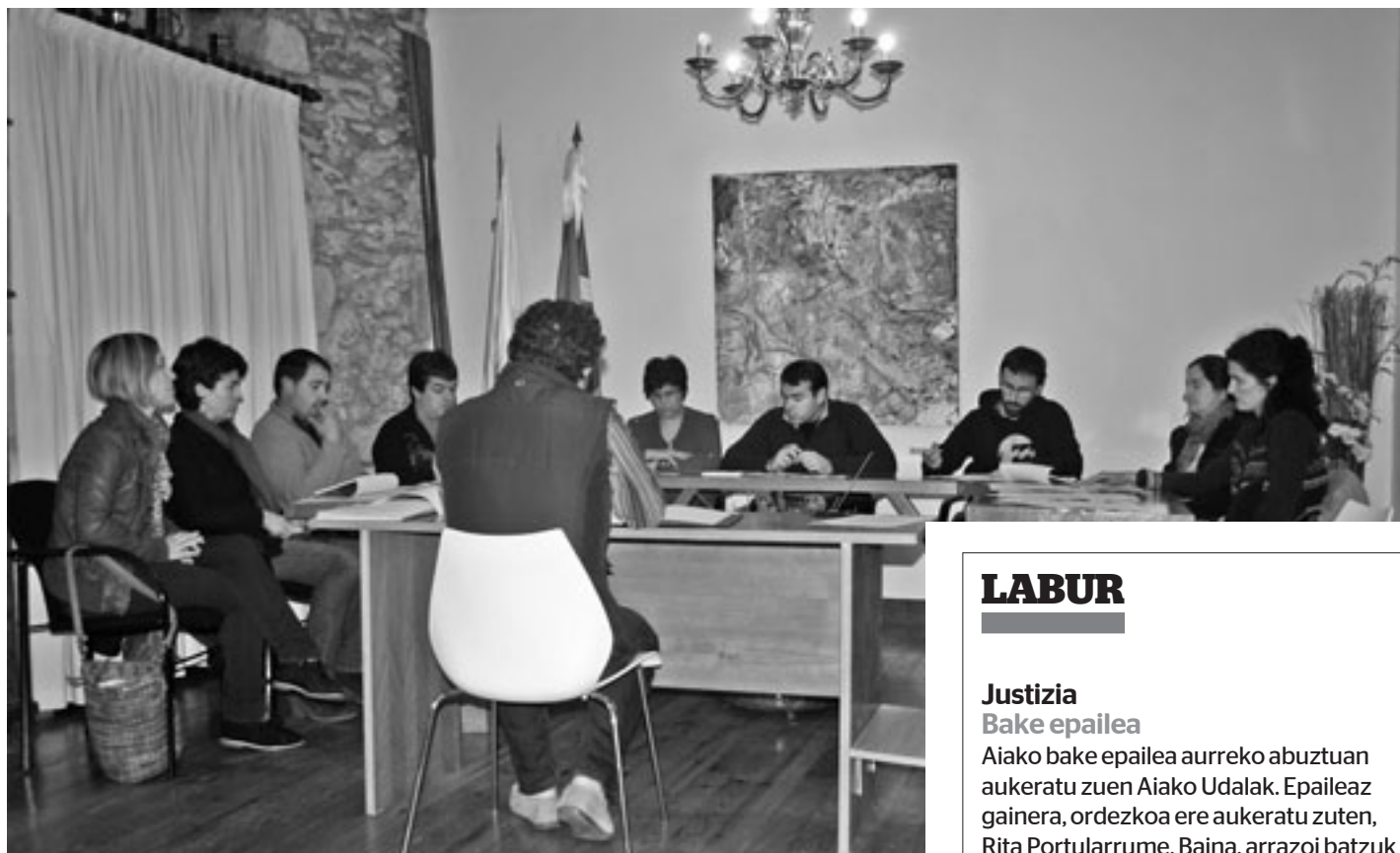
Zergak igotzea erabaki du Aiako Udalak. KARKARA