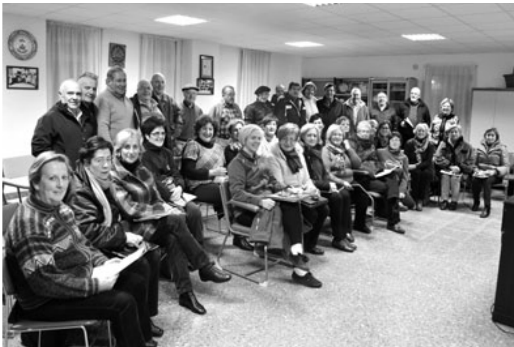
Euskal mezaren entsegua egin dute herriko abesbatzetako kantariak. KARKARA