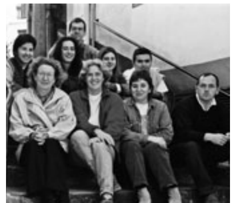
Taldeko aurpegiak aldatuz joan dira. KARKARA