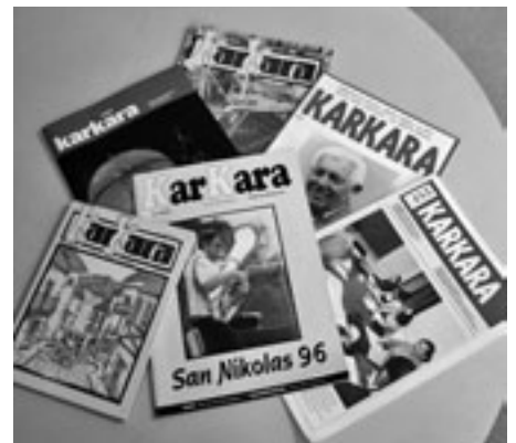
Itxura berria izango du KARKARAK. KARKARA

Orain, ordea, berehalakotasunaren aroan bizi gara eta informazioa toki guztietatik iristen da. Horrek ere aldaketak ekarri ditu gurean eta iritzi eta bestelako kolaborazioak leku zabalagoa hartzen joan dira KARKARAN. Orain are eta gehiago zabaldu nahi dugu ate hori. Datorren sanpedrotan beteko ditu 25 urte KARKARAK eta zerbait polita egin nahi dugu.