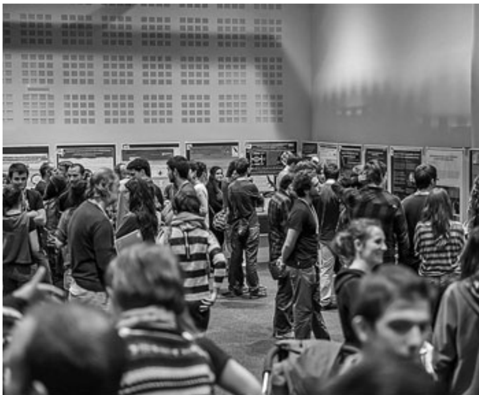
Jende asko izan zen UEUK antolatutako Natur Zeientzien topaketetan. UEU