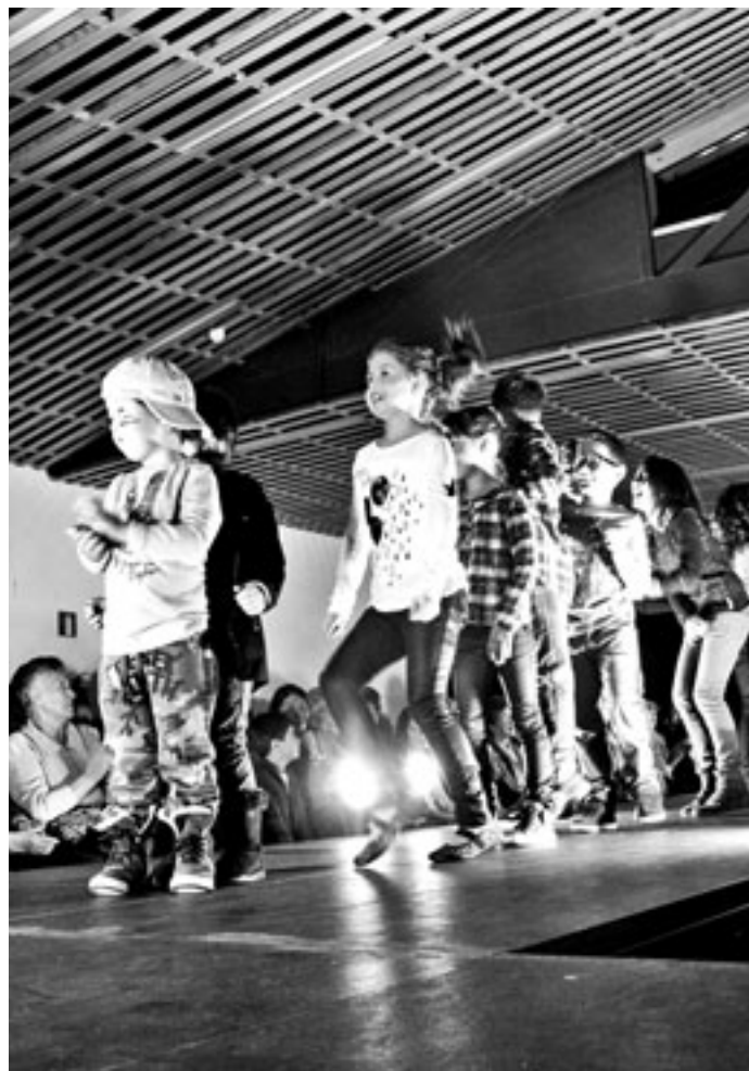
Txikienek poza eta segurtasuna erakutsi zuten pasarelan. KARKARA

Arropari dagokionean estilo askotarikoa ikusi ahal izan genuen, aukera zabala benetan! Ez dezala inork esan Orion ez dagoela estilo eta adin askotako jendearentzako arroparik! Ezustean hartu ninduen egia esan! Arropaz gain, beste zenbait osagarri ere ikusi genuen: eskola-materiala, aterkiak, maletak, betaurrekoak... Zuzeneko mu-