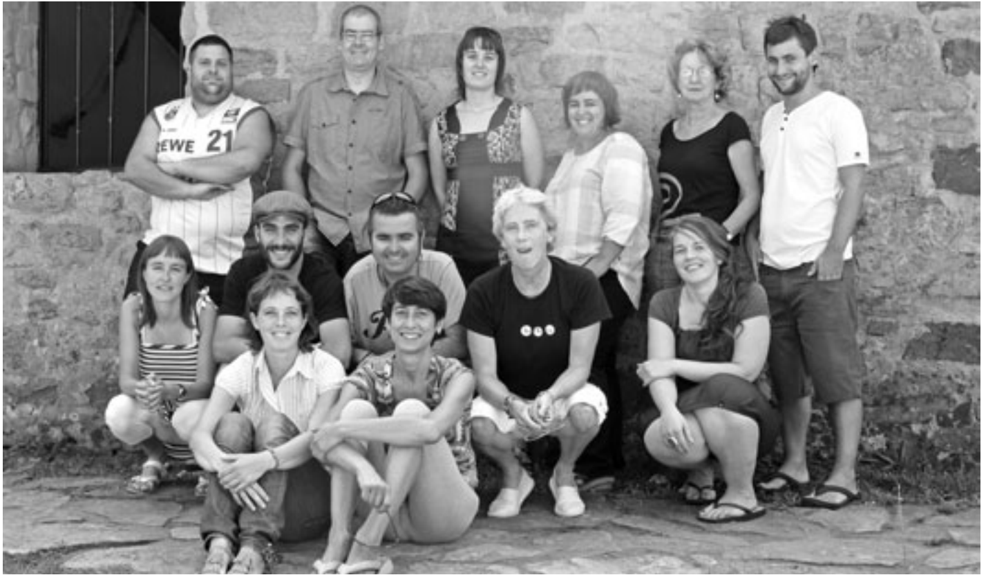
2012ko ekainean eman zion erreleboa aurreko taldeak oraingoari. KARKARA