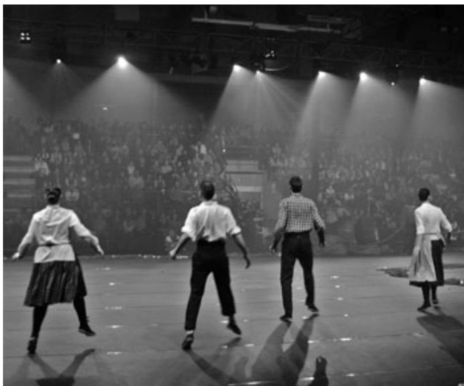
Jendez gainezka izan ziren kiroldegiko harmailak aurkezpen ekitaldian. KARKARA