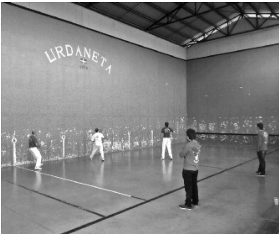
Eskuz binakako finalak jokatu zituzten; igandean palakoak izango dira. MAIALEN MANZISIDOR