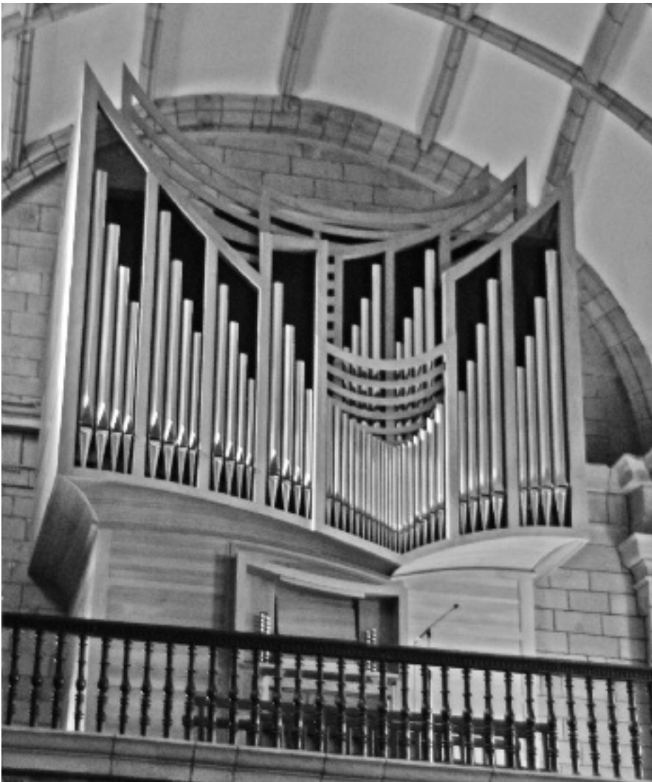
Haritzarekin egina dago organoaren kanpoaldea. KARKARA