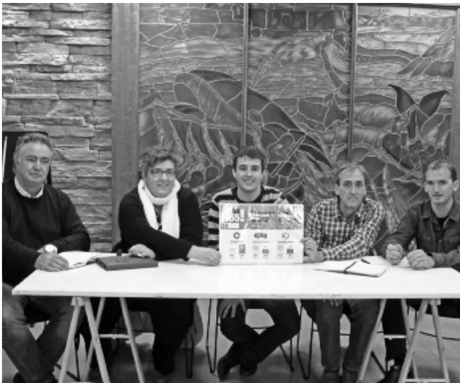
Alderdi guztien arteko akordioa lortu da oriotarrek gehiago birziklatzeko bidean. KARKARA