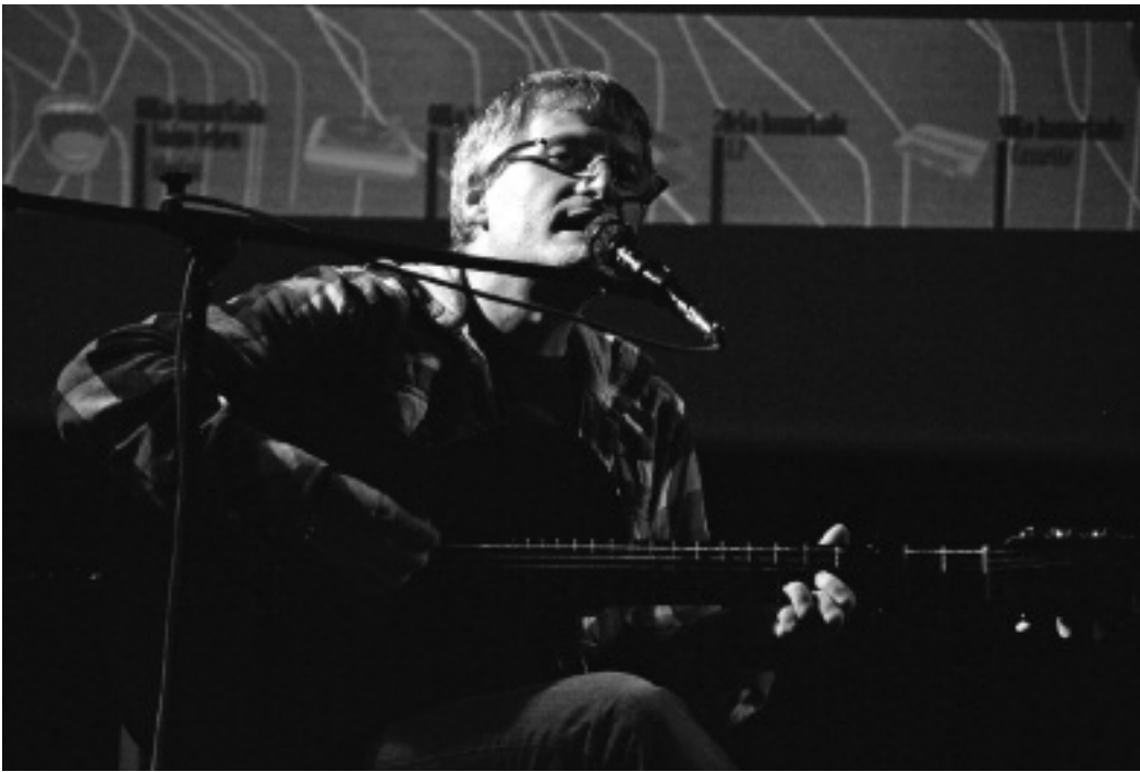
Abenduaren 1ean Donostiako Antzoki Zaharrean izango da Markezen doinuak entzuteko aukera. KARKARA