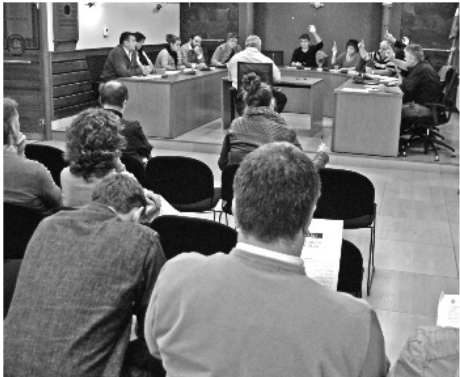
Gobernuaren aldeko botoekin atera ziren aurrera urriaren 31ko gai guztiak. KARKARA

zioak ere zehaztu dituzte. Oinarrizko kirol medikuntza azterketa 35 eurotan egin ahal izango da, fisioterapia saio bakoitza 35 eurotan, lehenengo hipoxia saioa 60 euro ordainduko da eta gainerako hipoxia saioak 40 euro balioko dute.