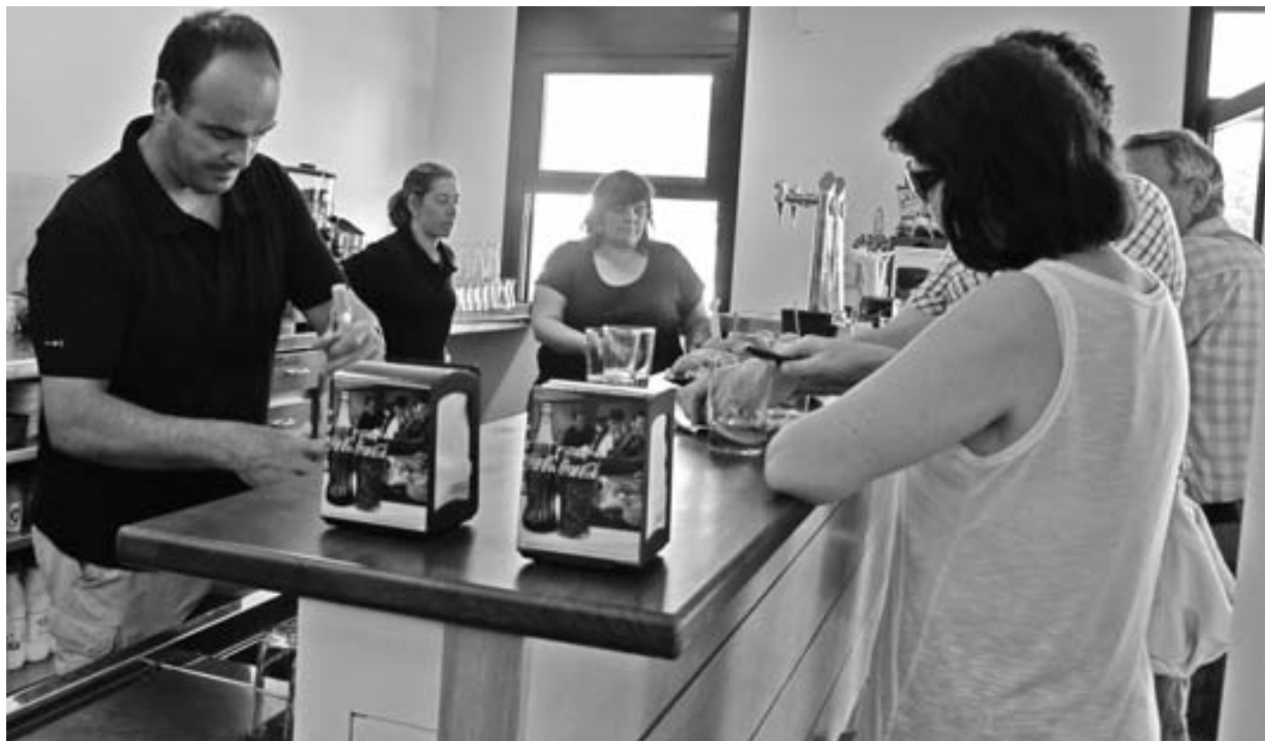
Kanpineko bezeroak oso pozik geratu dira tabernan egindako lanekin eta bertako zerbitzu eta ordutegiekin. KARKARA