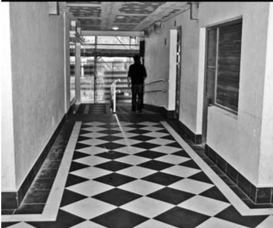
Inbertsio txikiak egiten ari da Orioko Udala herriko kale eta ekipamenduak hobetzeko.