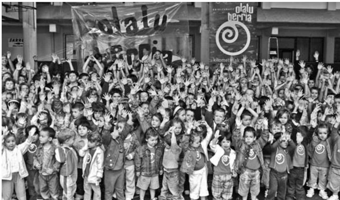
Aurrekoan Zarauzkoarekin batera antolatu bazen ere, oraingoan Orioko Ikastolak bakarrik antolatuko du Kilometroak festa. KARKARA