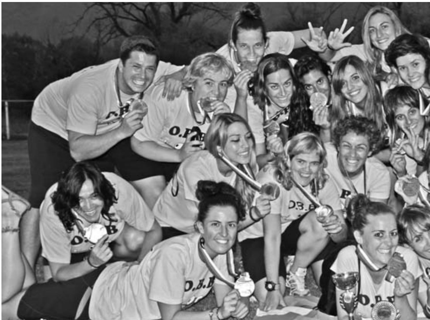
Domina zintzilik zutela bukatu zuten bizkorrek Europako Txapelketako ibilbidea. ORIOKO BATE BIZKORRAK