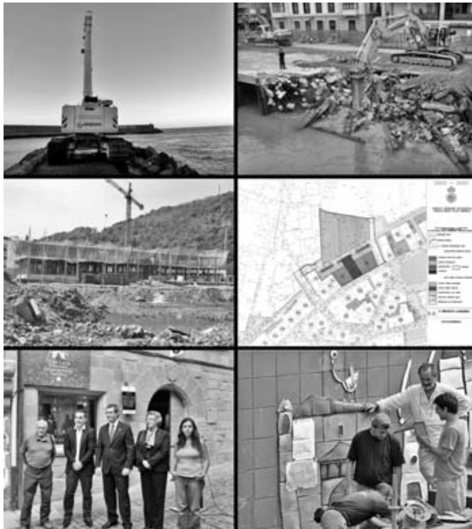
2007tik gaur arte lan asko egin dira Orion, asko Plan Nagusiaren baitan. KARKARA

Uztailaren 24an egindako udalbatzarrean onartuta, lehiaketara atera da Orioko hiri antolamendurako Plan Nagusiaren eta ingurumen eraginaren ebaluazio bateratuaren idazketa-lana