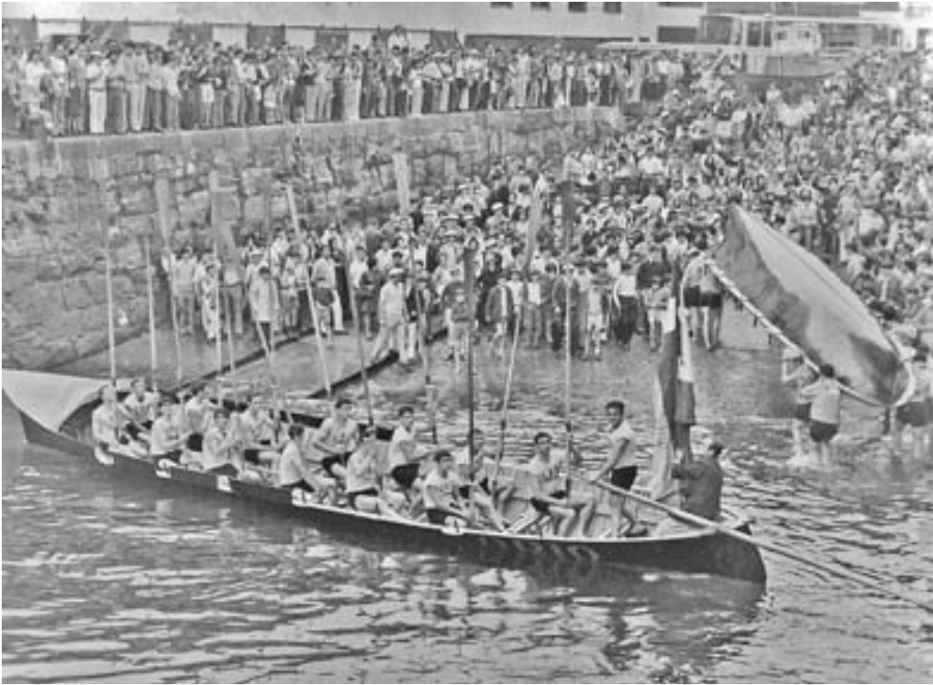
Altxerri patroi, 1971n Oriok Kontxako bandera irabazi berritan.