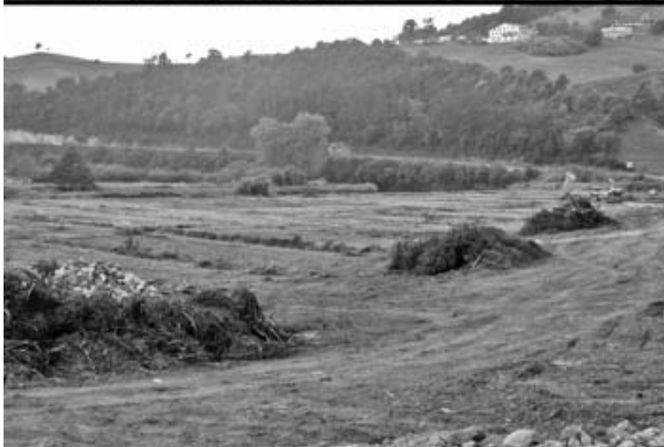
Makinekin zeuden zuhaitz asko kendu eta kotak aldatu dituzte Saria inguruan. HERRIO NATUR TALDEA