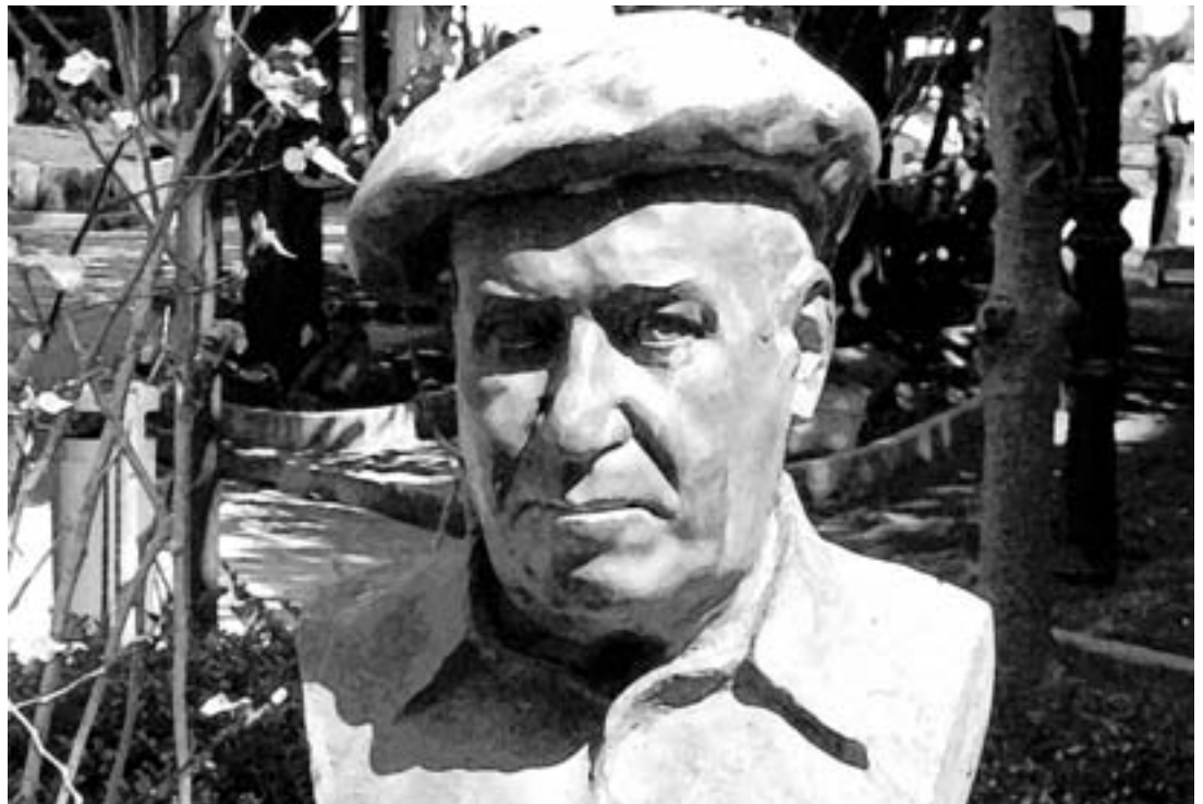
XXIX. Basarri Bertso paper Sarian bigarren saria irabazi dute Esoainek eta Lizarazuk.

KARKARAK ez du bere gain hartzen aldizkarian adierazitako esanen edota iritzien erantzukizunik. KARKARAN argitaratutakoa berreman daiteke, osorik edo zatika, baldin eta iturria aipatzen bada.