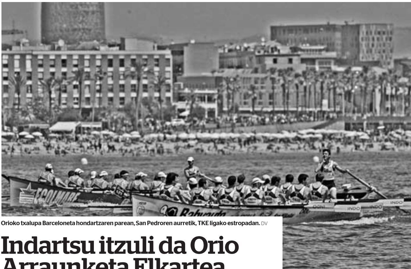
Orioko txalupa Barceloneta hondartzaren parean, San Pedroren aurretik, TKE ligako estropadan. DV