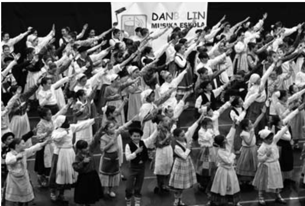
Jaialdi bukaeran dantzari guztiek elkarrekin egin zuten dantza. MUNIA LARBURU