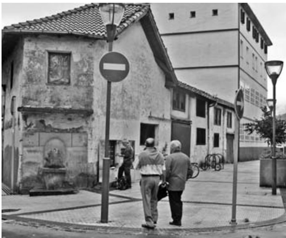
Norteko iturriari tratamendu berezia eman eta porlanezko estalpea kenduko diote. KARKARA