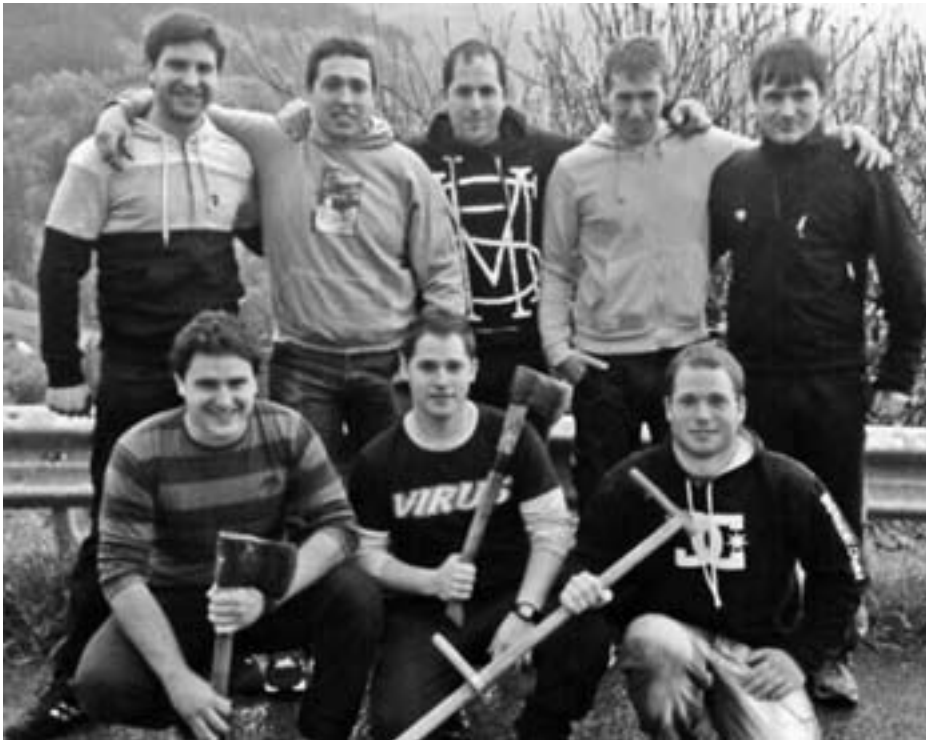
Argazkiko mutilak arituko dira lehian Iturriozko herri-kirol proban. ITURRIOZKO FESTA BATZORDEA