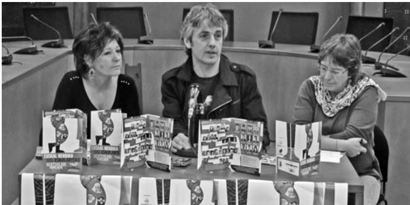
Dorronsoro, Respaldiza eta Irigoien txapelketa aurkezteko prentsaurrekoan.

200 laguntzako bazkaria ere antolatuko dute eta txartelak bertan salduko dira.