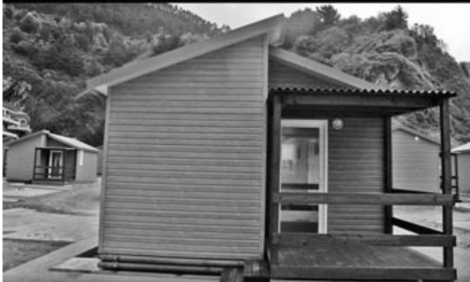
Ingurua txukuntzea eta azken xehetasunak baino ez dira falta. KARKARA