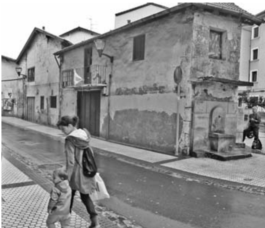
Fatxadak, leihoak eta ateak txukundutakoan, murala margotuko dute bukaeran. KARKARA

Bukaeran, Norteko iturria ere txukundu egingo dute. Tratamendu berezi bat emango diote eta porlanezko estalpea kendu, inguruko harriak bistan utziaz. Hori egin eta gero, iturriaren gainean balearen inguruko elementu ikonografiko bat jarriko dute, apaingarri bezala.