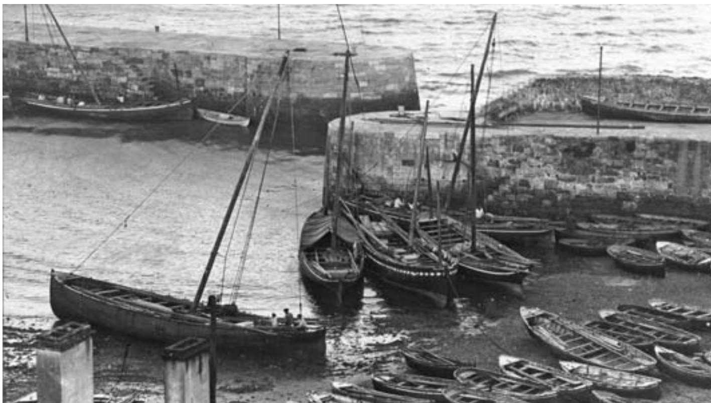
Ontzi barruan egiten zuten lo gure arrantzaleek Candásen porturatzean. J.M. KARRERA

balioetan hezteko helburuarekin sortu zen.