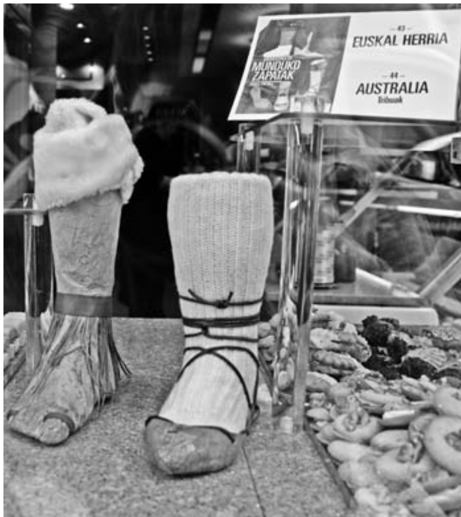
Zapatak eta haren gaineko informazioa jarri dute erakusleihoetan. KARKARA

Ekainaren 1ean jarri zituzten zapatak jendaurrean eta hilaren 30era arte iraungo du zapaten historia azaltzeko egin duten erakusketak. Guztira 80 zapata mota ikusi ahal izango da