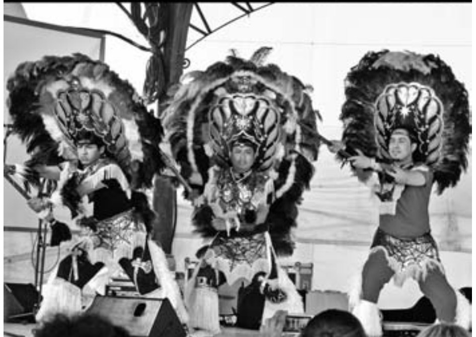
Aurten ere trikitalari txapelketa, hurren danborrada eta aniztasunaren jaia izango dira. KARKARA