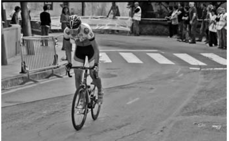
Txirrindulari probek jendea erakartzen dute errepide bazterrera Aian ere. KARKARA