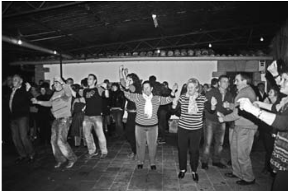
Astero jende asko gerturatzen da Aristerrazura hankak astintzera. KARKARA

Herri bazkaria, omenaldia eta erromeria izango dira jaiaren osagaiak. Trikiti doinuak gustuko dituztenentzat 21 bikote eta talde izango dira Aristerrazuko eszenatokian musika jotzen