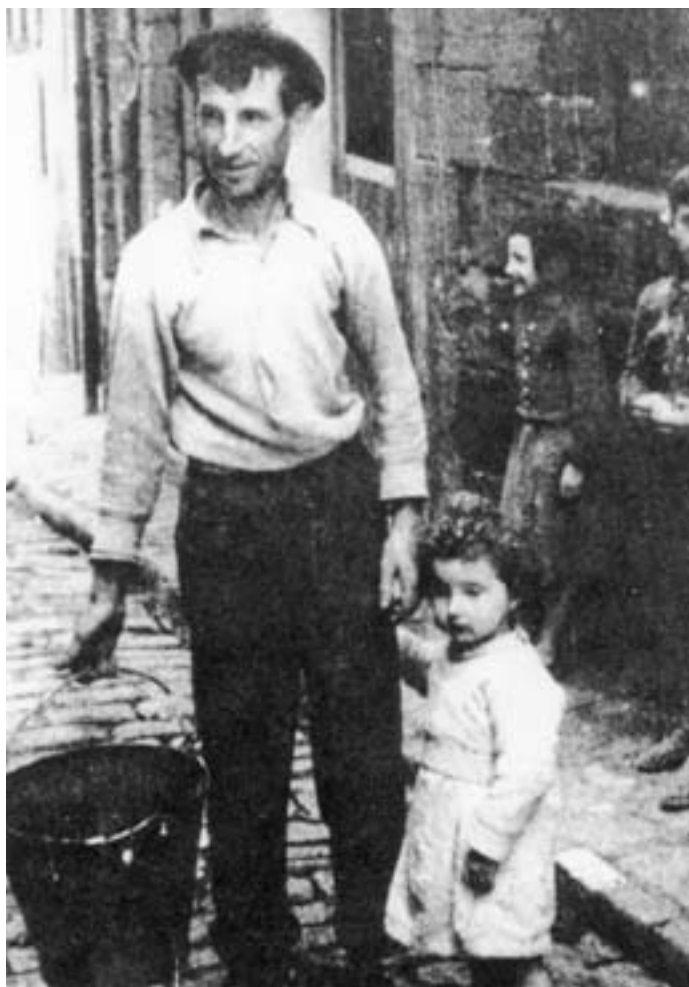
Aita-alabak Orioko Goiko Kalean. ZARAUZKO POSTALAK 36KO GERRA