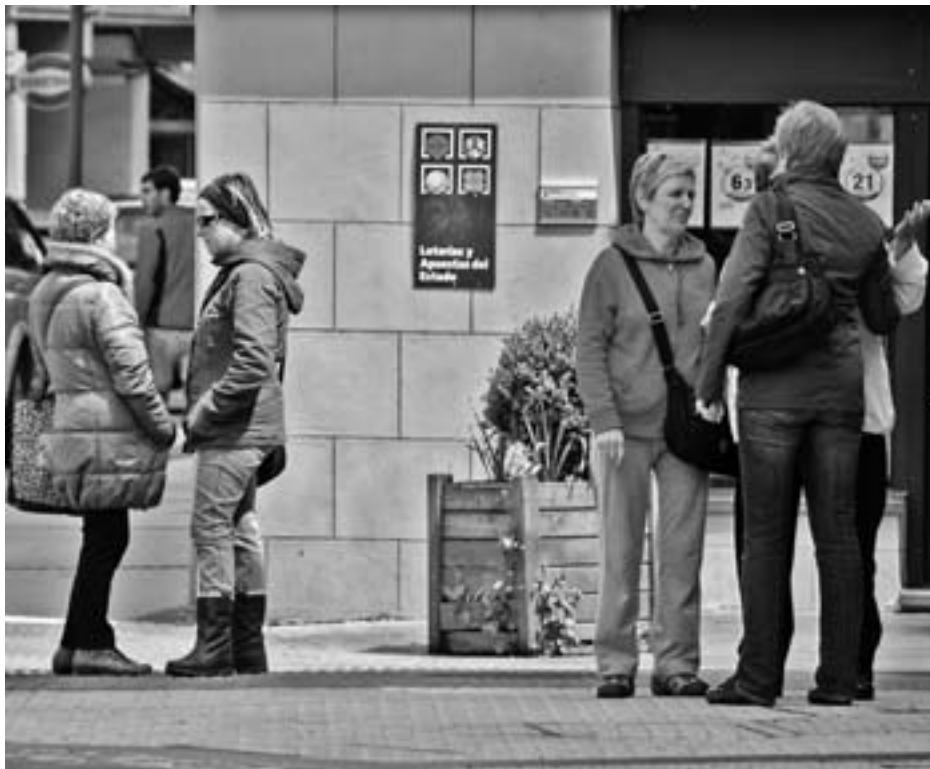
Kale neurketa egiteko garaian eguneroko jardunean entzuten dituzte herritarrak. KARKARA

Neurketa egiterakoan, kalean dabilen jende guztiaren jarduna hartzen da kontutan: zein ari den euskaraz, zein gaztelaniaz edo beste hizkuntzaren batean, zein den beren sexua, zein adin taldeetan sartzen diren eta bestelako informazioa.