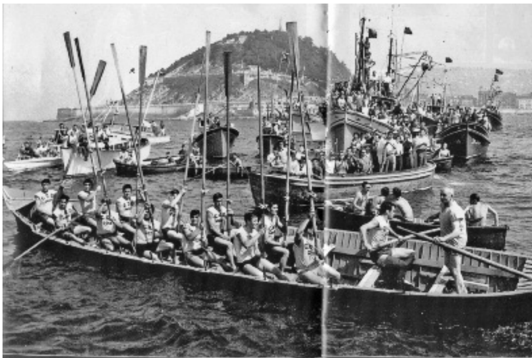
1967an, Michelin-en aurretik sartzea ospatzen. Ez zeuden ez Urtain ez Trabuko .