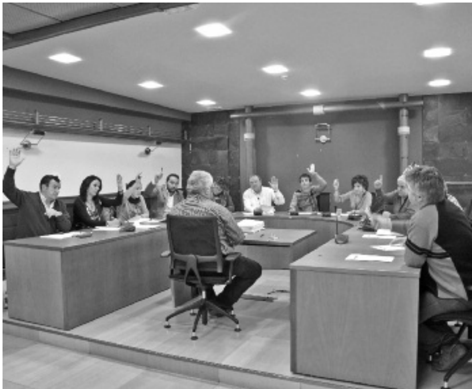
Gai asko aho batez onartu bazituzten ere izan zen ezadostasunik.