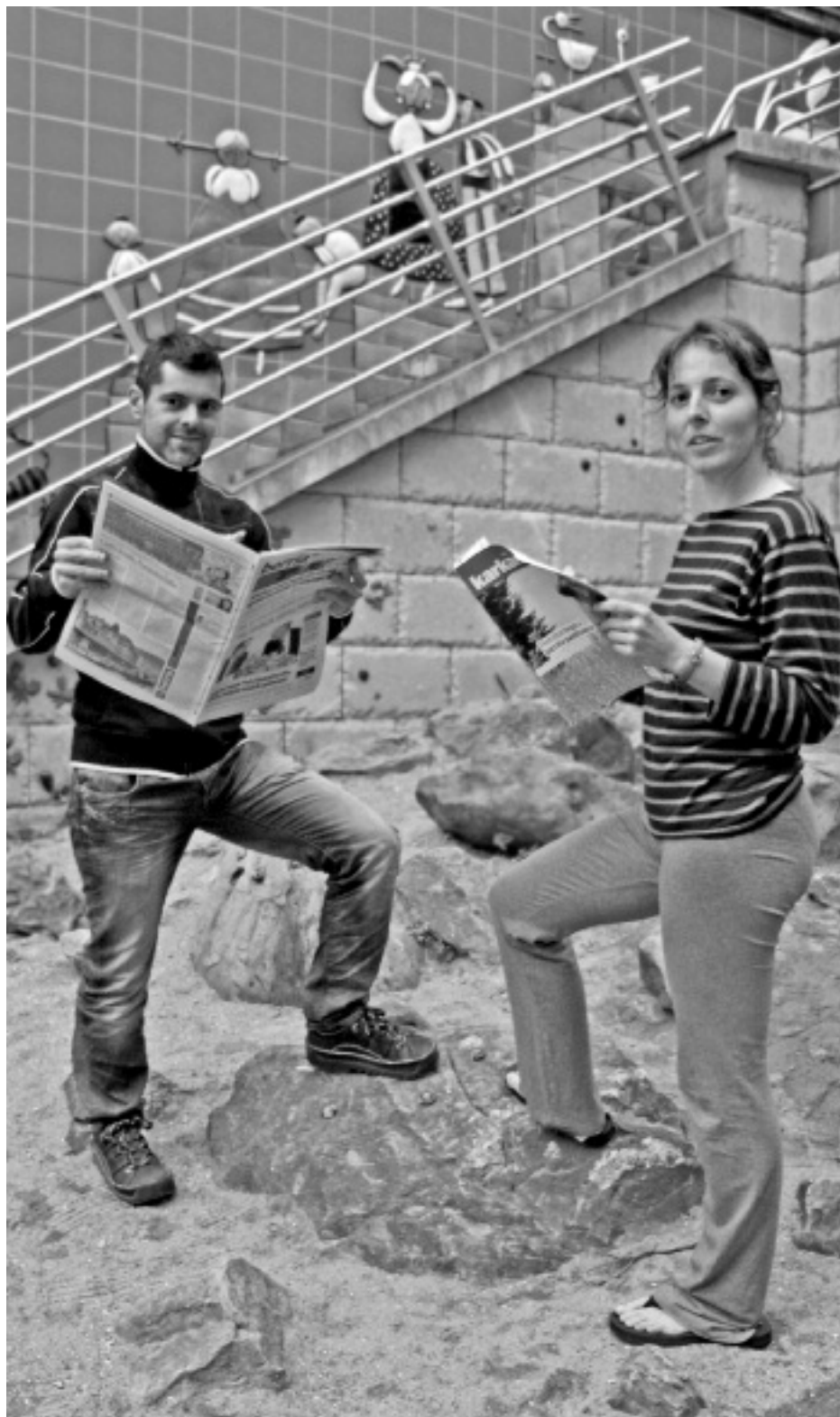
Berriako eta Karkarako ordezkariak. KARKARA