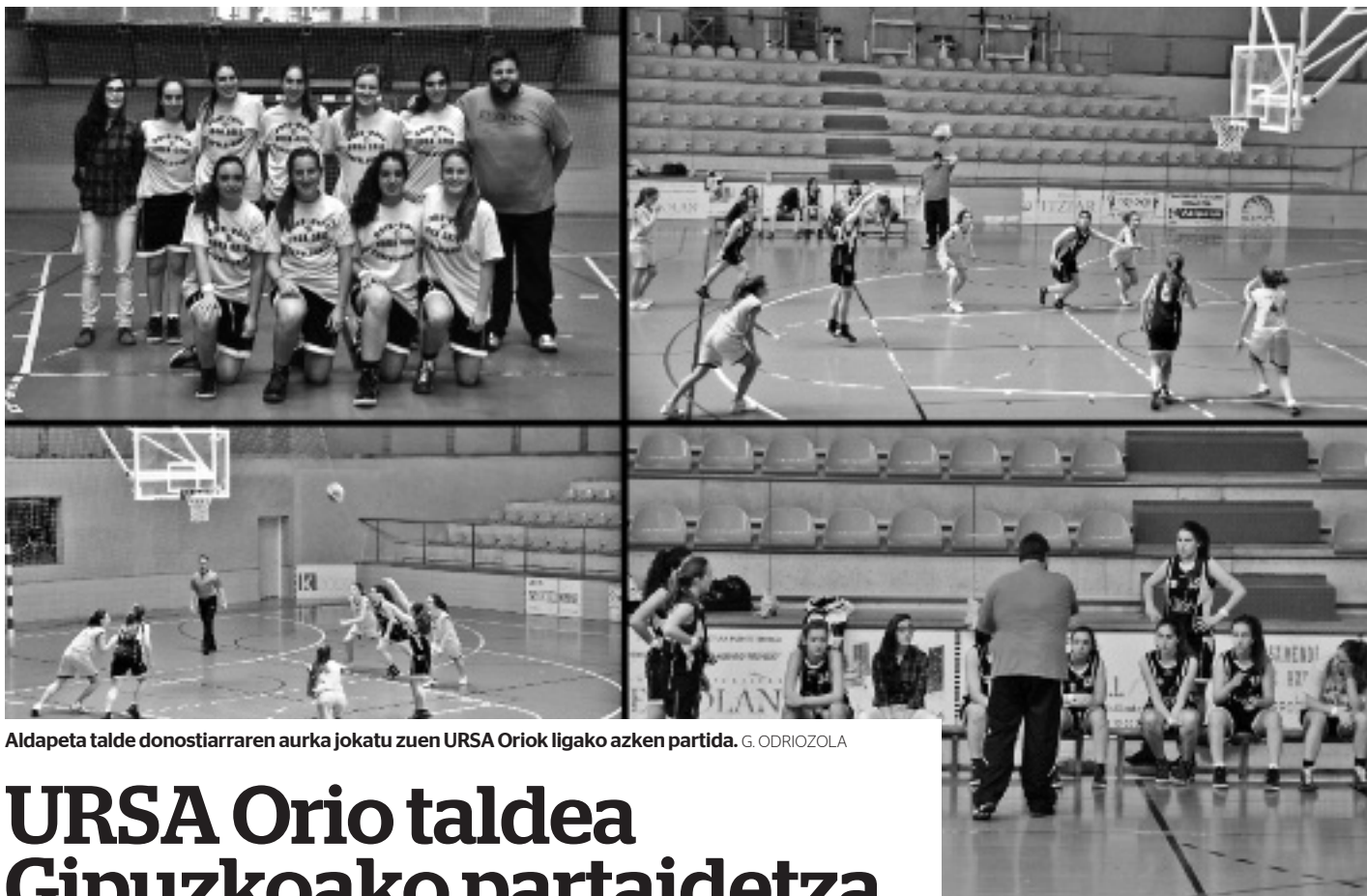
Aldapeta talde donostiarraren aurka jokatu zuen URSA Oriok ligako azken partida. G. ODRIOZOLA