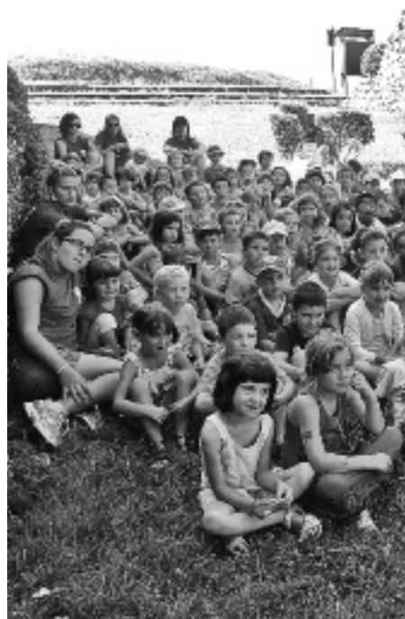
Haurrak udaleku irekietan. TXURRUMUSKI

KARKARA.COM-en edo Orioko Kultur Etxean dagoen eskaera-orria bete eta txurumuskiko.orio@gmail.com helbidera bidali beharko dute interesa dutenek.