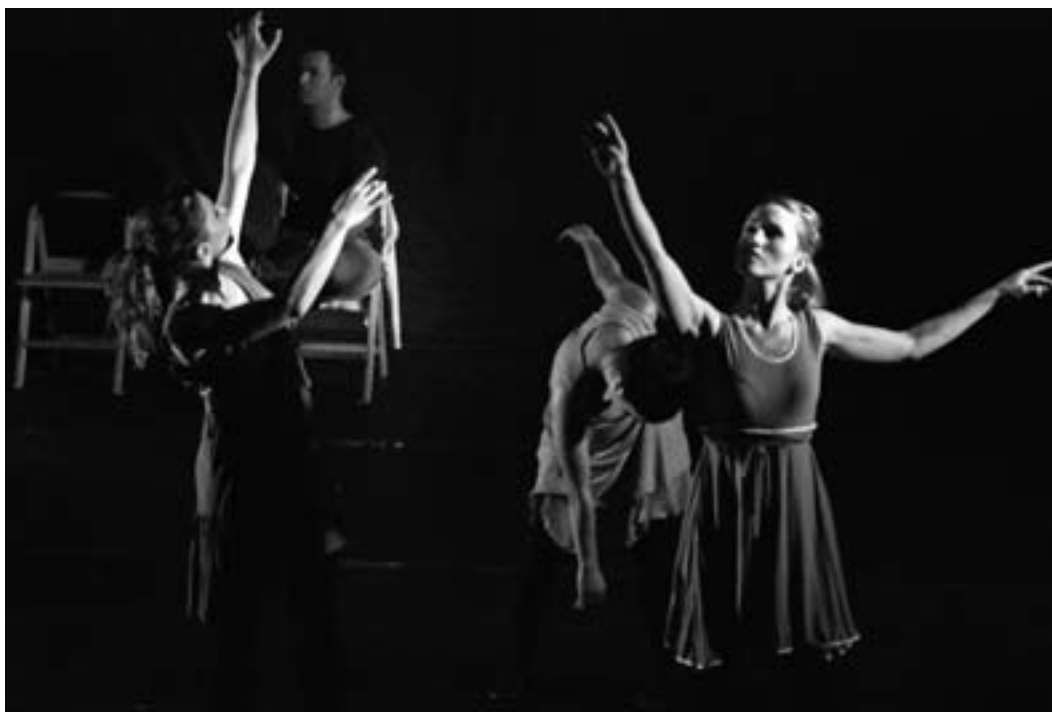
Kiroldegira joan zirenen gozamenerako, ederki uztartu zituzten bertsoa eta dantza bost dantzariak. KARKARA