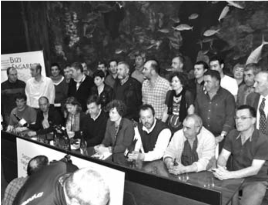
Donostiako Akuariumean izan ziren elkartearen ordezkariak -tartean Aiako alkatea-. BIZI SAGARDOA