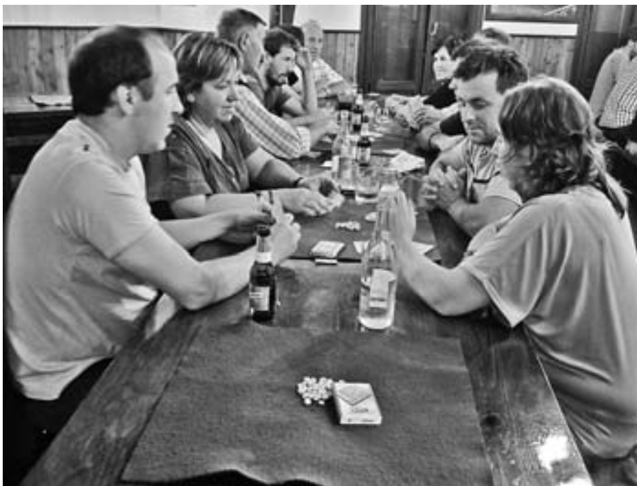
Hilean behin izango dir mus txapelketak. GOIKO KALEKO FESTA BATZORDEA

Bederatzi jardunaldiko Liga izango da aurtengoa. Sanikolasetako egitarauaren barruan jokatu da azkenekoa, finala. Denboraldia txukunen egin duten 16 bikote sailkatuko dira finalerako.