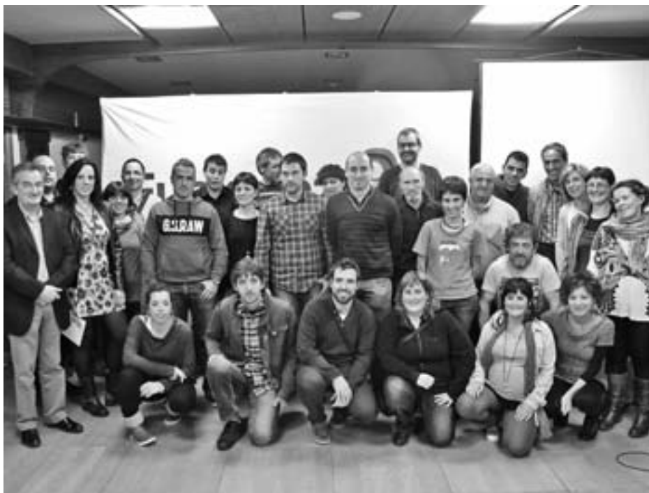
Erakundeetako ordezkari ez gain, herritarrak ere izan ziren Bizi-biziren aurkezpenean.