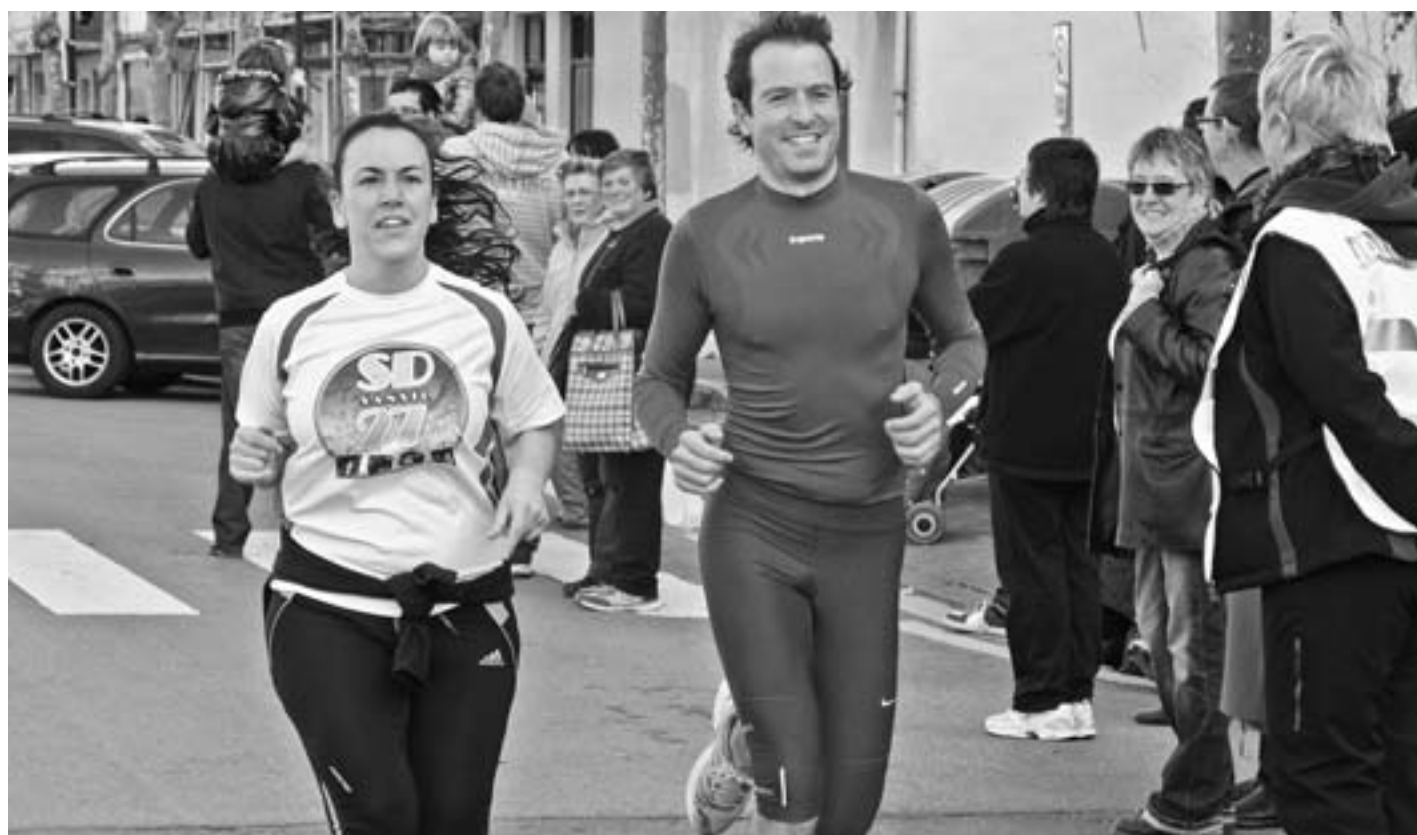
Kultur Etxe atzetik atera, hondartzako buelta egin eta Goiko Kaletik pasata, Herriko Plazan bukatuko da lasterketa. KARKARA

Lasterketa antolatuta dago, baina maiatzaren 18rako laguntza behar dugu KARKARAK eta Berriak, besteak beste, bidegurutzeak zaintzeko eta trafikoa kudeatzeko. Eskuzabalik hartuko dugu laguntzeko prest dagoena eta gurekin harremanetan jartzeko deia egin nahi diogu, KARKARARA bertara –Kultur Etxera– etorrita, 943 831 527 telefonora deituta edota karkara@karkara.com helbide elektronikora idatzita.